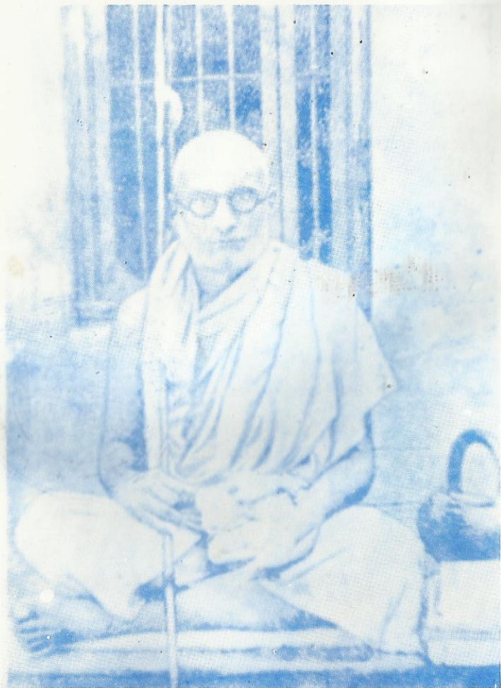
ਸਵਾਮੀ ਰਾਮ ਤੀਰਥ ਜੀ ਦੰਡੀ ਸੰਨਿਆਸੀ ਸਿੱਖੀ-ਮੰਡਲ ਵਿੱਚ ਆਉਣ ਤੋਂ ਪਹਿਲਾਂ