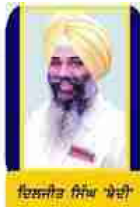
ਇਲਾਹੀ ਸਿੱਖ ਖੇਤੀ

ਹੁਣ ਜਦੋਂ ਅਸੀਂ 21ਵੀਂ ਸਦੀ ਦੇ ਦੂਜੇ ਦਹਾਕੇ ਦੇ ਅੰਤ ਵੱਲ ਜਾ ਰਹੇ ਹਾਂ ਤਾਂ ਦੇ ਚੀਜ਼ਾਂ ਸਪੱਸ਼ਟ ਰੂਪ ਵਿੱਚ ਉਜਾਗਰ ਹੋਈਆਂ ਹਨ ਕਿ ਪ੍ਰਚਾਰ ਦੀ ਗ੍ਰਿਫਤ ਵਿੱਚ ਹੈ। ਜਿਸ ਤਰ੍ਹਾਂ ਵਿਸ਼ਵ ਇੱਛਾ ਤੇ ਚੇਣ ਅਨੁਸਾਰ ਬੈਠੇ ਵੇਖ ਸਕਦੇ ਸੂਚਨਾ ਦਾ ਪ੍ਰਸਾਰਨ ਇੰਨੀ ਤੇਜ਼ ਗਤੀ ਕਈ ਵਾਰ ਅਨੁਮਾਨ ਲਗਾਉਣਾ ਵਿਗਿਆਨ, ਮਸ਼ੀਨ ਤੇ ਸੰਚਾਰ ਦੇ ਪ੍ਰਭਾਵ ਪ੍ਰਚਾਰ ਦੀਆਂ ਤਕਨੀਕੀ ਜੁਗਤਾਂ ਦੇ ਹੈ।