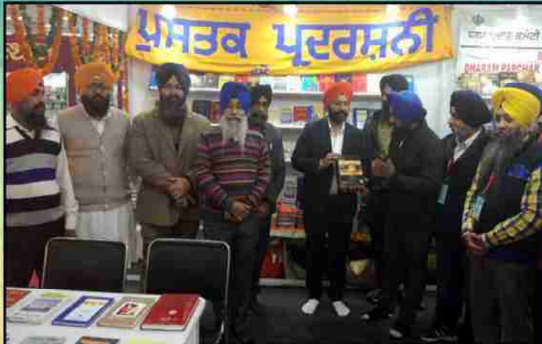
ਦਿੱਲੀ ਦੇ ਪ੍ਰਗਤੀ ਸੈਦਾਨ ਵਿਚ ਲਗਾਏ ਗਏ ਪੁਸਤਕ ਮੇਲੇ ਸਮੇਂ ਸ਼੍ਰੋਮਣੀ ਗੁ: ਪ੍ਰ: ਕਮੇਟੀ ਵੱਲੋਂ ਲਗਾਈ ਗਈ ਪੁਸਤਕ ਪ੍ਰਦਰਸ਼ਨੀ ਦਾ ਇਕ ਦ੍ਰਿਸ਼।