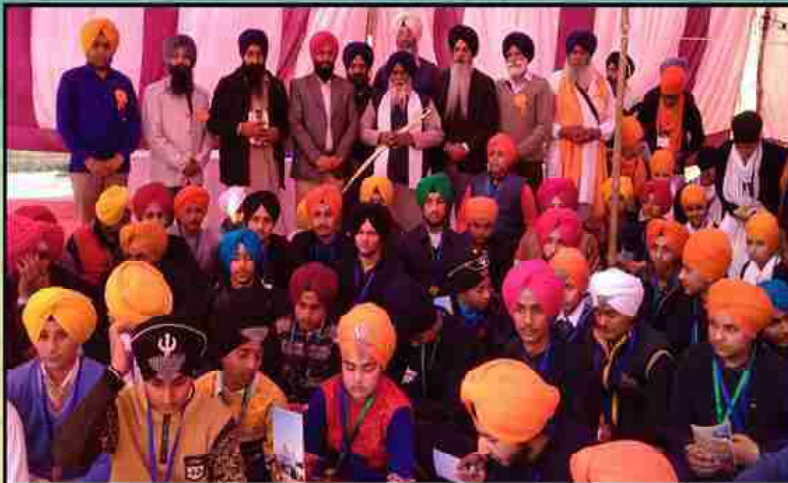
ਧਰਮ ਪ੍ਰਚਾਰ ਕਮੇਟੀ ਵੱਲੋਂ ਅਰੰਭੀ ਗਈ ਪ੍ਰਚਾਰ ਲਹਿਰ ਤਹਿਤ ਗੁਰਦੁਆਰਾ ਖੁਲਨਾ ਸਾਹਿਬ ਗੁਰਦਾਸਪੁਰ ਵਿਖੇ ਕਰਵਾਏ ਗਏ ਸੁੰਦਰ ਦਸਰਾ ਅਤੇ ਦਮਾਲਾ ਸਜਾਉਣ ਦੇ ਮੁਕਾਬਲੇ ਵਿੱਚ ਭਾਗ ਲੈਣ ਸਮੇਂ ਵਿਦਿਆਰਥੀ ਅਤੇ ਪ੍ਰਬੰਧਕ।