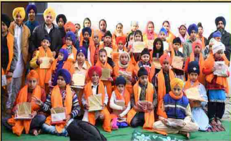
ਸ਼੍ਰੋਮਣੀ ਕਮੇਟੀ ਮੁਲਾਜ਼ਮਾਂ ਵੱਲੋਂ ਕੁਆਰਟਰ ਸ੍ਰੀ ਦਰਬਾਰ ਸਾਹਿਬ ਅਕਾਲੀ ਕਾਲੋਨੀ ਮੁਲਤਾਨਵਿੱਚ ਰੋਡ ਵਿਖੇ ਦਸਮੇਸ ਪਿਤਾ ਜੀ ਦੇ ਪ੍ਰਕਾਸ਼ ਪੁਰਬ ਨੂੰ ਸਮਰਪਿਤ ਕਰਵਾਏ ਗਏ ਗੁਰਮਤਿ ਸਮਾਗਮ ਸਮੇਂ ਬੱਚਿਆਂ ਨੂੰ ਸਨਮਾਨਿਤ ਕੀਤੇ ਜਾਣ ਦਾ ਦ੍ਰਿਸ਼।