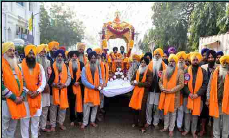
ਸ਼ਹੀਦ ਬਾਬਾ ਦੀਪ ਸਿੰਘ ਜੀ ਦੇ ਜਨਮ ਦਿਹਾੜੇ ਮੌਕੇ ਸ੍ਰੀ ਅਕਾਲ ਤਖ਼ਤ ਸਾਹਿਬ ਤੋਂ ਸਜਾਏ ਗਏ ਨਗਰ ਕੀਰਤਨ 'ਚ ਸ਼ਾਮਲ ਸ਼੍ਰੋਮਣੀ ਕਮੇਟੀ ਦੇ ਮੈਂਬਰ ਸਾਹਿਬਾਨ, ਅਧਿਕਾਰੀ ਅਤੇ ਸੰਗਤਾਂ।