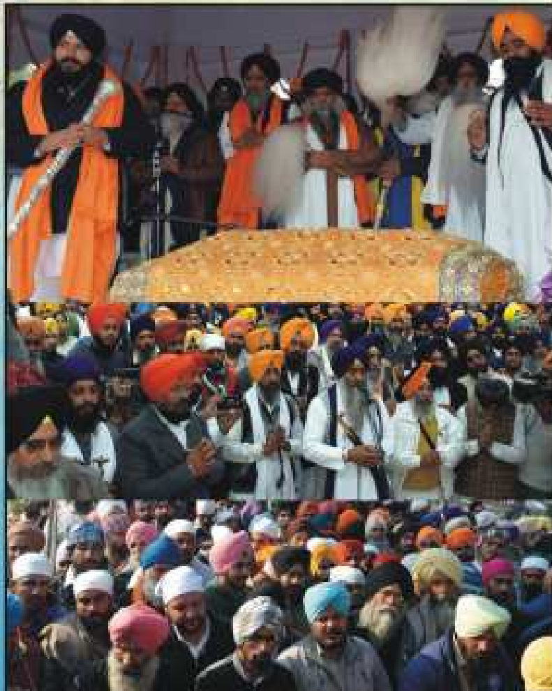
ਸਾਹਿਬਜ਼ਾਦਿਆਂ ਦੀ ਠਾਠਾਈ ਛਲਾਸ ਤੂੰ ਸਾਹਿਬਜ਼ਾਦੇ ਗੁਰਦੁਆਰਾ ਸ੍ਰੀ ਬਤੀਸ਼ਕੁ ਸਾਹਿਬ ਤੋਂ ਲਾਏ ਗਏ ਛਾਈ ਠਾਠਾ ਗੋਦਰਾ ਦੀ ਸੰਪੂਰਨਾ ਸਮੇਂ ਗੁਰਦੁਆਰਾ ਸ੍ਰੀ ਕੋਟੀ ਸਰੂਪ ਸਾਹਿਬ ਵਿਖੇ ਆਗਾਜ਼ ਕਰਕੇ ਹੋਏ ਸਿੱਖ ਸਾਥਿਕ ਠਾਠਾਈ ਠਾਠਾਈ ਸਿੱਖ, ਸੰਗਰਾਮ ਠਾਠਾ ਸ੍ਰੀ ਰੋਡਕੁ ਸਾਹਿਬ। ਇਸ ਸਮੇਂ ਠਾਠਾ ਸਿੱਖ ਸਾਹਿਬ ਸਿ. ਸਲਾਮ ਸਿੱਖ ਸੁੱਖ ਸੁੱਖੀ, ਸੁੱਖੀ ਠਾਠਾਈ ਸੁੱਖਾ ਸਾਈਂ ਸਿੱਖਿ ਸਿੱਖਿ ਸਿੱਖਿ, ਠਾ. ਸੁਖ ਸਿੱਖ ਸੁੱਖ ਸਾਹਿਬ, ਠਾਠਾ ਠਾਠਾ ਸਿੱਖ ਸਾਹਿਬ, ਸਿ. ਠਾਠਾ ਸਿੱਖ ਸੁੱਖ ਸੁੱਖੀ ਸੁ: ਸਾਹਿਬਕੁ ਸਾਹਿਬ ਠਾਠਾ ਠਾਠਾ ਸੁੱਖੀ।