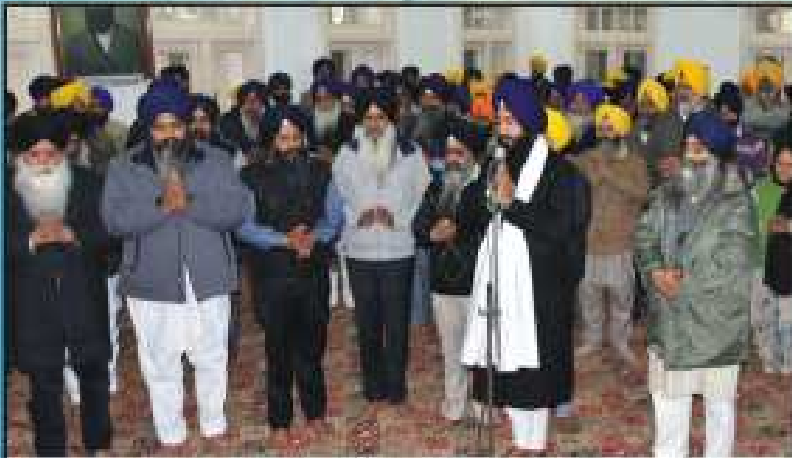
ਛੋਟੇ ਸਾਹਿਬਜ਼ਾਦਿਆਂ ਤੇ ਮਾਰਾ ਹੁਜ਼ੂਰੀ ਜੀ ਦੀ ਸ਼ਹਾਦਤ ਨੂੰ ਸਮਰਪਿਤ ਰੋਜਾ ਸਿੰਘ ਸਮੁੰਦਰੀ ਹਾਲ ਵਿਖੇ ਸੁੰਮਣੀ ਕਮੇਟੀ ਵੱਲੋਂ ਸਮੂਹਿਕ ਰੂਪ ਵਿਚ ਕੀਤੀ ਗਈ ਆਦਰਸ਼ ਸੇਕੇ ਵਿਭੰਭਰ ਹੋਏ ਮੁਲਾਜ਼ਮ।