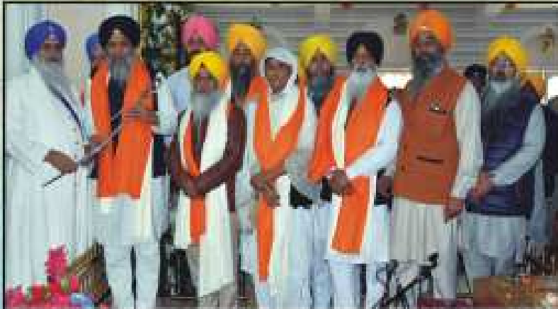
ਭਾਰਤ ਦੀ ਗੁਰੂ ਗੋਬਿੰਦ ਸਿੰਘ ਜੀ ਦੇ 300 ਵਾਂ ਪੂਰਾ ਪਿੰਗ ਦੇ ਸਮਾਪਤੀ ਸਮਾਗਮ 'ਤੇ ਭਾਰਤ ਦੀ ਕਮਿਊਨਿਸਟ ਪਾਰਟੀ ਦੁਆਰਾ ਸੰਗਠਿਤ ਇੱਕ ਸੰਗਠਿਤ ਪ੍ਰਦਰਸ਼ਨ, ਕ੍ਰੋਮੜੀ ਕਮੇਟੀ ਨੂੰ ਗੁਰੂ ਅਰਜਨ ਦੇਵ ਜੀ ਸਮਾਗਮ ਸੰਗਠਿਤ ਕਰਨ ਲਈ ਵੋਟਾਂ ਦੇਣ ਲਈ ਸਿੱਖ ਭਾਰਤ ਵਿਖਾਲੀ ਵਿਠਾਵਲ ਸਿੱਖ ਦੀ ਸੰਗਠਨ, ਭਾਰਤ ਦੀ ਪਾਰਟੀ ਸੰਗਠਿਤ। ਲਲ ਕਰ. ਡਾ: ਰੂਮ ਸਿੱਖ ਰੂਮ ਲਲਿਟ ਲਈ ਪਿੰਗ ਸੰਗਠਿਤ।