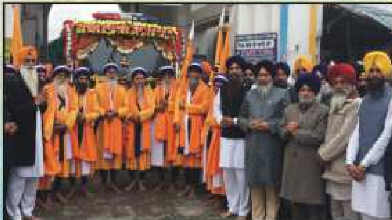
ਜਤਿਕ ਸ੍ਰੀ ਕ੍ਰਮ ਕੰਬਿੰਦ ਸਿੰਘ ਜੀ ਦੇ ਪੁਰਾਣ ਦਿੱਤਾ ਜਿਹੜੇ ਸਮਝਣ ਲਈ ਦੁਆਰਾ ਸ੍ਰੀ ਨਾਨਕਿਅਾਰਾ ਸਾਹਿਬ ਕੰਬਿੰਦ ਤੋਂ ਲਏ ਗਏ ਗਏ ਗਏ ਸਿੱਖਾਂ ਲਈ ਪੁਰਾਣ ਦਾ ਕਾਰਜ ਕਰਵਾਇਆ ਗਿਆ; ਪੁ: ਕਮੇਟੀ ਦੇ ਪੁਰਾਣ ਵਾਲੇ ਕੰਬਿੰਦ ਸਿੰਘ ਕੰਬਿੰਦ ਅਤੇ ਹੋਰ ਪ੍ਰਭੂ ਕਰਵਾਏ।