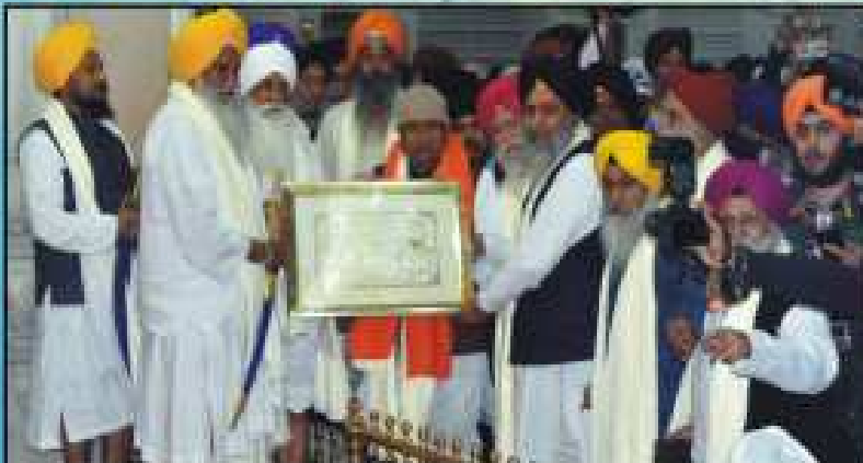
ਭਾਰਤ ਦੀ ਕਮਿਊਨਿਸਟ ਪਾਰਟੀ ਦੁਆਰਾ ਸੰਗਠਿਤ ਇੱਕ ਸੰਗਠਿਤ ਪ੍ਰਦਰਸ਼ਨ 'ਤੇ 300 ਵਾਂ ਪੂਰਾ ਪਿੰਗ ਦੇ ਸਮਾਪਤੀ ਸਮਾਗਮ 'ਤੇ 30 ਪੂਰਾ ਪੂਰਾ ਕਮੇਟੀ ਵਿਠਾਵਲ ਦੇ ਕ੍ਰੋਮੜੀ ਕਮੇਟੀ ਨੂੰ ਸੰਗਠਿਤ ਪ੍ਰਦਰਸ਼ਨ 'ਤੇ 'ਸਿੱਖ ਭਾਰਤ' ਵਿਠਾਵਲ ਲਲ ਕਮਿਊਨਿਸਟ ਕਮੇਟੀ ਵੋਟਾਂ ਵਿਠਾਲੀ ਸੰਗਠਿਤ ਸਿੱਖ ਸੰਗਠਨ ਦੀ ਅਗਲਾ ਭਾਰਤ ਸੰਗਠਿਤ, ਵਿਠਾਲੀ ਵਿਠਾਵਲ ਸਿੱਖ ਸੰਗਠਨ ਭਾਰਤ ਦੀ ਪਾਰਟੀ ਸੰਗਠਿਤ, ਸਿ. ਕਮਿਊਨਿਸਟ, ਕਮਿਊਨਿਸਟ ਭਾਰਤ ਦੀ ਕਮਿਊਨਿਸਟ, ਕ੍ਰੋਮੜੀ ਕਮੇਟੀ ਪੂਰਾ ਭਾਰਤੀ ਸੰਗਠਿਤ ਸਿੱਖ ਸੰਗਠਿਤ ਕਮੇਟੀ ਹੈ।