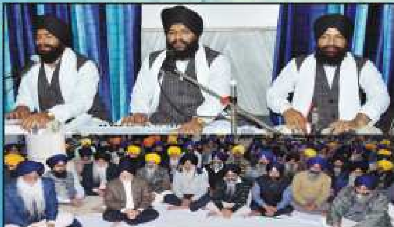
ਬੰਦੇ ਸਾਹਿਬਜ਼ਾਦਿਆਂ ਅਤੇ ਮਾਝਾ ਗੁਜਰੀ ਜੀ ਦੇ ਭਰੀਓਂ ਵਿਹਾਰੇ ਨੇਕੇ ਗੁਰਦੁਆਰਾ ਸ੍ਰੀ ਮੰਜੀ ਸਾਹਿਬ ਦੀਵਾਨ ਹਾਲ (ਅੰਮ੍ਰਿਤਸਰ) ਵਿਖੇ ਯਕਰਾਏ ਛੇ ਫੁਰਕਮਰਿ ਸਮਾਗਮ ਸਮੇਂ ਭਾਰੀ ਸਫੀਲ ਸਿੰਘ ਚਾ ਰਾਗੀ ਜਥਾ ਦੀਗਰਨ ਧਰਦਾ ਹੋਇਆ ਅਤੇ ਹਾਲ ਸੰਗਰਾ।