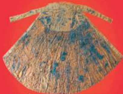
चोला श्री गुरू गोबिन्द सिंह जी

श्री गुरू गोबिन्द सिंह जी के पुरातन शस्त्र एवं हाथी दांत की खडाव और श्री गुरू तेग बहादर जी की चंदन की खडाव