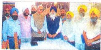
ਮੁੱਖ ਮੰਤਰੀ ਨੂੰ ਮਿਲਣ ਤੋਂ ਪਹਿਲਾਂ ਜੰਮੂ-ਕਸ਼ਮੀਰ ਦੇ ਗਵਰਨਰ ਨਰਿੰਦਰ ਨਾਥ ਵੇਹਰਾ ਨਾਲ ਮੁਲਾਕਾਤ ਕਰਨ ਸਮੇਂ ਜਥੇਦਾਰ ਅਵਤਾਰ ਸਿੰਘ ਮੱਕੜ ਤੋਂ ਹੋਰ।

ਆਦਿ ਦੀ ਮੰਗ ਕੀਤੀ। ਸ਼੍ਰੋਮਣੀ ਕਮੇਟੀ ਵੱਲੋਂ ਸ਼੍ਰੀਨਗਰ ਵਿਖੇ ਰਾਹਤ ਕਾਰਜਾਂ ਲਈ ਭੇਜੀ ਜਾ ਰਹੀ ਸਮੱਗਰੀ ਦੀ ਵਿਸਥਾਰਪੂਰਵਕ ਜਾਣਕਾਰੀ ਦਿੰਦਿਆਂ ਜਥੇਦਾਰ ਮੱਕੜ ਨੇ ਕਿਹਾ ਕਿ ਸ਼੍ਰੋਮਣੀ ਕਮੇਟੀ ਉਸ ਸਮੇਂ ਤਕ ਰਾਹਤ ਕਾਰਜ ਸਾਗੀ ਰੱਖੇਗੀ ਜਦੋਂ ਤਕ ਸ਼੍ਰੀਨਗਰ ਵਿਖੇ ਹਜ਼ੂਰਾਂ ਤੋਂ ਪ੍ਰਭਾਵਿਤ ਪਰਿਵਾਰਾਂ ਦੀ ਹਾਲਤ ਸਥਿਰ ਨਹੀਂ ਹੋ ਜਾਂਦੀ ਤੇ ਇਹ ਆਪਣੇ ਘਰਾਂ ਵਿਚ ਚੰਗੀ ਤਰ੍ਹਾਂ ਵਸ ਨਹੀਂ ਜਾਂਦੇ। ਜਥੇਦਾਰ ਮੱਕੜ ਨੇ ਮੁੱਖ ਮੰਤਰੀ ਨੂੰ ਅਪੀਲ ਕਰਦਿਆਂ ਕਿਹਾ ਕਿ ਹਜ਼ੂਰਾਂ ਤੋਂ ਬੁਰੀ ਤਰ੍ਹਾਂ ਪ੍ਰਭਾਵਿਤ ਹੋਏ ਸਿੱਖ ਪਰਿਵਾਰਾਂ ਲਈ ਵਿਸ਼ੇਸ਼ ਪੈਕੇਜ ਜਲਦ ਤੋਂ ਜਲਦ ਜਾਰੀ ਕਰਕੇ ਉਨ੍ਹਾਂ ਦੇ ਮੁੜ-ਵਸੇਬੇ ਲਈ ਯਤਨ ਕਰਨ 'ਤੇ ਉਨ੍ਹਾਂ ਦੇ ਹੋਏ ਨੁਕਸਾਨ ਦੀ ਭਰਪਾਈ ਕੀਤੀ ਜਾਵੇ। ਮੱਕੜ ਨੇ ਸਿੱਖਾਂ ਲਈ ਵਿਸ਼ੇਸ਼ ਫੈਬਰੀਕੇਟਿਡ ਘਰਾਂ ਵਾਲੀ ਵੱਖਰੀ ਕਲੋਨੀ ਦੀ ਮੰਗ ਵੀ ਕੀਤੀ, ਜਿਸ 'ਤੇ ਉਮਰ ਅਬਦੁੱਲਾ ਨੇ ਵਿੱਤੀ ਤੌਰ ਹਰ ਤਰ੍ਹਾਂ ਦੀ ਮਦਦ ਕਰਨ ਲਈ ਪੂਰਾ ਯਕੀਨ ਦਿਵਾਇਆ। ਇਸ ਮੌਕੇ ਮੁੱਖ ਮੰਤਰੀ ਨੂੰ ਜਥੇਦਾਰ ਮੱਕੜ ਨੇ ਰਾਹਤ ਸਮੱਗਰੀ ਵੰਡਣ ਮੌਕੇ ਸ਼੍ਰੋਮਣੀ ਕਮੇਟੀ ਨੂੰ ਆ ਰਹੀਆਂ ਮੁਸ਼ਕਲਾਂ ਤੇ ਕਸ਼ਮੀਰੀ ਸਿੱਖਾਂ ਦੇ ਮੁੜ-ਵਸੇਬੇ ਲਈ ਯਾਦ ਪੱਤਰ ਦਿੱਤਾ। ਮੱਕੜ ਨੇ ਜੰਮੂ-ਕਸ਼ਮੀਰ ਦੇ ਗਵਰਨਰ ਨਰਿੰਦਰ ਨਾਥ ਵੇਹਰਾ ਨਾਲ ਮੁਲਾਕਾਤ ਕੀਤੀ।