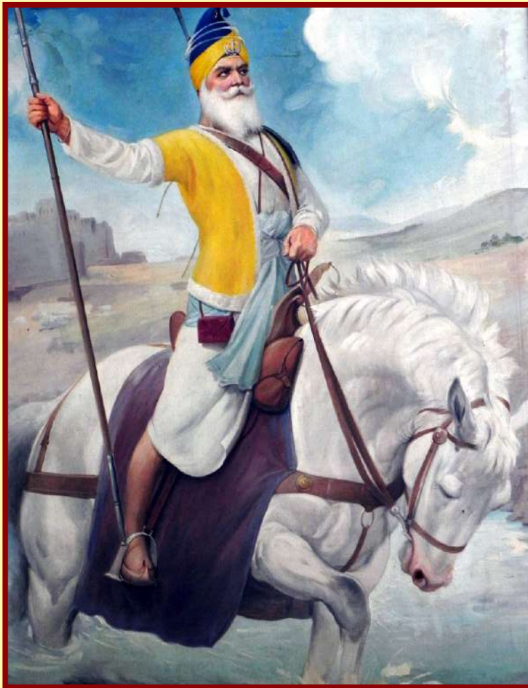
ਅਕਾਲੀ ਫੂਲਾ ਸਿੰਘ ਜੀ