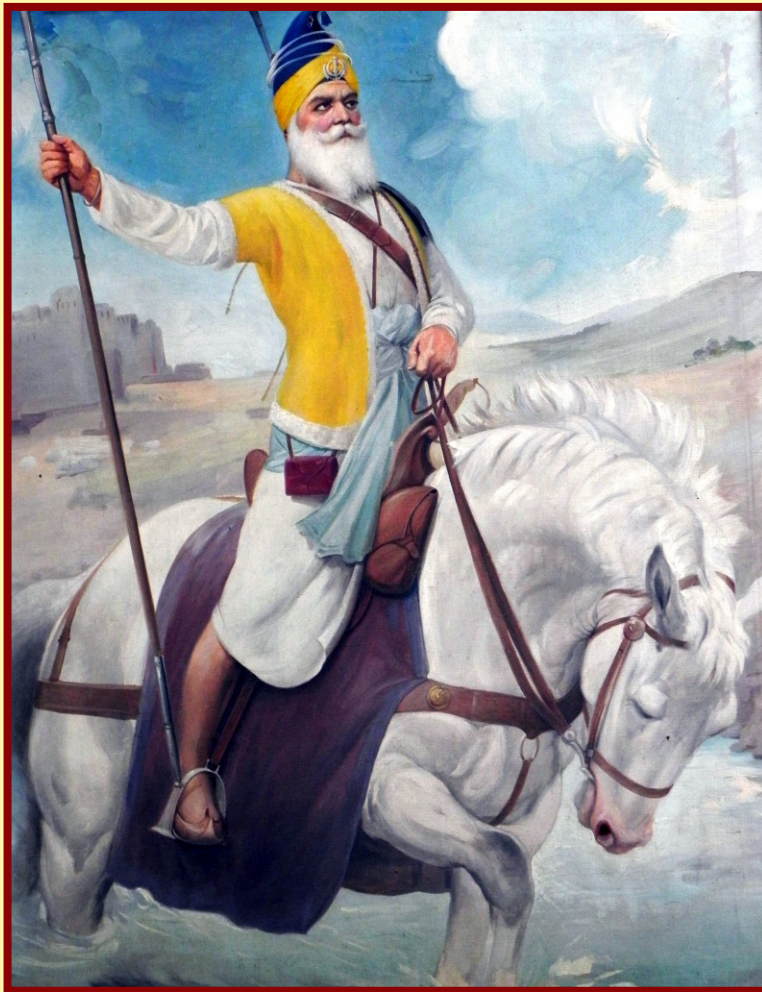
ਅਕਾਲੀ ਫੂਲਾ ਸਿੰਘ ਜੀ