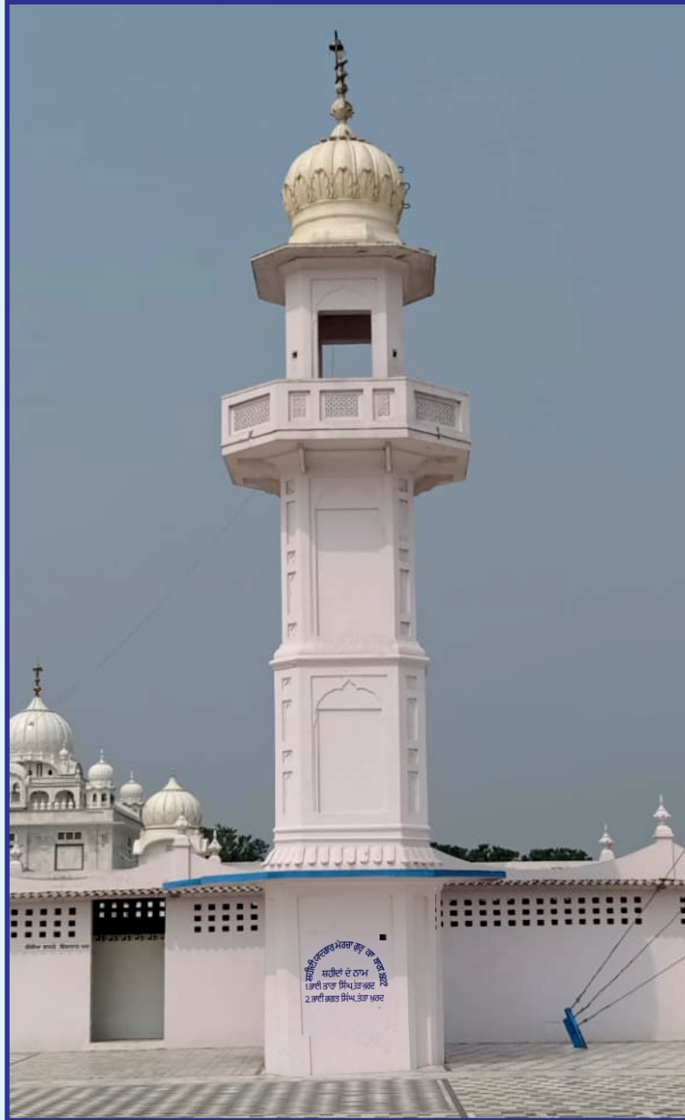
ਸ਼ਹੀਦੀ ਯਾਦਗਾਰ ਮੋਰਚਾ ਗੁਰੂ ਕਾ ਬਾਗ