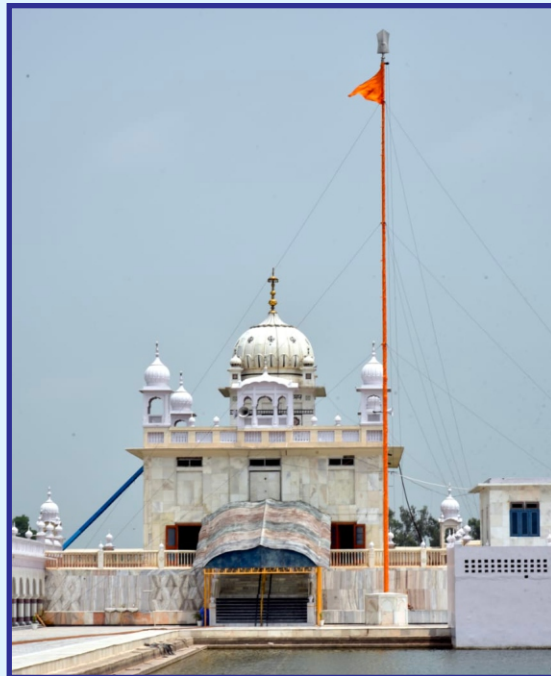
ਗੁਰਦੁਆਰਾ ਸਾਹਿਬ ਗੁਰੂ ਕਾ ਬਾਗ ਪਾਤਸ਼ਾਹੀ ਨੌਵੀਂ