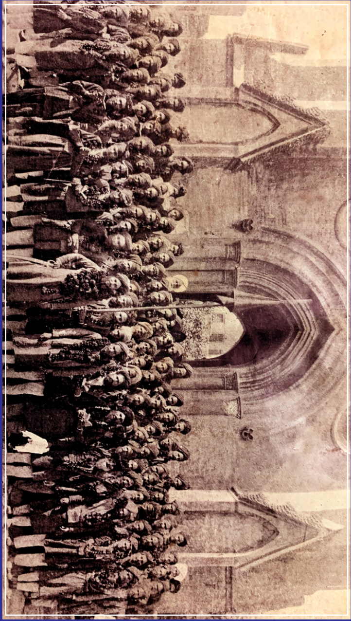
ਸ੍ਰੀ ਦਰਬਾਰ ਸਾਹਿਬ, ਸ੍ਰੀ ਅੰਮ੍ਰਿਤਸਰ ਤੋਂ ਜਥਾ ਮੋਰਚਾ ਗੁਰੂ ਕਾ ਬਾਗ ਲਈ ਰਵਾਨਾ ਹੋਣ ਸਮੇਂ