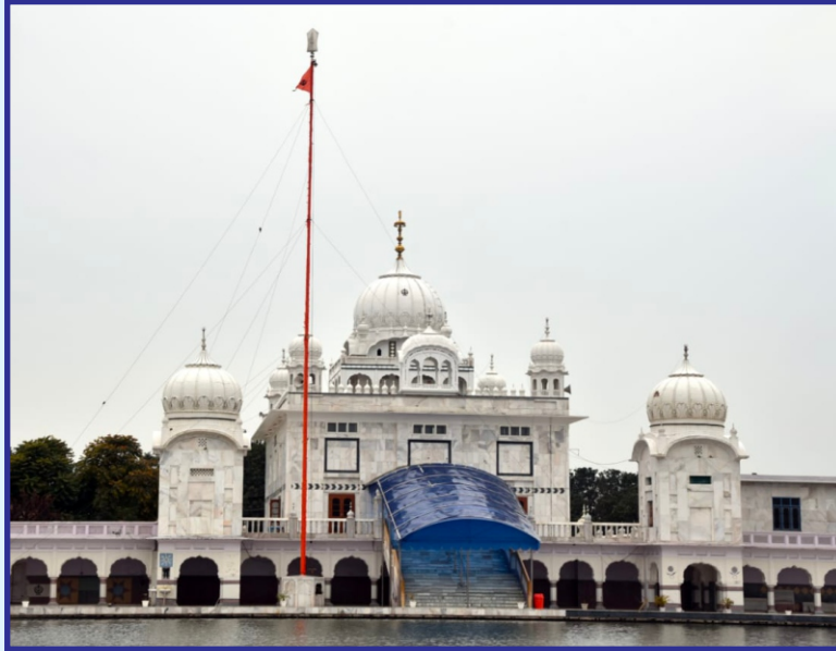
ਗੁਰਦੁਆਰਾ ਸਾਹਿਬ ਗੁਰੂ ਕਾ ਬਾਗ ਪਾਤਸ਼ਾਹੀ ਪੰਜਵੀਂ