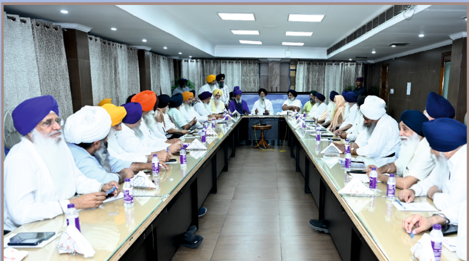
ਸ਼੍ਰੋਮਣੀ ਕਮੇਟੀ ਦਫਤਰ ਵਿਖੇ 350 ਸਾਲਾ ਸ਼ਹੀਦੀ ਸ਼ਤਾਬਦੀ ਦੇ ਸਮਾਗਮਾਂ ਸਬੰਧੀ ਸ਼੍ਰੋਮਣੀ ਕਮੇਟੀ ਵੱਲੋਂ ਬਣਾਈ ਗਈ ਉੱਚ ਪੱਧਰੀ ਤਾਲਮੇਲ ਕਮੇਟੀ ਦੀ ਬੈਠਕ ਵਿਚ ਸ਼ਾਮਲ ਪ੍ਰਧਾਨ ਐਡਵੋਕੇਟ ਸ. ਹਰਜਿੰਦਰ ਸਿੰਘ ਧਾਮੀ, ਸ਼੍ਰੋਮਣੀ ਅਕਾਲੀ ਦੇ ਪ੍ਰਧਾਨ ਸ. ਸੁਖਬੀਰ ਸਿੰਘ ਬਾਦਲ, ਸ਼੍ਰੋਮਣੀ ਕਮੇਟੀ ਦੇ ਮੈਂਬਰਾਨ ਤੇ ਅਧਿਕਾਰੀ ਅਤੇ ਵੱਖ-ਵੱਖ ਸੰਸਥਾਵਾਂ ਦੇ ਨੁਮਾਇੰਦੇ। (14 ਜੁਲਾਈ)