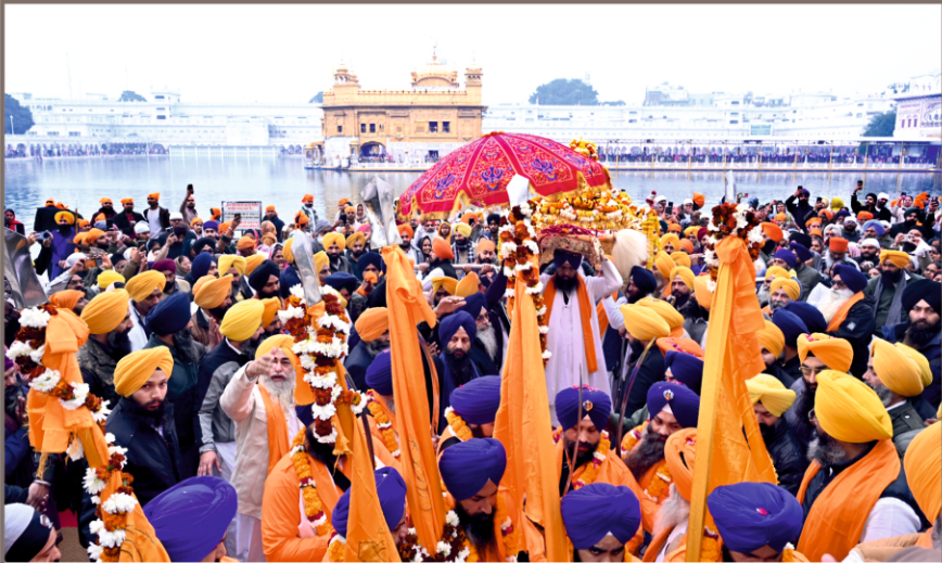
ਸ਼ਹੀਦ ਬਾਬਾ ਦੀਪ ਸਿੰਘ ਜੀ ਦੇ ਜਨਮ ਦਿਹਾਤੇ ਮੌਕੇ ਸ੍ਰੀ ਅਕਾਲ ਤਖ਼ਤ ਸਾਹਿਬ ਤੋਂ ਸਜਾਏ ਗਏ ਨਗਰ ਕੀਰਤਨ ਦਾ ਮਨਮੋਹਕ ਦ੍ਰਿਸ਼। (26 ਜਨਵਰੀ)