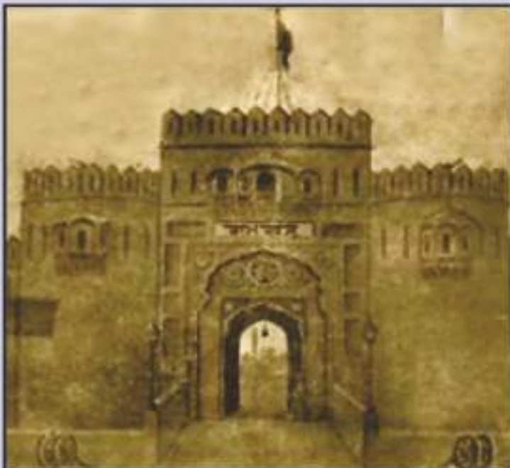
ਅਲੋਪ ਹੋ ਚੁੱਕਾ ਪੁਰਾਤਨ ਕਿਲ੍ਹਾ ਰਾਮਗੜ੍ਹ, ਸ੍ਰੀ ਅੰਮ੍ਰਿਤਸਰ ਸਾਹਿਬ