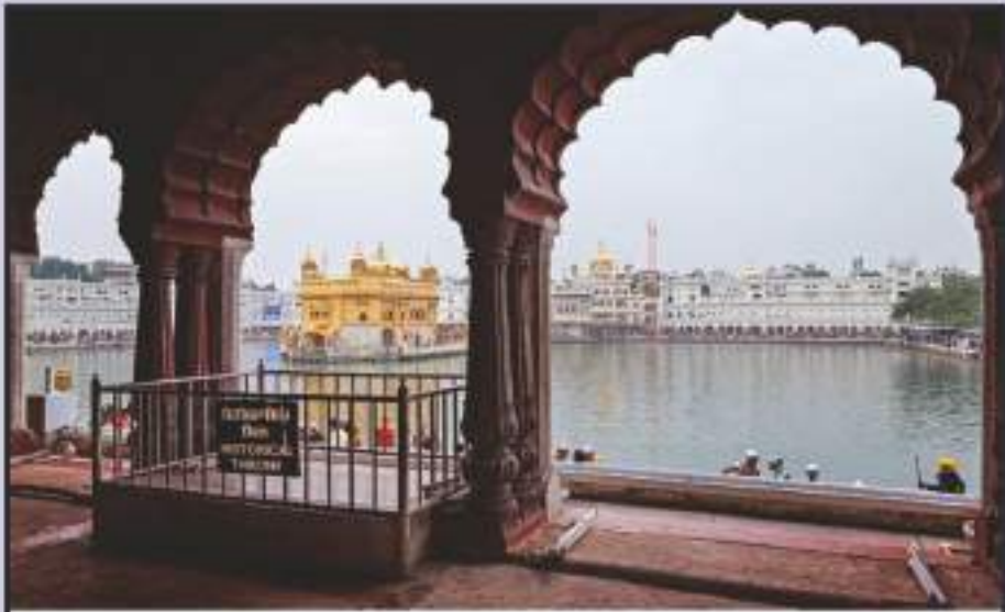
ਬੁੰਗਾ ਰਾਮਗੜੀਆ ਵਿਚ ਪਈ ਮੁਗਲਾਂ ਦੇ ਦਿੱਲੀ ਤਖ਼ਤ ਤੋਂ ਲਿਆਂਦੀ ਪੱਥਰ ਦੀ ਸਿਲ