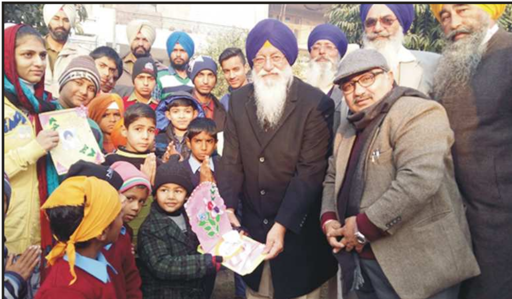
ਭਾਈ ਨਿਗਾਹੀਆ ਜੀ ਖਾਲਸਾ ਪਬਲਿਕ ਸਕੂਲ ਫਾਰ ਡੈੱਫ ਦੇ ਬੱਚਿਆਂ ਨੂੰ ਮਿਲਾਏ ਹੋਏ ਸ਼੍ਰੋਮਣੀ ਕਮੇਟੀ ਦੇ ਪ੍ਰਧਾਨ ਜਥੇਦਾਰ ਅਵ ਤਾਰ ਸਿੰਘ ਅਤੇ ਹੋਰ।