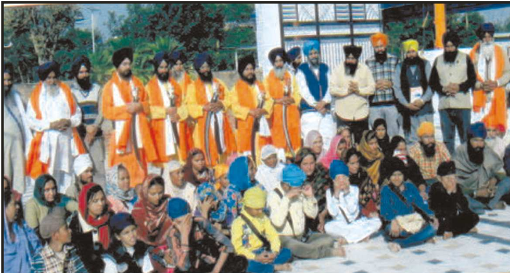
ਗੁਰਦੁਆਰਾ ਗੁਰੂਸਰ ਸਤਲਾਣੀ ਸਾਹਿਬ, ਅੰਮ੍ਰਿਤਸਰ ਵਿਖੇ ਕਰਵਾਏ ਗਏ ਅੰਮ੍ਰਿਤ ਸੰਚਾਰ ਸਮੇਂ ਅੰਮ੍ਰਿਤ ਅਭਿਲਾਖੀ ਸੰਗਤਾਂ ਨਾਲ ਪੰਜ ਪਿਆਰੇ ਸਾਹਿਬਾਨ।