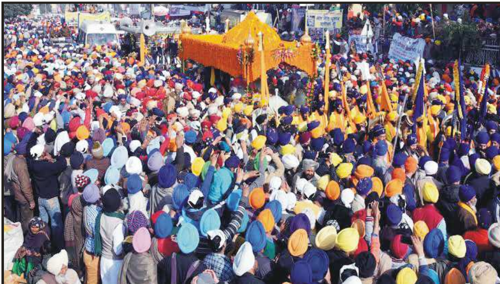
ਛੋਟੇ ਸਾਹਿਬਜ਼ਾਦਿਆਂ ਅਤੇ ਮਾਤਾ ਗੁਜਰੀ ਜੀ ਦੇ ਸ਼ਹੀਦੀ ਦਿਹਾੜੇ ਨੂੰ ਸਮਰਪਿਤ ਗੁਰਦੁਆਰਾ ਸ੍ਰੀ ਫ਼ਤਹਿਗੜ੍ਹ ਸਾਹਿਬ ਤੋਂ ਗੁਰਦੁਆਰਾ ਸ੍ਰੀ ਜੋਤੀ ਸਰੂਪ ਤਕ ਸਜਾਏ ਗਏ ਨਗਰ ਕੀਰਤਨ ਦਾ ਅਲੌਕਿਕ ਦ੍ਰਿਸ਼। (28 ਦਸੰਬਰ 2015)