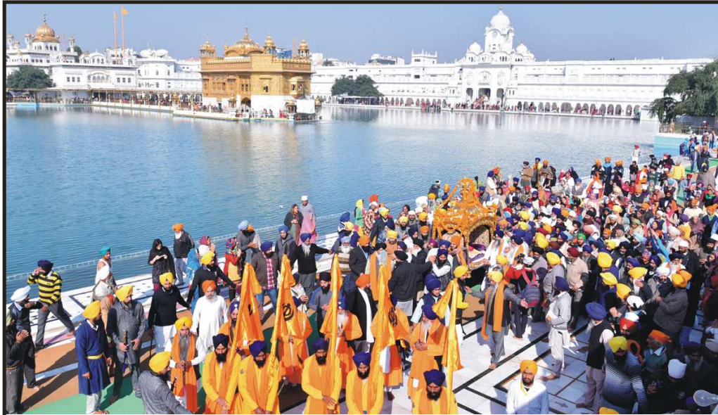
ਨੌਵੇਂ ਪਾਤਸ਼ਾਹ ਸ੍ਰੀ ਗੁਰੂ ਤੇਗ ਬਹਾਦਰ ਸਾਹਿਬ ਜੀ ਦੇ ਸ਼ਹੀਦੀ ਦਿਹਾੜੇ ਨੂੰ ਸਮਰਪਿਤ ਸ੍ਰੀ ਅਕਾਲ ਤਖ਼ਤ ਸਾਹਿਬ ਤੋਂ ਆਯੋਜਿਤ ਸ੍ਰੀ ਗੁਰੂ ਗ੍ਰੰਥ ਸਾਹਿਬ ਜੀ ਦੀ ਛਤਰ-ਛਾਇਆ ਅਤੇ ਪੰਜ ਪਿਆਰਿਆਂ ਦੀ ਅਗਵਾਈ 'ਚ ਅਲੌਕਿਕ ਨਗਰ ਕੀਰਤਨ ਦਾ ਦ੍ਰਿਸ਼।