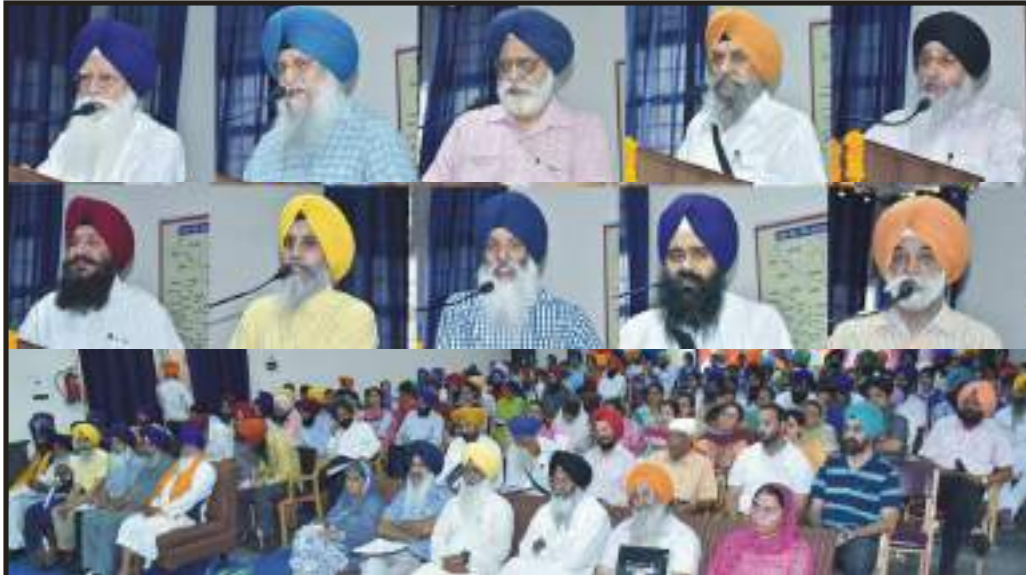
ਸਰਹਿੰਦ ਫ਼ਤਹਿ ਵਿਵਸ ਨੂੰ ਸਮਰਪਿਤ ਮਾਤਾ ਗੁਜਰੀ ਕਾਲਜ ਸ੍ਰੀ ਫ਼ਤਹਿਗੜ੍ਹ ਸਾਹਿਬ ਵਿਖੇ ਕਰਵਾਏ ਗਏ ਸੈਮੀਨਾਰ ਵਿਚ ਸੰਬੰਧਨ ਕਰਦੀਆਂ ਹੋਈਆਂ ਪ੍ਰਮੁੱਖ ਸ਼ਖ਼ਸੀਅਤਾਂ ਅਤੇ ਸਿੱਖ ਵਿਦਵਾਨ। ਹੋਠਾਂ: ਹਾਜ਼ਰ ਸਰੋਤੋਂ।