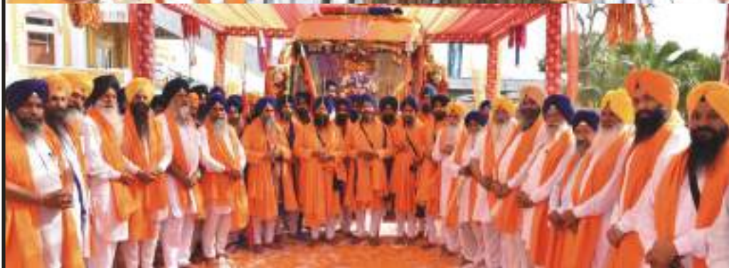
ਬਾਬਾ ਬੰਦਾ ਸਿੰਘ ਬਹਾਦਰ ਤੇ ਹੋਰ ਸਿੰਘਾਂ ਦੇ 300 ਸਾਲਾ ਸ਼ਹੀਦੀ ਦਿਹਾੜੇ ਨੂੰ ਸਮਰਪਿਤ ਨਗਰ ਕੀਰਤਨ ਵੱਖ-ਵੱਖ ਪੜਾਵਾਂ ਤੋਂ ਰਵਾਨਾ ਹੋਣ ਸਮੇਂ ਪੰਜ ਪਿਆਰੇ ਸਾਹਿਬਾਨ ਨਾਲ ਪ੍ਰਮੁੱਖ ਸ਼ਖਸੀਅਤਾਂ ਅਤੇ ਸੰਗਤਾਂ।