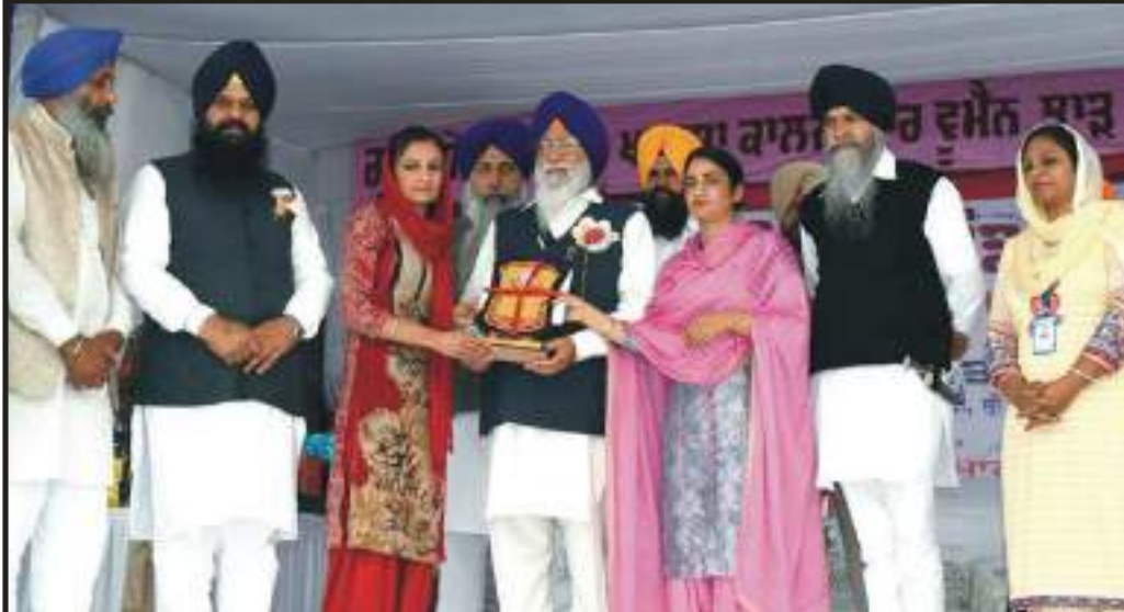
ਗੁਰੂ ਗੋਬਿੰਦ ਸਿੰਘ ਖਾਲਸਾ ਕਾਲਜ (ਲੜਕੀਆਂ), ਝਾੜ ਸਾਹਿਬ (ਲੁਧਿਆਣਾ) ਵਿਖੇ ਸਾਲਾਨਾ ਇਨਾਮ ਵੰਡ ਸਮਾਗਮ ਦੌਰਾਨ ਵਿਦਿਆਰਥਣਾਂ ਨੂੰ ਸਨਮਾਨਿਤ ਕਰਦੇ ਹੋਏ ਜਥੇਦਾਰ ਅਵਤਾਰ ਸਿੰਘ ਪ੍ਰਧਾਨ ਸ਼੍ਰੋਮਣੀ ਕਮੇਟੀ ਅਤੇ ਹੋਰ ਪ੍ਰਮੁੱਖ ਸ਼ਖਸੀਅਤਾਂ।