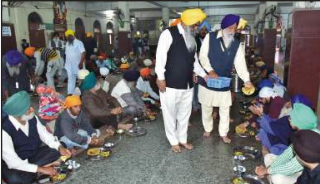
ਸ੍ਰੀ ਗੁਰੂ ਰਾਮਦਾਸ ਲੰਗਰ ਵਿਚ ਪ੍ਰਸ਼ਾਦੇ ਵਰਤਾਉਣ ਦੀ ਸੇਵਾ ਕਰਦੇ ਹੋਏ ਜਥੇਦਾਰ ਅਵਤਾਰ ਸਿੰਘ ਪ੍ਰਧਾਨ ਸ਼੍ਰੋਮਣੀ ਕਮੇਟੀ।