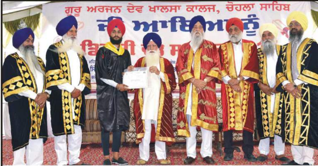
ਗੁਰੂ ਅਰਜਨ ਦੇਵ ਖਾਲਸਾ ਕਾਲਜ, ਚੋਹਲਾ ਸਾਹਿਬ ਵਿਖੇ ਕਰਵਾਏ ਗਏ 'ਡਿਗਰੀ ਵੰਡ ਸਮਾਰੋਹ' ਸਮੇਂ ਪ੍ਰੋ. ਕਿਰਪਾਲ ਸਿੰਘ ਬਡੂੰਗਰ ਪ੍ਰਧਾਨ ਸ਼੍ਰੋਮਣੀ ਕਮੇਟੀ, ਮੈਂਬਰ ਪਾਰਲੀਮੈਂਟ ਜਥੇਦਾਰ ਰਣਜੀਤ ਸਿੰਘ ਬ੍ਰਹਮਪੁਰਾ ਵਿਦਿਆਰਥੀਆਂ ਨੂੰ ਡਿਗਰੀਆਂ ਪ੍ਰਦਾਨ ਕਰਦੇ ਹੋਏ।