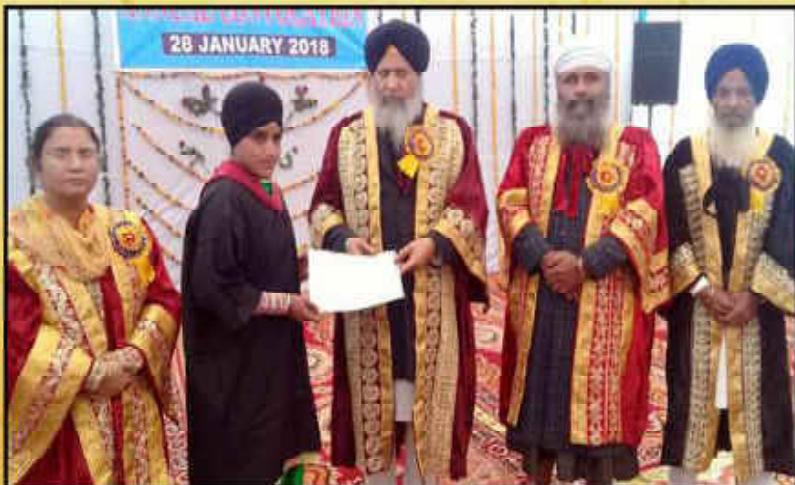
ਗੁਰੂ ਗੋਬਿੰਦ ਸਿੰਘ ਕਾਲਜ ਸਰਹਾਲੀ (ਡਰਨ ਡਾਰਨ) ਵਿਖੇ ਕਨਵੈਨਸ਼ਨ ਮੌਕੇ ਵਿਦਿਆਰਥੀਆਂ ਨੂੰ ਡਿਗਰੀਆਂ ਵੰਡਦੇ ਹੋਏ ਸ਼੍ਰੋਮਣੀ ਗੁਰਦੁਆਰਾ ਪ੍ਰਬੰਧਕ ਕਮੇਟੀ ਦੇ ਪ੍ਰਧਾਨ ਭਾਈ ਗੋਬਿੰਦ ਸਿੰਘ ਲੌਂਗੋਵਾਲ ਤੋਂ ਹੋਰ।