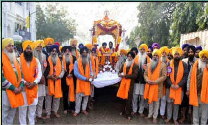
ਬਹੀਦ ਬਾਬਾ ਦੀਪ ਸਿੰਘ ਜੀ ਦੇ ਜਨਮ ਦਿਹਾੜੇ ਮੌਕੇ ਸ੍ਰੀ ਅਕਾਲ ਤਖਤ ਸਾਹਿਬ ਤੋਂ ਸਜਾਏ ਗਏ ਨਗਰ ਕੀਰਤਨ 'ਚ ਸ਼ਾਲ ਸ਼੍ਰੋਮਣੀ ਕਮੇਟੀ ਦੇ ਮੈਂਬਰ ਸਾਹਿਬਾਨ, ਅਧਿਕਾਰੀ ਅਤੇ ਸੰਗਤ।