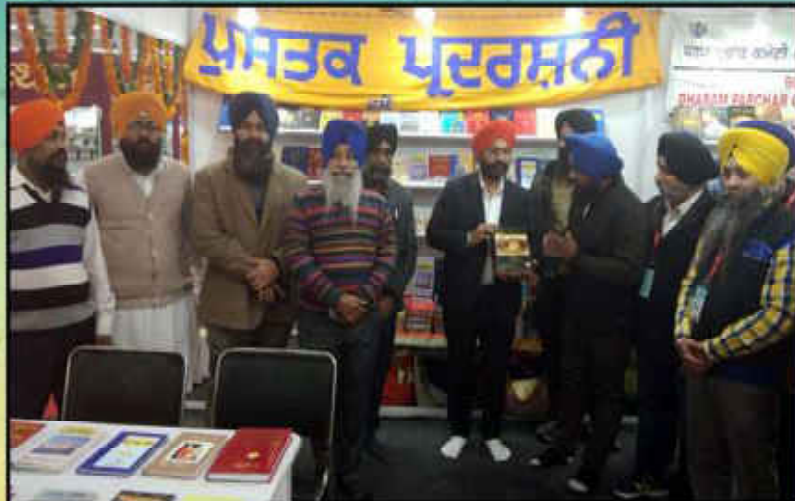
ਦਿੱਲੀ ਦੇ ਪ੍ਰਗਤੀ ਮੈਦਾਨ ਵਿਚ ਲਗਾਏ ਛਾਏ ਪੁਸਤਕ ਮੇਲੇ ਸਮੇਂ ਸ਼੍ਰੋਮਣੀ ਗੁ: ਪ੍ਰ: ਕਮੇਟੀ ਵੱਲੋਂ ਲਗਾਈ ਗਈ ਪੁਸਤਕ ਪ੍ਰਦਰਸ਼ਨੀ ਦਾ ਇਕ ਦ੍ਰਿਸ਼।