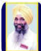
ਇਕਾਮੀਟ ਨੀਯਮ ਕੇਦੀ

ਹੁਣ ਜਦੋਂ ਅਸੀਂ 21ਵੀਂ ਸਦੀ ਦੇ ਦੂਜੇ ਦਹਾਕੇ ਦੇ ਅੰਤ ਵੱਲ ਜਾ ਰਹੇ ਹਾਂ ਤਾਂ ਦੇ ਚੀਜ਼ਾਂ ਸਪੱਸ਼ਟ ਰੂਪ ਵਿੱਚ ਉਜਾਗਰ ਹੋਈਆਂ ਹਨ ਕਿ ਪ੍ਰਚਾਰ ਦੀ ਗ੍ਰਿਫਤ ਵਿੱਚ ਹੈ। ਜਿਸ ਤਰ੍ਹਾਂ ਵਿਸ਼ਵ ਇੱਛਾ ਤੇ ਚੋਣ ਅਨੁਸਾਰ ਬੈਠੇ ਵੇਖ ਸਕਦੇ ਸੂਚਨਾ ਦਾ ਪ੍ਰਸਾਰਨ ਇੰਨੀ ਤੇਜ਼ ਗਤੀ ਕਈ ਵਾਰ ਅਨੁਮਾਨ ਲਗਾਉਣਾ ਵਿਗਿਆਨ, ਮਸ਼ੀਨ ਤੇ ਸੰਚਾਰ ਦੇ ਪ੍ਰਭਾਵ ਪ੍ਰਚਾਰ ਦੀਆਂ ਤਕਨੀਕੀ ਜੁਗਤਾਂ ਦੇ ਹੈ।