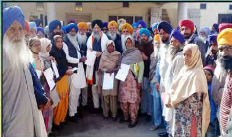
ਗੁਰਦੁਆਰਾ ਸਾਹਿਬ ਕੇਂਬੇਵਾਲ (ਲੋਂਗੋਵਾਲ) ਵਿਖੇ ਕੇਂਸਰ ਪੀੜਤਾਂ ਨੂੰ ਸ਼੍ਰੋਮਣੀ ਗੁ: ਪ੍ਰ: ਕਮੇਟੀ ਵੱਲੋਂ ਸਹਾਇਤਾ ਵਜੋਂ ਚੈੱਕ ਤਕਸੀਮ ਕਰਦੇ ਹੋਏ ਸ਼੍ਰੋਮਣੀ ਕਮੇਟੀ ਪ੍ਰਧਾਨ ਭਾਈ ਗੋਬਿੰਦ ਸਿੰਘ ਲੋਂਗੋਵਾਲ।