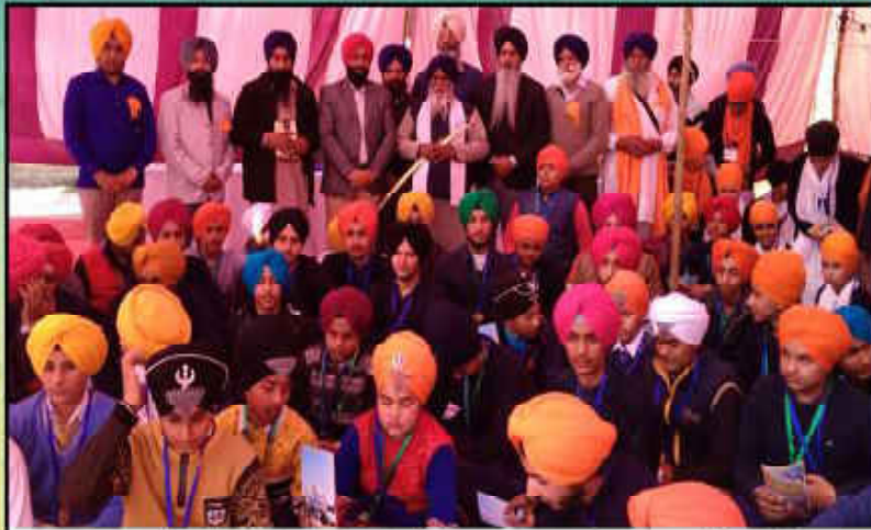
ਧਰਮ ਪ੍ਰਚਾਰ ਕਮੇਟੀ ਵੱਲੋਂ ਆਰੰਭੀ ਗਈ ਪ੍ਰਚਾਰ ਲਹਿਰ ਤਹਿਤ ਗੁਰਦੁਆਰਾ ਝੁਲਨਾ ਸਾਹਿਬ ਗੁਰਦੁਆਰਾ ਵਿਖੇ ਖਰਵਾਏ ਗਏ ਸੁੰਦਰ ਚਸ਼ਮਾ ਅਤੇ ਚਮਕਾ ਸ਼ਗਉਣ ਦੇ ਮੁਕਾਬਲੇ ਵਿੱਚ ਵਾਗ ਡੈਂਸ ਸਮੇਂ ਵਿਹਿਆਜ਼ੀ ਅਤੇ ਪ੍ਰਬੰਧਕ।