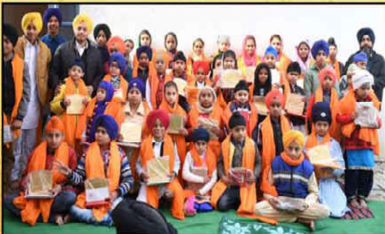
ਸ਼੍ਰੋਮਣੀ ਕਮੇਟੀ ਮੁਕਾਬਲਾ ਵੱਲੋਂ ਉਘਾਟਣ ਸ੍ਰੀ ਚਰਨਗ ਸਾਹਿਬ ਅਕਾਸ਼ੀ ਗਾਏਨੀ ਸੁਭਰਾਨਵਿੰਡ ਕੇਂਦਰ ਵਿਖੇ ਚਸ਼ਮੇ ਪਿਠਾ ਸੀ ਦੇ ਪ੍ਰਕਾਸ਼ ਪੁਰਸ਼ ਨੂੰ ਸਮਰਪਿਤ ਕਰਵਾਏ ਗਏ ਗੁਰਮਤਿ ਸਮਾਗਮ ਸਮੇਂ ਬੱਚਿਆਂ ਨੂੰ ਸਨਮਾਨਿਤ ਕੀਤੇ ਜਾਣ ਦਾ ਦ੍ਰਿਸ਼।