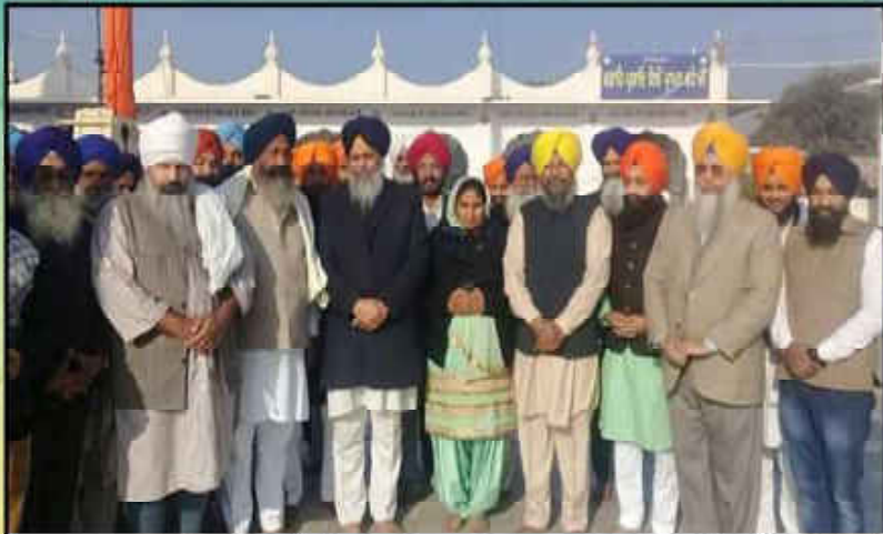
ਗੁਰਦੁਆਰਾ ਸਾਹਿਬ ਪਾੜਸ਼ਾਹੀ ਪਹਿਲੀ ਅਤੇ ਦਸਵੀਂ ਕਪਾਲ ਮੰਦਰ (ਯਮੁਨਾਨਗਰ) ਹਰਿਆਣਾ ਵਿਖੇ ਪਹੁੰਚਣ ਸਮੇਂ ਸ਼੍ਰੋਮਣੀ ਕ੍ਰਮ: ਪ੍ਰ: ਕਮੇਟੀ ਦੇ ਪ੍ਰਧਾਨ ਭਾਈ ਗੋਬਿੰਦ ਸਿੰਘ ਲੌਂਗੋਵਾਲ ਨਾਲ ਸ਼੍ਰੋਮਣੀ ਕਮੇਟੀ ਮੈਂਬਰ ਅਤੇ ਪ੍ਰਮੁੱਖ ਸ਼ਖਸੀਅਤਾਂ।