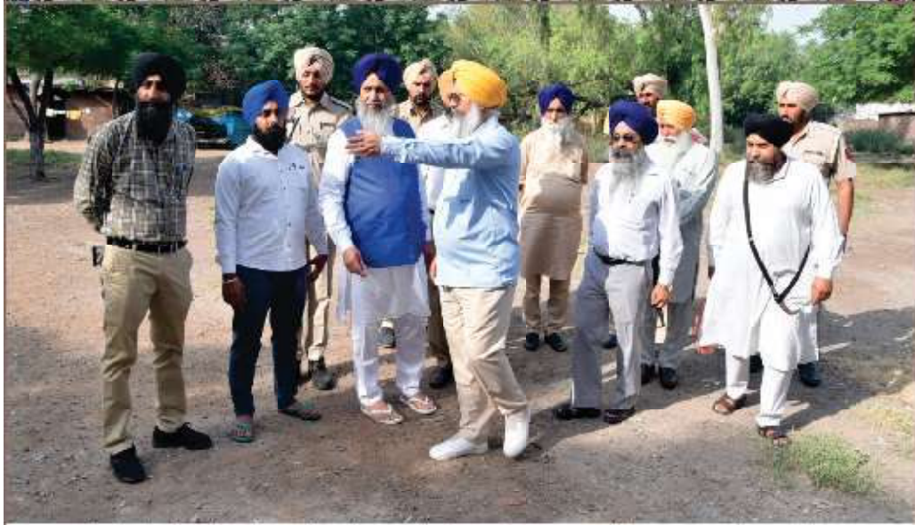
ਸੱਚਖੰਡ ਸ੍ਰੀ ਹਰਿਮੰਦਰ ਜਾਹਿਬ ਵਿਖੇ ਪੁੱਜਦੀਆਂ ਸੰਗਤਾਂ ਦੀ ਰਿਹਾਇਸ਼ ਲਈ ਸਰਾ ਬਣਾਉਣ ਸਬੰਧੀ ਸਥਾਨਕ ਅਕਾਲੀ ਬਾਗ ਵਾਲੀ ਥਾਂ ਦਾ ਜੋਕਾ ਦੇਖਦੇ ਹੋਏ ਸ਼੍ਰੋਮਣੀ ਕਮੇਟੀ ਪ੍ਰਧਾਨ ਭਾਈ ਗੋਬਿੰਦ ਸਿੰਘ ਲੌਂਗੋਵਾਲ ਅਤੇ ਸ਼੍ਰੋਮਣੀ ਕਮੇਟੀ ਦੇ ਅਧਿਕਾਰੀ। (15 ਅਪ੍ਰੈਲ)