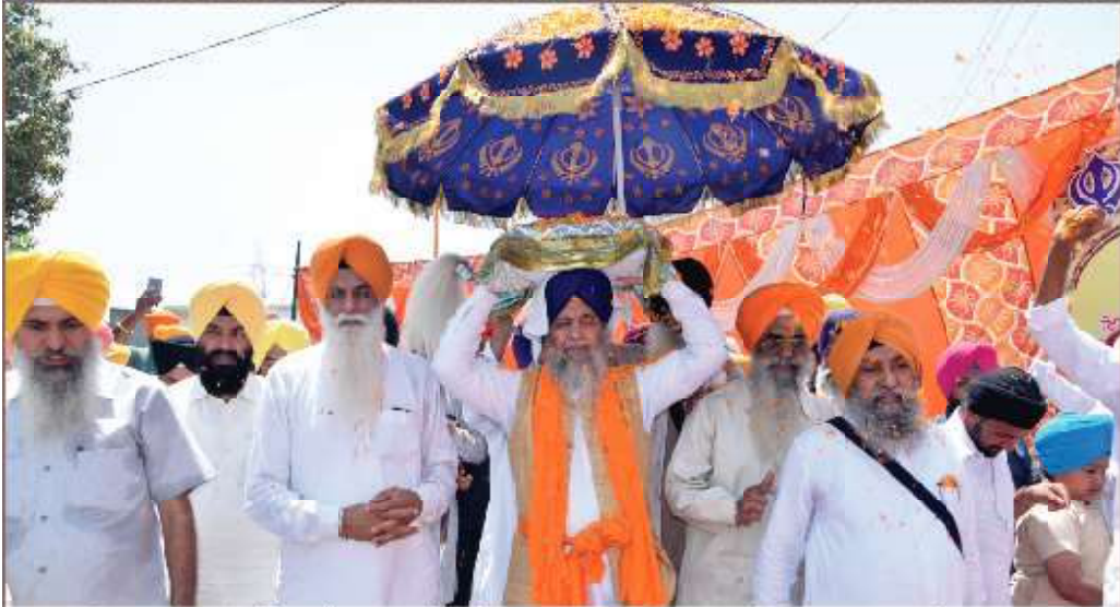
ਫਤਹਿਗੜ੍ਹ ਸਾਹਿਬ ਦੇ ਪਿੰਡ ਦਾਲੋਮਾਜਰਾ ਵਿਖੇ ਦੋ ਗੁਰਦੁਆਰਾ ਸਾਹਿਬਾਨ ਤੋਂ ਇੱਕ ਗੁਰਦੁਆਰਾ ਸਾਹਿਬ ਕਰਨ ਸਮੇਂ ਸ਼੍ਰੋਮਣੀ ਕਮੇਟੀ ਪ੍ਰਧਾਨ ਭਾਈ ਗੋਬਿੰਦ ਸਿੰਘ ਲੌਂਗੋਵਾਲ ਇੱਕ ਗੁਰਦੁਆਰਾ ਸਾਹਿਬ ਤੋਂ ਦੂਸਰੇ ਗੁਰਦੁਆਰਾ ਸਾਹਿਬ ਲਈ ਸ੍ਰੀ ਗੁਰੂ ਗ੍ਰੰਥ ਸਾਹਿਬ ਜੀ ਦਾ ਪਾਵਨ ਸਰੂਪ ਅਦਬ ਨਾਲ ਲੈ ਕੇ ਜਾਂਦੇ ਹੋਏ। (30 ਅਪ੍ਰੈਲ)