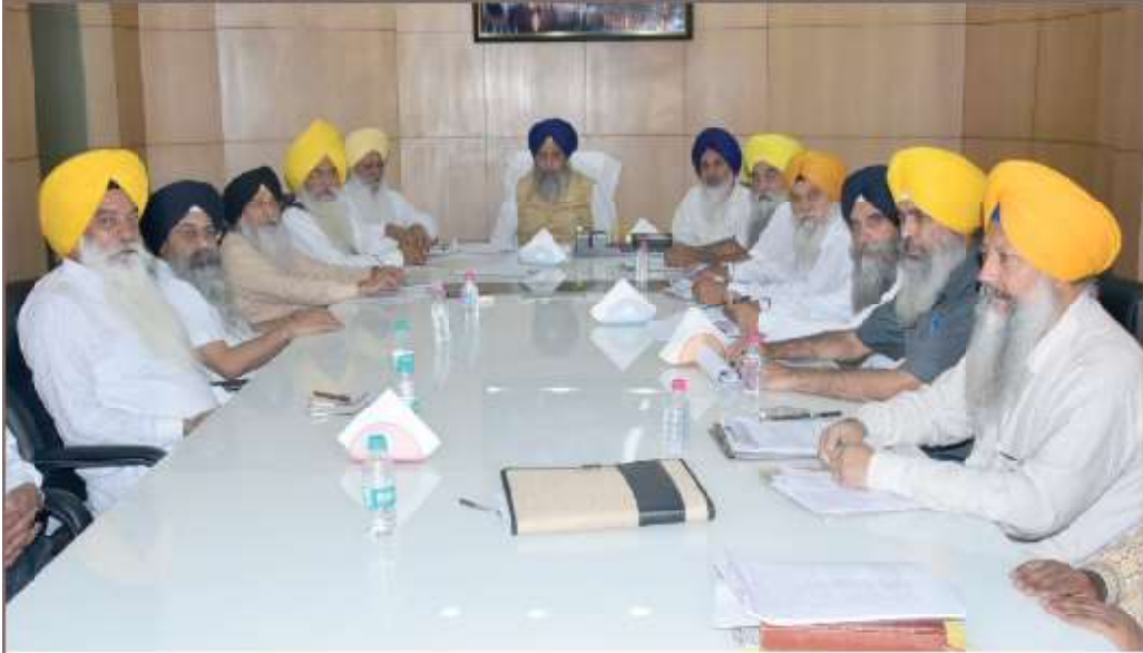
ਉਪ ਦਫ਼ਤਰ ਚੰਡੀਗੜ੍ਹ ਵਿਖੇ ਧਰਮ ਪ੍ਰਚਾਰ ਕਮੇਟੀ ਦੀ ਇਕੱਤਰਤਾ ਸਮੇਂ ਪ੍ਰਧਾਨਗੀ ਕਰਦੇ ਹੋਏ ਸ਼੍ਰੋਮਣੀ ਕਮੇਟੀ ਪ੍ਰਧਾਨ ਭਾਈ ਗੋਬਿੰਦ ਸਿੰਘ ਲੌਂਗੋਵਾਲ ਅਤੇ ਇਕੱਤਰਤਾ 'ਚ ਹਾਜ਼ਰ ਮੈਂਬਰ ਸਾਹਿਬਾਨ। (4 ਮਈ)