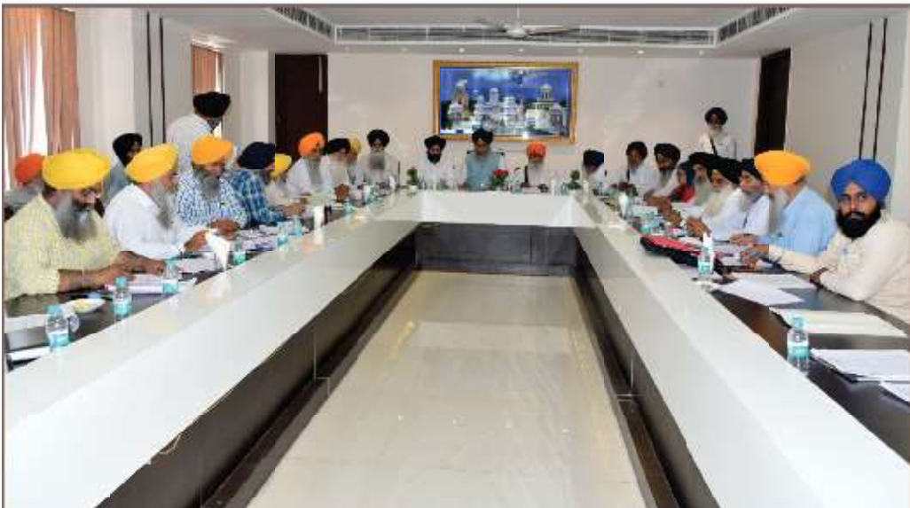
ਤਖ਼ਤ ਸ੍ਰੀ ਦਮਦਮਾ ਸਾਹਿਬ ਦੇ ਇਕੱਤਰਤਾ ਹਾਲ ਵਿਖੇ ਸ਼੍ਰੋਮਣੀ ਕਮੇਟੀ ਦੀ ਅੰਤ੍ਰਿੰਗ ਕਮੇਟੀ ਦੀ ਮੀਟਿੰਗ ਸਮੇਂ ਪ੍ਰਧਾਨਗੀ ਕਰਦੇ ਹੋਏ ਭਾਈ ਗੋਬਿੰਦ ਸਿੰਘ ਲੌਂਗੋਵਾਲ ਅਤੇ ਮੀਟਿੰਗ 'ਚ ਹਾਜ਼ਰ ਸ਼੍ਰੋਮਣੀ ਕਮੇਟੀ ਦੇ ਅਹੁਦੇਦਾਰ ਅਤੇ ਅਧਿਕਾਰੀ। (20 ਅਪ੍ਰੈਲ)