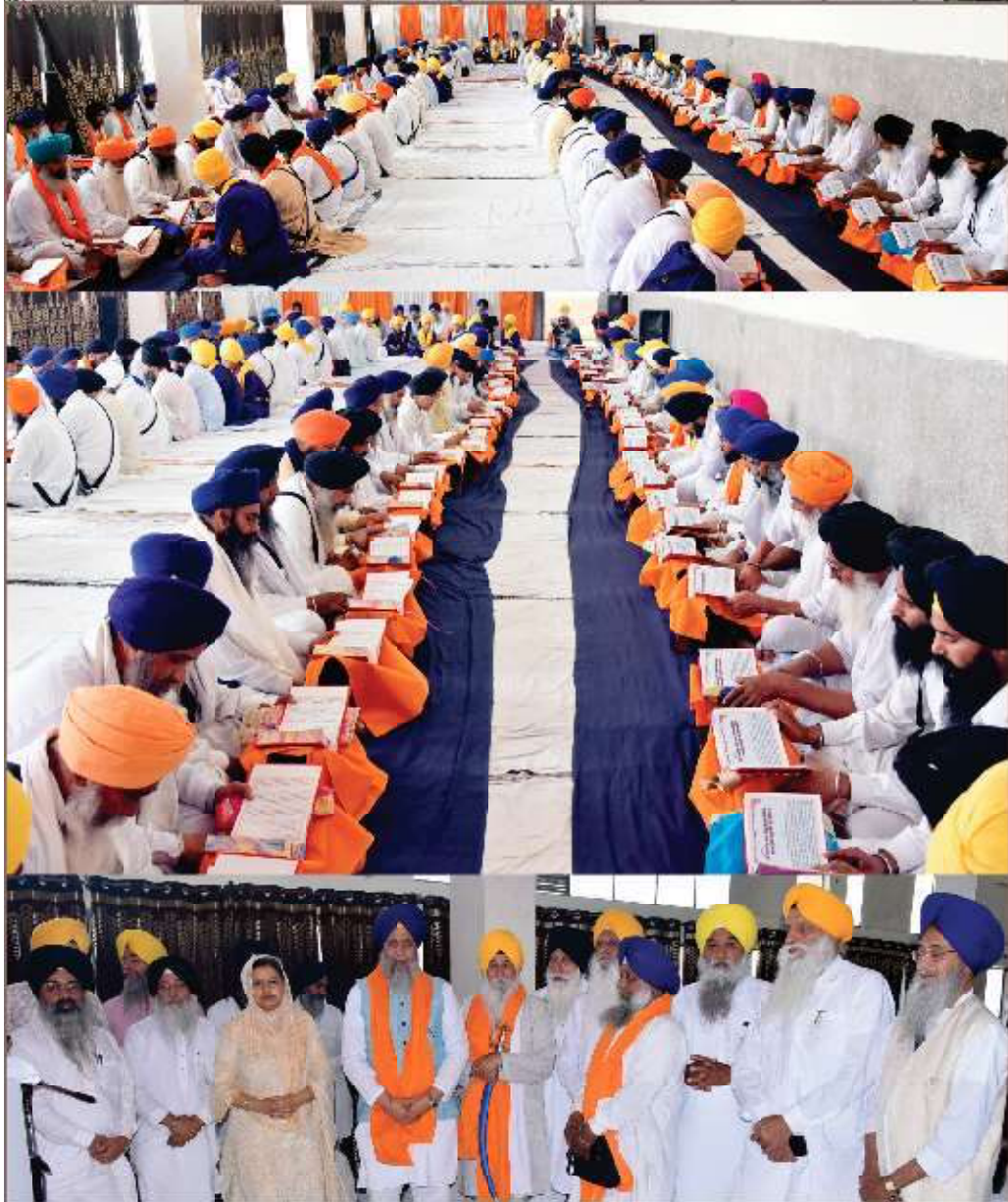
ਧਰਮ ਪ੍ਰਚਾਰ ਕਮੇਟੀ ਵੱਲੋਂ ਗ੍ਰੰਥੀ ਤੇ ਅਖੰਡਪਾਠੀ ਸਿੰਘਾਂ ਨੂੰ ਗੁਰਬਾਣੀ ਸੰਬੰਧਿਤਾ ਦੇਣ ਲਈ ਭਾਈ ਗੁਰਦਾਸ ਹਾਲ (ਸ੍ਰੀ ਅੰਮ੍ਰਿਤਸਰ ਸਾਹਿਬ) ਵਿਖੇ ਪਾਠ ਬੋਧ ਸਮਾਗਮ ਦੀ ਆਰੰਭਤਾ ਕਰਵਾਉਣ ਸਮੇਂ ਸ਼੍ਰੋਮਣੀ ਕਮੇਟੀ ਪ੍ਰਧਾਨ ਭਾਈ ਗੋਬਿੰਦ ਸਿੰਘ ਲੌਂਗੋਵਾਲ, ਸ਼੍ਰੋਮਣੀ ਕਮੇਟੀ ਮੈਂਬਰ ਸਾਹਿਬਾਨ, ਅਧਿਕਾਰੀ ਅਤੇ ਹੋਰ ਪ੍ਰਮੁੱਖ ਜ਼ਖ਼ਸੀਅਤਾਂ (17 ਅਪ੍ਰੈਲ)