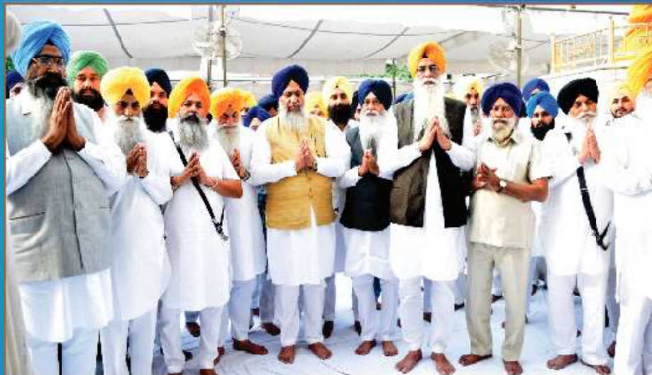
ਨਵੰਬਰ 1984 ਦੇ ਸਿੱਖ ਕਤਲੇਆਮ ਸਮੇਂ ਸ਼ਹੀਦ ਹੋਏ ਸਿੱਖਾਂ ਦੀ ਯਾਦ ਵਿਚ ਗੁਰਦੁਆਰਾ ਝੰਡਾ ਖੁੰਗਾ ਸਾਹਿਬ ਵਿਖੇ ਸ੍ਰੀ ਅਖੰਡ ਪਾਠ ਸਾਹਿਬ ਦੇ ਭੋਗ ਸਮੇਂ ਅਰਦਾਸ 'ਚ ਸ਼ਾਮਲ ਪ੍ਰਧਾਨ ਭਾਈ ਗੋਬਿੰਦ ਸਿੰਘ ਲੌਂਗੋਵਾਲ, ਸ਼੍ਰੋਮਣੀ ਕਮੇਟੀ ਦੇ ਮੈਂਬਰ ਸਾਹਿਬਾਨ ਤੇ ਹੋਰ। (2 ਨਵੰਬਰ)