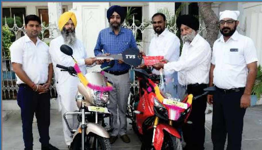
ਸੱਚਖੰਡ ਸ੍ਰੀ ਹਰਿਮੰਦਰ ਸਾਹਿਬ ਲਈ ਭੇਟ ਕੀਤੇ 2 ਮੋਟਰਸਾਈਕਲਾਂ ਦੀਆਂ ਚਾਬੀਆਂ ਸ਼੍ਰੋਮਣੀ ਕਮੇਟੀ ਅਧਿਕਾਰੀਆਂ ਨੂੰ ਸੌਂਪਦੇ ਹੋਏ ਟੀ.ਵੀ.ਐਸ. ਕੰਪਨੀ ਦੇ ਅਧਿਕਾਰੀ। (13 ਅਕਤੂਬਰ)