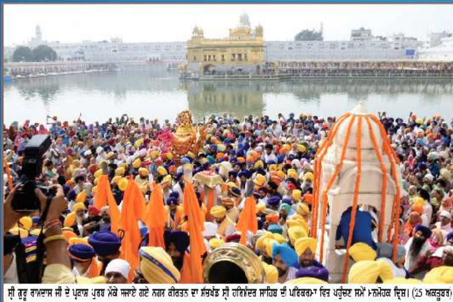
ਸ੍ਰੀ ਗੁਰੂ ਰਾਮਦਾਸ ਜੀ ਦੇ ਪ੍ਰਕਾਸ਼ ਪੁਰਬ ਮੌਕੇ ਜਸਾਏ ਗਏ ਨਗਰ ਕੀਰਤਨ ਦਾ ਸੰਬੰਧਿਤ ਸ੍ਰੀ ਹਰਿਮੰਦਰ ਸਾਹਿਬ ਦੀ ਪਰਿਕਰਮਾ ਵਿਚ ਖਰੁੰਚਣ ਸਮੇਂ ਮਨਮੋਹਕ ਦ੍ਰਿਸ਼। (25 ਅਕਤੂਬਰ)