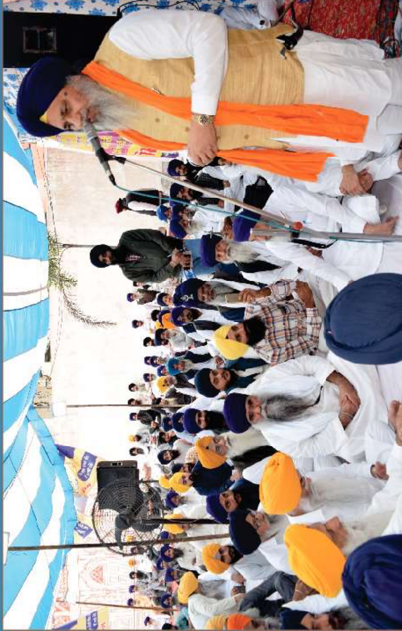
ਪੰਜਾਬ ਸਰਕਾਰ ਵੱਲੋਂ ਸਕੂਲੀ ਸਿਲੇਬਸ 'ਚ ਸਿੱਖ ਇਤਿਹਾਸ ਨਾਲ ਕੀਤੀ ਛੇਤਛਾਤ ਵਿਰੁੱਧ ਲਗਾਏ ਗਏ ਰੋਸ ਧਰਨੇ 'ਚ ਸ਼ਾਮਲ ਸੰਗਤਾਂ ਨੂੰ ਸੰਬੋਧਨ ਕਰਦੇ ਹੋਏ ਸ਼੍ਰੋਮਣੀ ਕਮੇਟੀ ਪ੍ਰਧਾਨ ਭਾਈ ਗੋਬਿੰਦ ਸਿੰਘ ਲੌਂਗੋਵਾਲ। (3 ਨਵੰਬਰ)