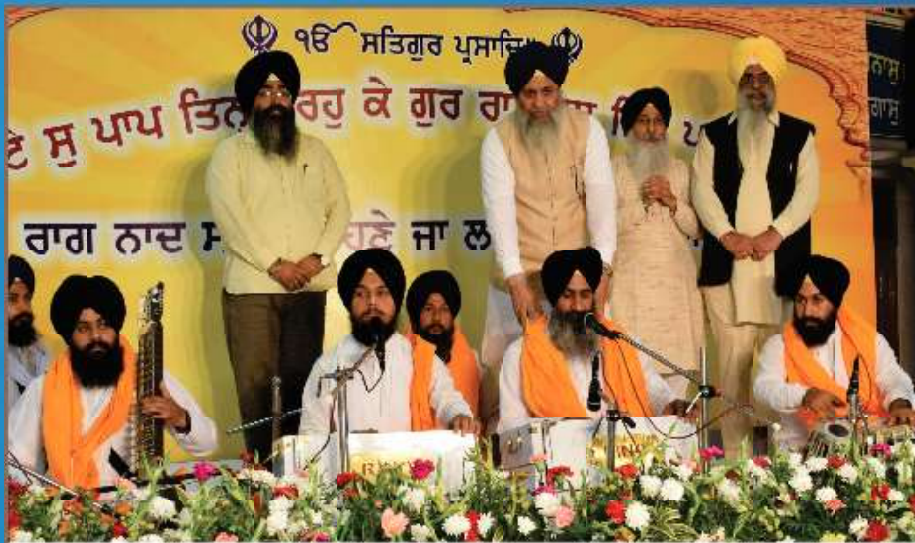
ਸ੍ਰੀ ਗੁਰੂ ਰਾਮਦਾਸ ਜੀ ਦੇ ਪ੍ਰਕਾਸ਼ ਪੁਰਬ ਸਮੇਂ ਪਹਿਲੀ ਵਾਰ ਕਰਵਾਏ ਗਏ ਪੜਤਾਲ ਗਾਇਨ ਕੀਰਤਨ ਦਰਬਾਰ ਸਮੇਂ ਕੀਰਤਨੀ ਜਥਿਆਂ ਨੂੰ ਸਿਰੋਪਾਓਂ ਦਿੰਦੇ ਹੋਏ ਸ਼੍ਰੋਮਣੀ ਕਮੇਟੀ ਪ੍ਰਧਾਨ ਡਾਈ ਰੋਬਿੰਦ ਸਿੰਘ ਲੌਂਗੋਵਾਲ ਅਤੇ ਹੋਰ। (24 ਅਕਤੂਬਰ)