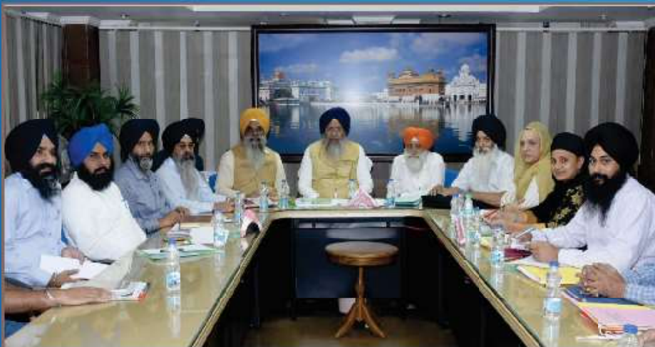
ਸ਼੍ਰੋਮਣੀ ਕਮੇਟੀ ਦੇ ਪ੍ਰਬੰਧਕੀ ਬਲਾਕ ਦੇ ਇਕੱਤਰਤਾ ਹਾਲ ਵਿਖੇ ਸਿੱਖ ਇਤਿਹਾਸ ਰੀਸਰਚ ਬੋਰਡ ਦੀ ਇਕੱਤਰਤਾ ਦੀ ਪ੍ਰਧਾਨਗੀ ਕਰਦੇ ਹੋਏ ਸ਼੍ਰੋਮਣੀ ਕਮੇਟੀ ਪ੍ਰਧਾਨ ਭਾਈ ਗੋਬਿੰਦ ਸਿੰਘ ਲੌਂਗੋਵਾਲ। ਇਕੱਤਰਤਾ 'ਚ ਸ਼ਾਮਲ ਸਿੱਖ ਇਤਿਹਾਸ ਬੋਰਡ ਦੇ ਮੈਂਬਰ ਸਾਹਿਬਾਨ, ਅਧਿਕਾਰੀ ਤੇ ਹੋਰ। (17 ਅਕਤੂਬਰ)