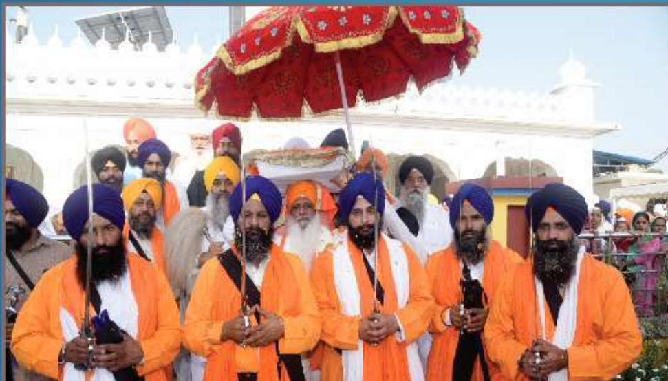
ਸ੍ਰੀ ਗੁਰੂ ਨਾਨਕ ਦੇਵ ਜੀ ਦੇ 550ਸਾਲਾ ਪੁਕਾਸ ਪੁਰਬ ਨੂੰ ਨਮਰਪਿਤ ਗੁਰਦੁਆਰਾ ਕੋਤੀ ਵਾਲਾ ਘਾਟ ਯੂ.ਪੀ. ਤੋਂ ਆਰੰਭ ਹੋਏ ਨਗਰ ਕੀਰਤਨ ਸਮੇਂ ਖਾਲਕੀ ਸਾਹਿਬ ਵਿਚ ਸ੍ਰੀ ਗੁਰੂ ਗ੍ਰੰਥ ਸਾਹਿਬ ਜੀ ਦੇ ਯਾਵਨ ਸਰੂਪ ਨੂੰ ਜੁੜੇਭਿਤ ਕਰਨ ਲਈ ਪੰਜ ਪਿਆਰਿਆਂ ਦੀ ਅਗਵਾਈ ਵਿਚ ਲਿਜਾਂਦੀਆਂ ਹੋਈਆਂ ਸੰਗਤਾਂ। (1 ਅਕਤੂਬਰ)