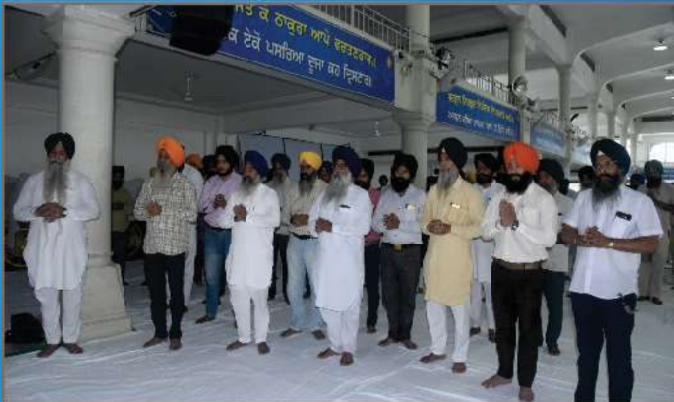
ਕਾਬਾ ਸ਼ੇਖ ਫਰੀਦ ਜੀ ਦੇ ਆਯੋਜਨ ਪੁਰਬ ਮੌਕੇ ਗੁਰਦੁਆਰਾ ਨੀ ਮੰਜੀ ਸਾਹਿਬ ਦੀਵਾਨ ਹਾਲ ਸ੍ਰੀ ਅੰਮ੍ਰਿਤਸਰ ਵਿਖੇ ਕਰਵਾਏ ਗਏ ਸਮਾਜਮ ਸ਼ੇਕੇ ਅਵਦਾਸ ਵਿਚ ਸ਼ਾਮਲ ਸੰਗਤਾਂ। (23 ਸਤੰਬਰ)