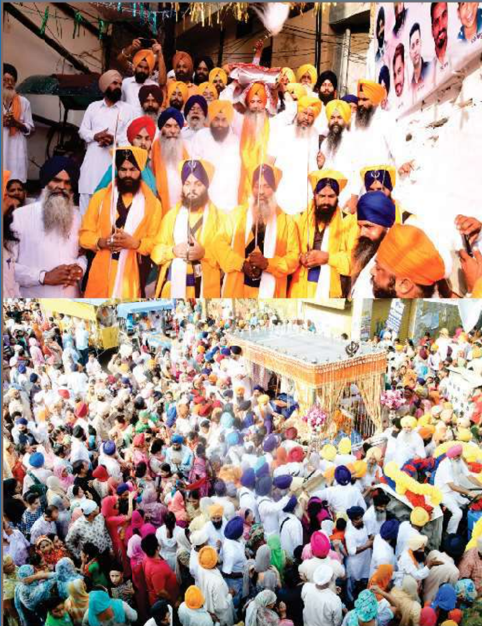
ਸ੍ਰੀ ਗੁਰੂ ਨਾਨਕ ਦੇਵ ਜੀ ਦੇ ਵਿਆਹ ਪੁਰਬ ਨੂੰ ਸਮਰਪਿਤ ਗੁਰਦੁਆਰਾ ਛੇਹਰਾ ਸਾਹਿਬ ਬਟਾਲਾ ਤੋਂ ਸਜਾਏ ਗਏ ਨਗਰ ਕੀਰਤਨ ਦੀਆਂ ਮਨਮੋਹਕ ਤਸਵੀਰਾਂ।