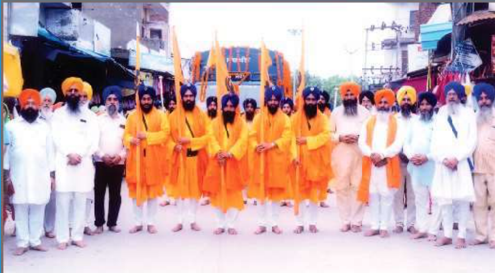
ਸ੍ਰੀ ਗੁਰੂ ਅਮਰਦਾਸ ਜੀ ਦੇ ਜੋਤੀ-ਜੋਤਿ ਪੁਰਬ ਨੂੰ ਸਮਰਪਿਤ ਗੁਰਦੁਆਰਾ ਚੁਬਾਰਾ ਸਾਹਿਬ ਤੋਂ ਗੁਰਦੁਆਰਾ ਬਾਉਲੀ ਸਾਹਿਬ, ਗੋਇੰਦਵਾਲ ਸਾਹਿਬ ਤੀਕ ਸਜਾਏ ਗਏ ਨਗਰ ਕੀਰਤਨ ਦੀ ਤਸਵੀਰ।