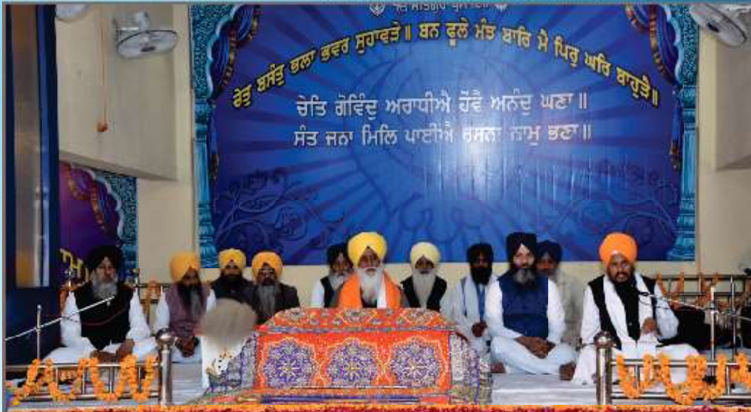
ਸੰਮਤ ਨਾਨਕਸ਼ਾਹੀ 551 ਦੀ ਆਮਦ ਸਬੰਧੀ ਗੁ: ਸ੍ਰੀ ਮੰਜੀ ਸਾਹਿਬ ਦੀਵਾਨ ਹਾਲ ਸ੍ਰੀ ਅੰਮ੍ਰਿਤਸਰ ਵਿਖੇ ਕਰਵਾਏ ਗਏ ਗੁਰਮਤਿ ਸਮਾਗਮ ਦੌਰਾਨ ਸੰਗਤਾਂ ਨਾਲ ਗੁਰਮਤਿ ਵਿਚਾਰਾਂ ਸਾਂਝੀਆਂ ਕਰਦੇ ਹੋਏ ਸ੍ਰੀ ਅਕਾਲ ਤਖ਼ਤ ਸਾਹਿਬ ਦੇ ਜਥੇਦਾਰ ਗਿਆਨੀ ਹਰਪ੍ਰੀਤ ਸਿੰਘ ਤੇ ਸਟੇਜ 'ਤੇ ਬਿਰਾਜਮਾਨ ਪ੍ਰਮੁੱਖ ਸ਼ਖ਼ਸੀਅਤਾਂ। (13 ਮਾਰਚ)