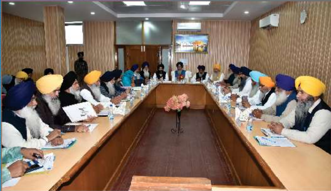
ਕਲਗੀਧਰ ਨਿਵਾਸ ਚੰਡੀਗੜ੍ਹ ਵਿਖੇ ਸ਼੍ਰੋਮਣੀ ਕਮੇਟੀ ਦੀ ਅੰਤਿੰਗ ਕਮੇਟੀ ਦੀ ਇਕੱਤਰਤਾ ਸਮੇਂ ਪ੍ਰਧਾਨਗੀ ਕਰਦੇ ਹੋਏ ਭਾਈ ਗੋਬਿੰਦ ਸਿੰਘ ਲੌਂਗੋਵਾਲ ਅਤੇ ਇਕੱਤਰਤਾ ਵਿਚ ਸ਼ਾਮਲ ਅਹੁਦੇਦਾਰ ਤੇ ਅਧਿਕਾਰੀ। (8 ਮਾਰਚ)