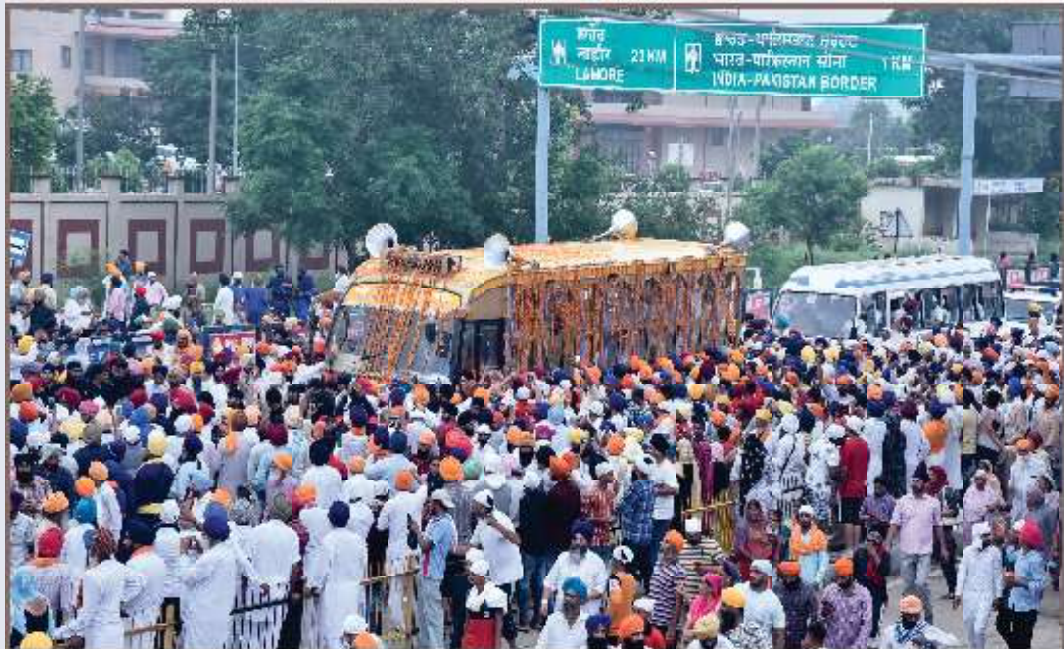
ਸ੍ਰੀ ਨਨਕਾਣਾ ਸਾਹਿਬ ਤੋਂ ਆਰੰਭ ਹੋਏ ਅੰਤਰਰਾਸ਼ਟਰੀ ਨਗਰ ਕੀਰਤਨ ਦੇ ਅਟਾਰੀ ਸਰਹੱਦ ਪੁੱਜਣ ਸਮੇਂ ਜੰਗਲ ਵੱਲੋਂ ਕੀਤੇ ਗਏ ਖ਼ਾਨਦਾਰ ਸਵਾਗਤ ਦਾ ਦ੍ਰਿਸ਼ (1 ਅਗਸਤ)