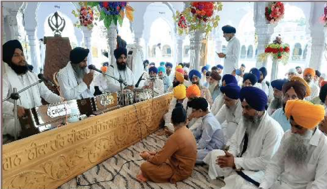
ਨਗਰ ਕੀਰਤਨ ਦੇ ਆਰੰਭਤਾ ਤੋਂ ਪਹਿਲੀ ਸ਼ਾਮ ਗੁਰਦੁਆਰਾ ਸ੍ਰੀ ਨਨਕਾਣਾ ਸਾਹਿਬ ਵਿਖੇ ਸਜੇ ਦੀਵਾਨ ਅੰਦਰ ਸੰਤਖੰਡ ਸ੍ਰੀ ਹਰਿਮੰਦਰ ਸਾਹਿਬ ਦਾ ਹਜ਼ੂਰੀ ਰਾਗੀ ਜਥਾ ਗੁਰਦਾਣੀ ਕੀਰਤਨ ਕਰਦਾ ਹੋਇਆ। (31 ਜੁਲਾਈ)