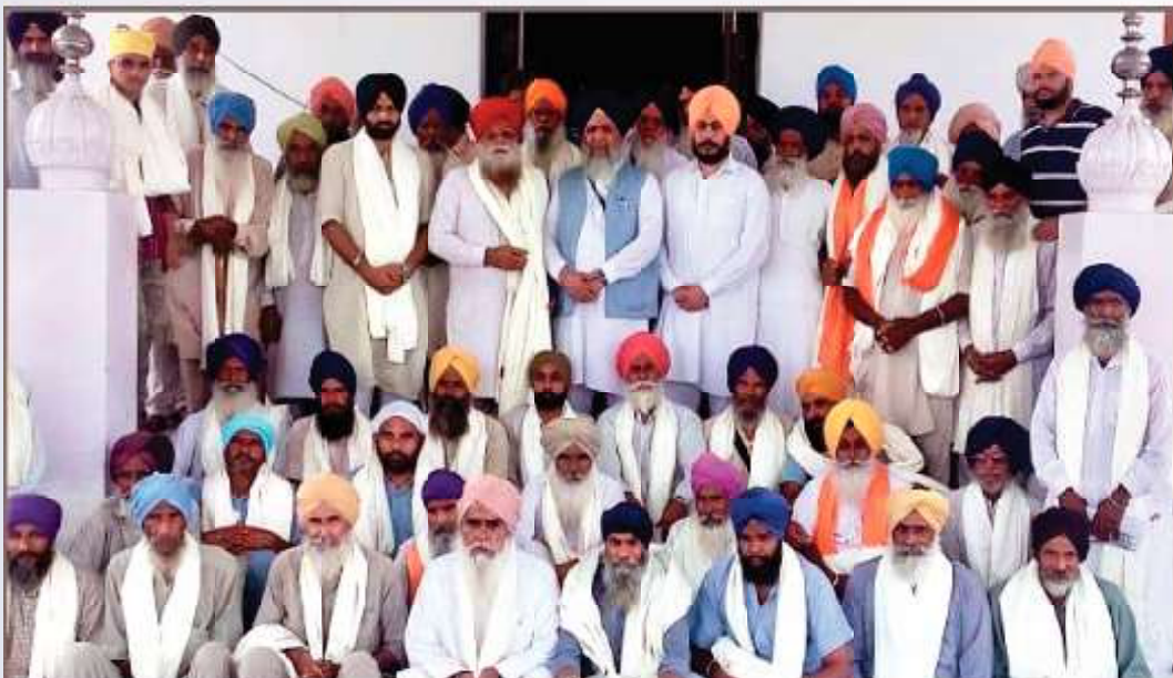
ਸੰਗਰੂਰ ਜ਼ਿਲ੍ਹੇ ਦੇ ਨਗਰ ਚੀਮਾ ਵਿਖੇ ਸ਼ਹੀਦੀ ਸਮਾਗਮ ਚੌਰਾਨ ਜੂਨ 1984 ਦੇ ਸ਼ਹੀਦਾਂ ਦੇ ਪਰਿਵਾਰਕ ਮੈਂਬਰਾਂ ਨੂੰ ਸਨਮਾਨਿਤ ਕਰਦੇ ਹੋਏ ਸ਼੍ਰੋਮਣੀ ਕਮੇਟੀ ਦੇ ਪ੍ਰਧਾਨ ਭਾਈ ਗੋਬਿੰਦ ਸਿੰਘ ਲੌਕੋਵਾਲ। (22 ਜੁਲਾਈ)