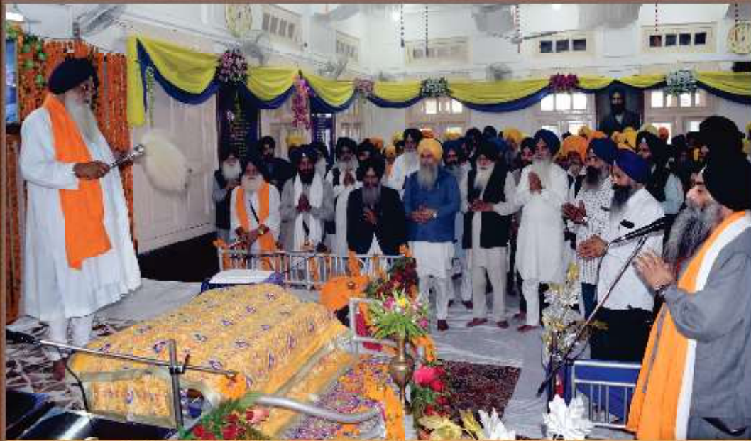
ਤੇਜਾ ਸਿੰਘ ਸਮੁੰਦਰੀ ਹਾਲ ਵਿਖੇ ਸ਼੍ਰੋਮਣੀ ਕਮੇਟੀ ਦੇ ਸਥਾਪਨਾ ਦਿਵਸ ਮੌਕੇ 'ਤੇ ਕਰਵਾਏ ਗਏ ਸਮਾਗਮ ਦੌਰਾਨ ਅਰਦਾਸ 'ਚ ਖ਼ਾਮਲ ਸਿੰਘ ਸਾਹਿਬ ਗਿਆਨੀ ਜਗਤਾਰ ਸਿੰਘ, ਸ਼੍ਰੋਮਣੀ ਕਮੇਟੀ ਦੇ ਮੈਂਬਰ ਸਾਹਿਬਾਨ, ਆਧਿਕਾਰੀ ਤੇ ਕਰਮਚਾਰੀ। (15 ਨਵੰਬਰ)