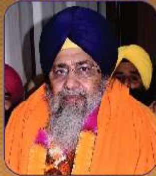
ਭਾਈ ਗੋਬਿੰਦ ਸਿੰਘ ਲੌਂਗੋਵਾਲ ਪ੍ਰਧਾਨ