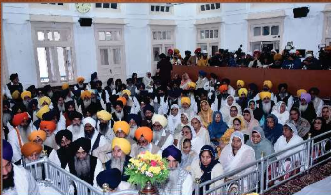
ਸ਼੍ਰੋਮਣੀ ਗੁਰਦੁਆਰਾ ਪ੍ਰਬੰਧਕ ਕਮੇਟੀ ਦੇ ਅਹੁਦੇਦਾਰਾਂ ਦੀ ਚੋਣ ਸਬੰਧੀ ਹੋਏ ਜਨਰਲ ਟਿਜਲਾਜ ਦੌਰਾਨ ਹਾਜ਼ਰ ਮੈਂਬਰ ਸਾਹਿਬਾਨ। (27 ਨਵੰਬਰ)