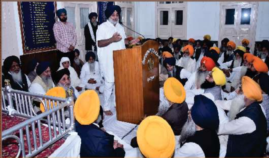
ਸ਼੍ਰੋਮਣੀ ਗੁਰਦੁਆਰਾ ਪ੍ਰਬੰਧਕ ਕਮੇਟੀ ਦੇ ਪ੍ਰਧਾਨ, ਅਹੁਦੇਦਾਰਾਂ ਤੇ ਅੰਬਿੰਗ ਕਮੇਟੀ ਮੈਂਬਰਾਂ ਦੀ ਚੋਣ ਤੋਂ ਪਹਿਲਾਂ ਸ਼੍ਰੋਮਣੀ ਕਮੇਟੀ ਮੈਂਬਰਾਂ ਦੀ ਇਕੱਤਰਤਾ ਨੂੰ ਸੰਬੋਧਨ ਕਰਦੇ ਹੋਏ ਸ਼੍ਰੋਮਣੀ ਅਕਾਲੀ ਦਲ ਦੇ ਪ੍ਰਧਾਨ ਜ. ਸੁਖਬੀਰ ਸਿੰਘ ਬਾਦਲ। (27 ਨਵੰਬਰ)