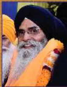
ਸ. ਹਰਜਿੰਦਰ ਸਿੰਘ ਧਾਮੀ ਜਨਰਲ ਸਕੱਤਰ