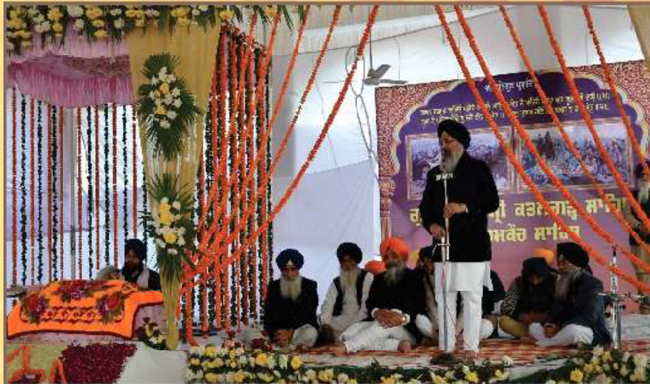
ਗੁਰਦੁਆਰਾ ਸ੍ਰੀ ਕਤਲਗੜ੍ਹ ਸਾਹਿਬ ਚਮਕੌਰ ਸਾਹਿਬ ਵਿਖੇ ਸ਼ਹੀਦਾਂ ਦੀ ਯਾਦ ਵਿਚ ਸਾਲਾਨਾ ਜੋੜ-ਮੇਲ ਸਮੇਂ ਸੰਗਤਾਂ ਨੂੰ ਸੰਬੋਧਨ ਕਰਦੇ ਹੋਏ ਸ਼੍ਰੋਮਣੀ ਕਮੇਟੀ ਪ੍ਰਧਾਨ ਭਾਈ ਗੋਬਿੰਦ ਸਿੰਘ ਲੌਗੋਵਾਲ ਅਤੇ ਹਾਜ਼ਰ ਪ੍ਰਮੁੱਖ ਸ਼ਖਸੀਅਤਾਂ। (22 ਦਸੰਬਰ)