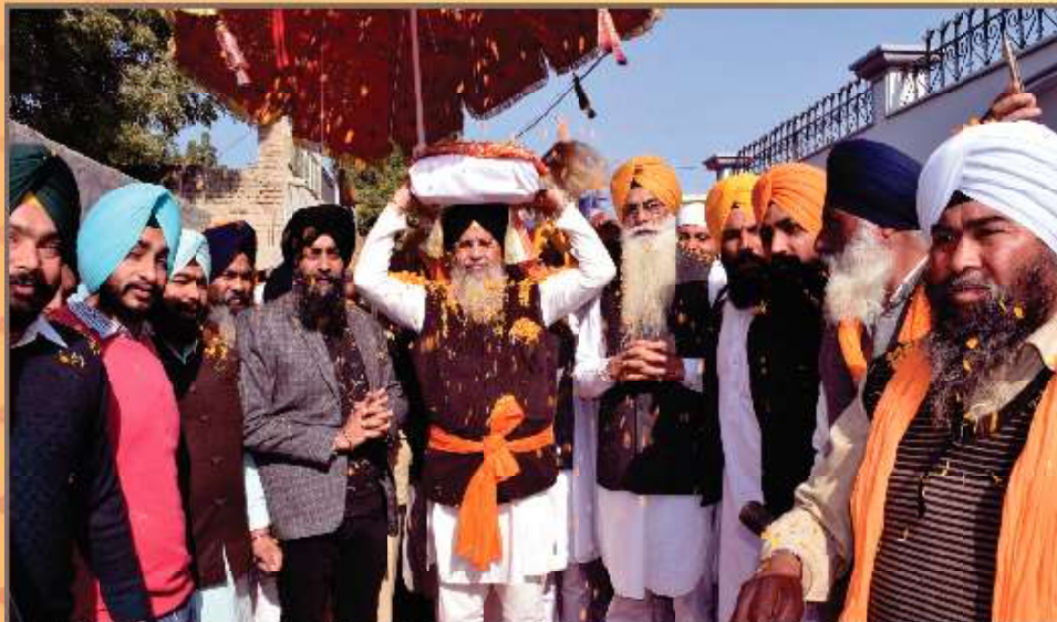
ਇੱਕ ਪਿੰਡ ਇੱਕ ਗੁਰਦੁਆਰਾ ਸਾਹਿਬ ਮੁਹਿੰਮ ਤਹਿਤ ਜਿਲ੍ਹਾ ਫ਼ਾਇਲਕਾ ਦੇ ਪਿੰਡ ਫਤਹਿਗੜ੍ਹ ਵਿਖੇ ਦੇ ਗੁਰਦੁਆਰਿਆਂ ਤੋਂ ਇੱਕ ਗੁਰਦੁਆਰਾ ਸਾਹਿਬ ਕਰਨ ਸਮੇਂ ਸ੍ਰੀ ਗੁਰੂ ਕ੍ਰਿਸ਼ ਸਾਹਿਬ ਜੀ ਦਾ ਪਾਵਨ ਸਰੂਪ ਲਿਜਾਣ ਦੀ ਸੇਵਾ ਕਰਦੇ ਹੋਏ ਸ਼੍ਰੋਮਣੀ ਕਮੇਟੀ ਪ੍ਰਧਾਨ ਭਾਈ ਗੋਬਿੰਦ ਸਿੰਘ ਲੌਂਗੋਵਾਲ। (15 ਦਸੰਬਰ)