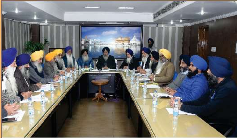
ਧਰਮ ਪ੍ਰਚਾਰ ਕਮੇਟੀ ਦੀ ਇਕੱਤਰਤਾ ਸਮੇਂ ਪ੍ਰਧਾਨਗੀ ਕਰਦੇ ਹੋਏ ਸ਼੍ਰੋਮਣੀ ਕਮੇਟੀ ਪ੍ਰਧਾਨ ਭਾਈ ਗੋਬਿੰਦ ਸਿੰਘ ਲੌਹੋਵਾਲ ਅਤੇ ਰਾਜਰ ਧਰਮ ਪ੍ਰਚਾਰ ਕਮੇਟੀ ਦੇ ਮੈਂਬਰਾਨ ਅਤੇ ਸ਼੍ਰੋਮਣੀ ਕਮੇਟੀ ਅਧਿਕਾਰੀ। (7 ਦਸੰਬਰ)