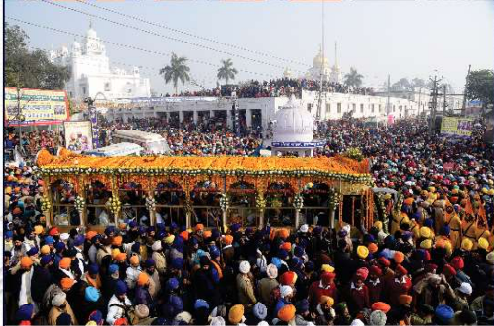
ਮਾਤਾ ਗੁਜਰੀ ਜੀ ਤੇ ਛੋਟੇ ਸਾਹਿਬਜ਼ਾਦਿਆਂ ਦੀ ਸ਼ਹਾਦਤ ਨੂੰ ਸਮਰਪਿਤ ਸ੍ਰੀ ਫਤਿਹਗੜ੍ਹ ਸਾਹਿਬ ਵਿਖੇ ਸਾਲਾਨਾ ਸ਼ਹੀਦੀ ਸਭਾ ਸਮੇਂ ਸਜਾਏ ਗਏ ਨਗਰ ਕੀਰਤਨ ਅਤੇ ਅਰਦਾਸ ਸਮਾਗਮ ਵਿਚ ਹਾਜ਼ਰ ਸ਼੍ਰੋਮਣੀ ਕਮੇਟੀ ਪ੍ਰਧਾਨ, ਸਿੰਘ ਸਾਹਿਬਾਨ, ਜਥੇਦਾਰ ਸਾਹਿਬਾਨ, ਮੈਂਬਰ ਸਾਹਿਬਾਨ, ਹੋਰ ਪ੍ਰਮੁੱਖ ਸ਼ਖ਼ਸੀਅਤਾਂ ਅਤੇ ਸੰਗਤਾਂ। (28 ਜਨਵਰੀ)