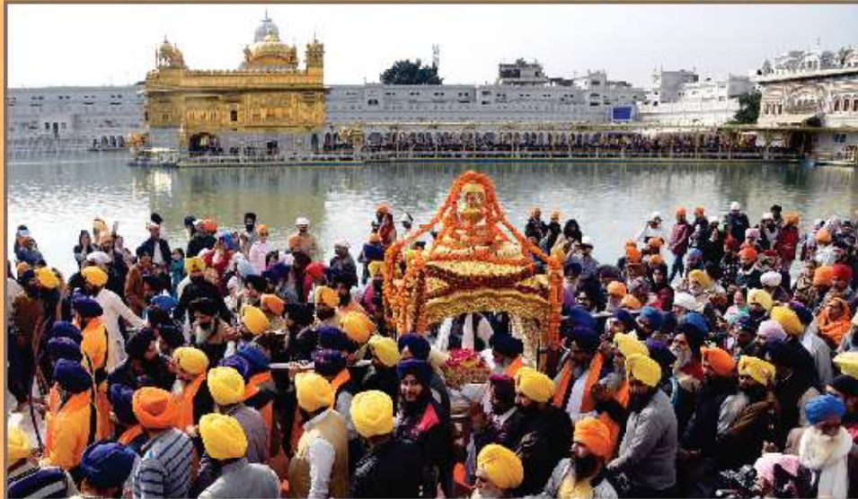
ਨੌਵੇਂ ਪਾਤਸ਼ਾਹ ਸ੍ਰੀ ਗੁਰੂ ਤੇਗ ਬਹਾਦਰ ਸਾਹਿਬ ਜੀ ਦੇ ਬਹੀਦੀ ਪੁਰਬ ਮੌਕੇ ਸ੍ਰੀ ਅਕਾਲ ਤਖ਼ਤ ਸਾਹਿਬ ਤੋਂ ਸਜਾਇਆ ਅਲੌਕਿਕ ਨਗਰ ਕੀਰਤਨ ਸੰਚਖੰਡ ਸ੍ਰੀ ਹਰਿਮੰਦਰ ਸਾਹਿਬ ਦੀ ਪਰਿਕਰਮਾਂ ਵਿਚੋਂ ਲੰਘਦਾ ਹੋਇਆ। (11 ਦਸੰਬਰ)