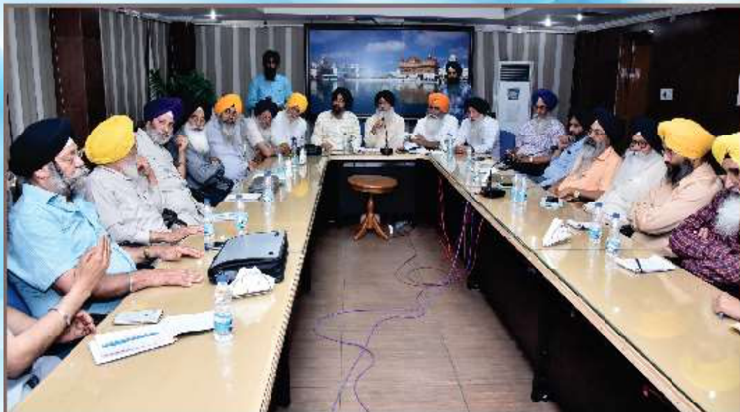
ਸ੍ਰੀ ਦਰਬਾਰ ਸਾਹਿਬ ਸਮੂਹ ਵਿਖੇ ਸਥਿਤ ਸਿੱਖ ਰੈਫ਼ਰੇਸ ਲ ਇਬ੍ਰੇਰੀ ਦੇ ਸਾਹਿਤਕ ਸਦਮਾਏ ਸਬੰਧੀ ਹੋਈ ਇਕੱਤਰਤਾ 'ਚ ਬਾਮਲ ਸ਼੍ਰੋਮਣੀ ਗੁਰਦੁਆਰਾ ਪ੍ਰਬੰਧਕ ਕਮੇਟੀ ਸ੍ਰੀ ਅੰਮ੍ਰਿਤਸਰ ਦੇ ਮੈਂਬਰਾਂ ਤੇ ਸਾਬਕਾ ਅਧਿਕਾਰੀ। (13 ਜੂਨ)