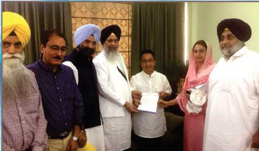
ਸਿੱਕਮ ਦੇ ਮੁੱਖ ਮੰਤਰੀ ਸ੍ਰੀ ਪ੍ਰੇਮ ਸਿੰਘ ਤਮੰਗ ਨੂੰ ਸਿੱਕਮ ਵਿੱਚ ਗੁ: ਸਾਹਿਬਾਨ ਦਾ ਮਸਲਾ ਹੱਲ ਕਰਨ ਲਈ ਪੱਤਰ ਸੌਂਪਦੇ ਹੋਏ ਸ. ਸੁਖਬੀਰ ਸਿੰਘ ਬਾਦਲ, ਭਾਈ ਗੋਬਿੰਦ ਸਿੰਘ ਲੌਂਗੋਵਾਲ, ਬੰਬਾ ਹਰਸਿਮਰਤ ਕੌਰ ਬਾਦਲ, ਸ. ਮਨਜਿੰਦਰ ਸਿੰਘ ਸਿਰਸਾ ਤੇ ਸ. ਭਗਵੰਤ ਸਿੰਘ ਸਿਆਲਕਾ (18 ਜੂਨ)