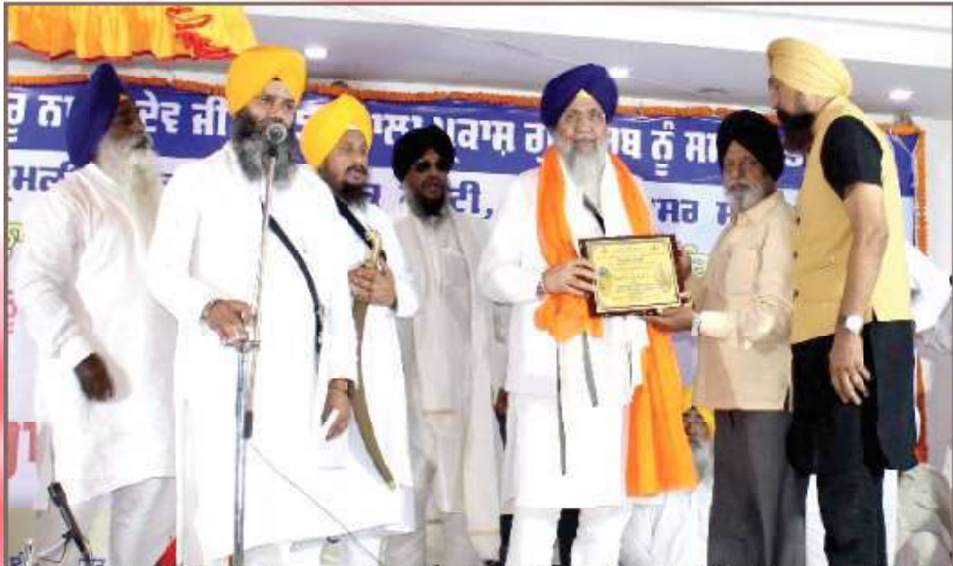
ਆਸਨਸੋਲ ਵਿਖੇ ਗੁਰਮਤਿ ਸਮਾਗਮ ਦੌਰਾਨ ਸ਼੍ਰੋਮਣੀ ਕਮੇਟੀ ਦੇ ਪ੍ਰਧਾਨ ਭਾਈ ਗੋਬਿੰਦ ਸਿੰਘ ਲੌਂਗੋਵਾਲ ਤੇ ਜਥੇਦਾਰ ਗਿਆਨੀ ਹਰਪ੍ਰੀਤ ਸਿੰਘ ਨੂੰ ਸਨਮਾਨਿਤ ਕਰਦੇ ਹੋਏ ਸਥਾਨਕ ਗੁਰਦੁਆਰਾ ਪ੍ਰਬੰਧਕ। (7 ਮਈ)