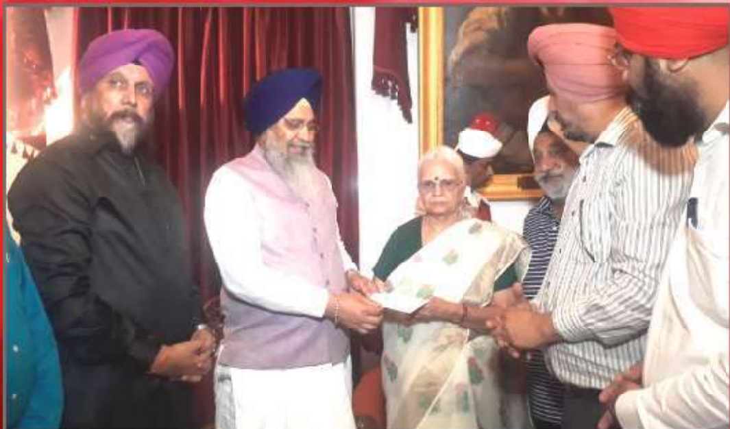
ਗੋਆ ਦੀ ਰਾਜਪਾਲ ਮ੍ਰਿਦੁਲਾ ਸਿਨਹਾ ਨੂੰ 550 ਸਾਲਾ ਪ੍ਰਕਾਸ਼ ਪੁਰਬ ਸਮਾਗਮਾਂ ਸਬੰਧੀ ਸੱਦਾ ਦਿੰਦੇ ਹੋਏ ਸ਼੍ਰੋਮਣੀ ਕਮੇਟੀ ਦੇ ਪ੍ਰਧਾਨ ਡਾਈ ਗੋਬਿੰਦ ਸਿੰਘ ਲੌਂਗੋਵਾਲ। (27 ਮਈ)