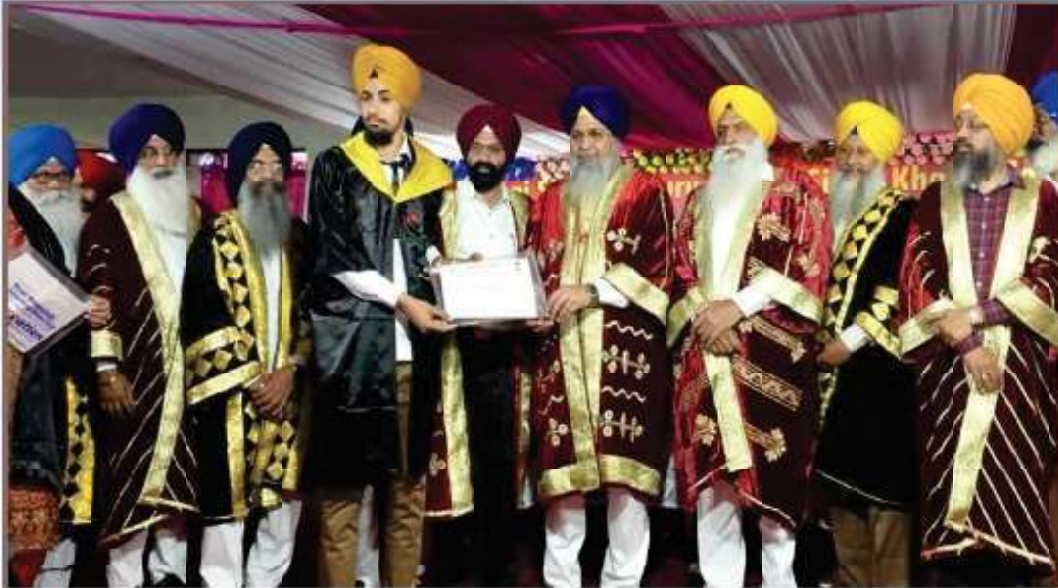
ਤ੍ਰੈ-ਸਤਾਬਦੀ ਗੁਰੂ ਗੋਬਿੰਦ ਸਿੰਘ ਖਾਲਸਾ ਕਾਲਜ ਸ੍ਰੀ ਅੰਮ੍ਰਿਤਸਰ ਵਿਖੇ ਸਾਲਾਨਾ ਡਿਗਰੀ ਵੰਡ ਸਮਾਗਮ ਦੌਰਾਨ ਵਿਦਿਆਰਥੀਆਂ ਨੂੰ ਡਿਗਰੀਆਂ ਪ੍ਰਦਾਨ ਕਰਦੇ ਹੋਏ ਸ਼੍ਰੋਮਣੀ ਕਮੇਟੀ ਦੇ ਪ੍ਰਧਾਨ ਭਾਈ ਗੋਬਿੰਦ ਸਿੰਘ ਲੌਂਗੋਵਾਲ। ਉਨ੍ਹਾਂ ਨਾਲ ਮੈਂਬਰ ਸਾਹਿਬਾਨ ਤੇ ਸ਼੍ਰੋਮਣੀ ਕਮੇਟੀ ਦੇ ਅਧਿਕਾਰੀ।