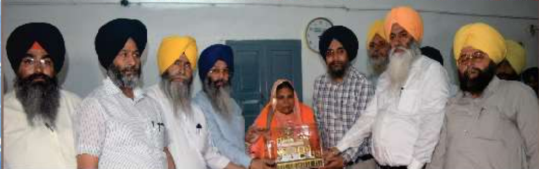
ਸ਼੍ਰੋਮਣੀ ਗੁਰਦੁਆਰਾ ਪ੍ਰਬੰਧਕ ਕਮੇਟੀ ਅਤੇ ਸ੍ਰੀ ਦਰਬਾਰ ਸਾਹਿਬ ਦੇ ਵੱਖ-ਵੱਖ ਮੁਲਾਜ਼ਮਾਂ ਨੂੰ ਜੇਵਾ-ਮੁਕਤ ਹੋਟ 'ਤੇ ਸਨਮਾਨਿਤ ਕਰਦੇ ਹੋਏ ਸ਼੍ਰੋਮਣੀ ਕਮੇਟੀ ਤੇ ਸ੍ਰੀ ਦਰਬਾਰ ਸਾਹਿਬ ਦੇ ਅਧਿਕਾਰੀ। (30 ਅਪ੍ਰੈਲ)