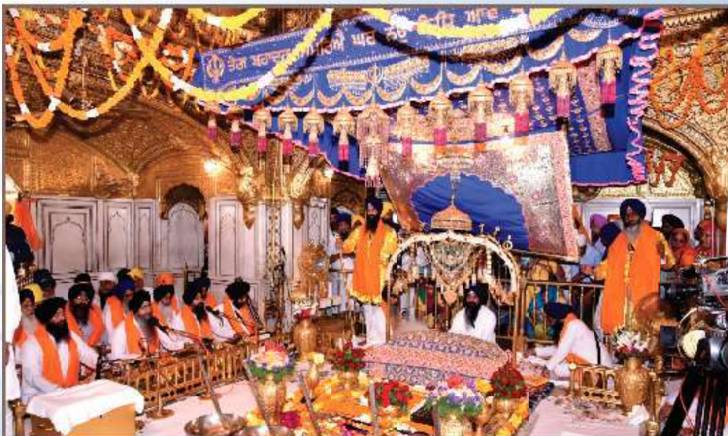
ਸ੍ਰੀ ਗੁਰੂ ਤੇਗ ਬਹਾਦਰ ਸਾਹਿਬ ਜੀ ਦੇ ਪ੍ਰਕਾਸ਼ ਪੁਰਬ ਮੌਕੇ ਸੰਚਖੰਡ ਸ੍ਰੀ ਹਰਿਮੰਦਰ ਸਾਹਿਬ ਵਿਖੇ ਸਜਾਏ ਗਏ ਅਲੌਕਿਕ ਜਲੋਂ ਦਾ ਦ੍ਰਿਸ਼। (24 ਅਪ੍ਰੈਲ)