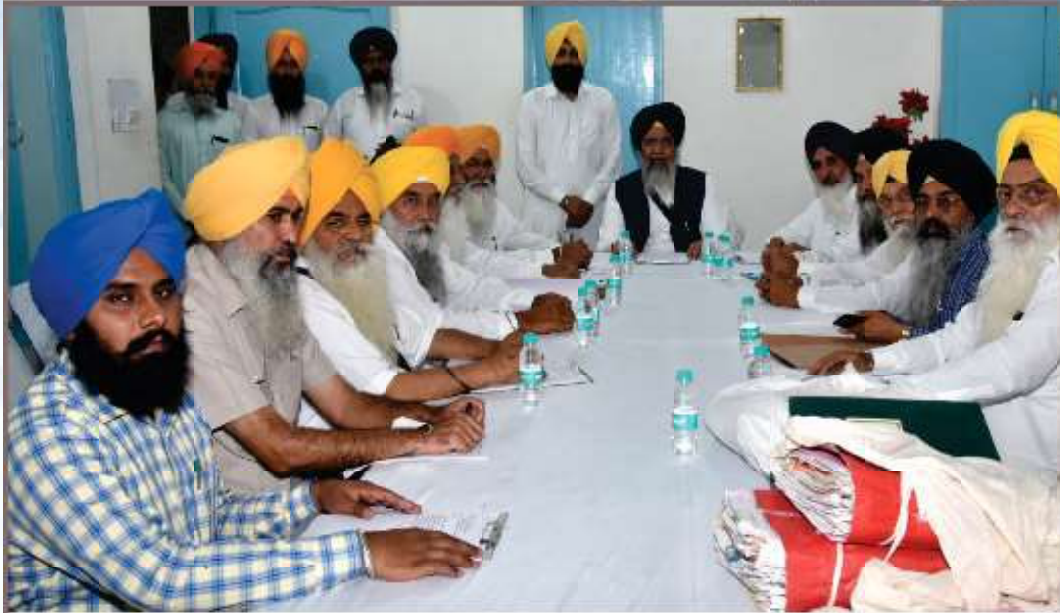
ਗੁਰਦੁਆਰਾ ਸ੍ਰੀ ਨਾਨਕਿਆਣਾ ਸਾਹਿਬ ਸੰਗਰੂਰ ਵਿਖੇ ਧਰਮ ਪ੍ਰਚਾਰ ਕਮੇਟੀ ਦੀ ਇਕੱਤਰਤਾ ਸਮੇਂ ਪ੍ਰਧਾਨਗੀ ਕਰਦੇ ਹੋਏ ਸ਼੍ਰੋਮਣੀ ਕਮੇਟੀ ਦੇ ਪ੍ਰਧਾਨ ਭਾਈ ਗੋਬਿੰਦ ਸਿੰਘ ਲੌਂਗੋਵਾਲ ਅਤੇ ਇਕੱਤਰਤਾ 'ਚ ਗਜ਼ਟ ਮੈਂਬਰਾਨ ਅਤੇ ਅਹੁਦੇਦਾਰ। (18 ਅਪ੍ਰੈਲ)