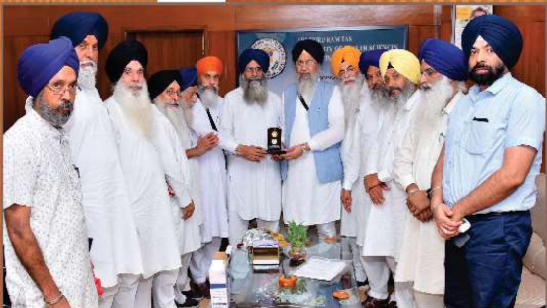
ਬਾਵਾ ਗੁਰਦੀਪ ਸਿੰਘ ਐਂਡ ਸੰਨਜ਼ ਸ੍ਰੀ ਅੰਮ੍ਰਿਤਸਰ ਵੱਲੋਂ ਸ੍ਰੀ ਗੁਰੂ ਨਾਨਕ ਦੇਵ ਜੀ ਦੇ 550ਵੇਂ ਪ੍ਰਕਾਸ਼ ਪੁਰਬ ਨੂੰ ਸਮਰਪਿਤ ਤਿਆਰ ਕੀਤੇ ਯਾਦਗਾਰੀ ਸਿੱਕੇ ਜਾਰੀ ਕਰਦੇ ਹੋਏ ਸ਼੍ਰੋਮਣੀ ਕਮੇਟੀ ਪ੍ਰਧਾਨ ਭਾਈ ਗੋਬਿੰਦ ਸਿੰਘ ਲੌਂਗੋਵਾਲ ਅਤੇ ਹੋਰ। (27 ਸਤੰਬਰ)