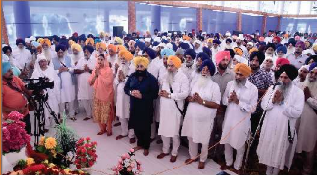
ਸ੍ਰੀ ਗੁਰੂ ਨਾਨਕ ਦੇਵ ਜੀ ਦੇ 550ਵੇਂ ਪ੍ਰਕਾਸ਼ ਪੁਰਬ ਨੂੰ ਸਮਰਪਿਤ ਜੁਲਤਾਨਪੁਰ ਲੋਧੀ ਨੂੰ ਵਾਈਟ ਸਿਟੀ ਬਣਾਉਣ ਲਈ ਆਰੰਭਤਾ ਦੀ ਅਰਦਾਸ ਵਿਚ ਸ਼ਾਮਲ ਸਾਬਕਾ ਮੁੱਖ ਮੰਤਰੀ ਸ. ਪ੍ਰਕਾਸ਼ ਸਿੰਘ ਬਾਦਲ, ਜ਼ੁਮਨੀ ਕਮੇਟੀ ਪ੍ਰਧਾਨ ਭਾਈ ਗੋਬਿੰਦ ਸਿੰਘ ਲੌਂਗੋਵਾਲ, ਜ਼ੁਮਨੀ ਅਕਾਲੀ ਦਲ ਦੇ ਪ੍ਰਧਾਨ ਸ. ਸੁਖਬੀਰ ਸਿੰਘ ਬਾਦਲ, ਕੇਂਦਰੀ ਮੰਤਰੀ ਬੀਬੀ ਹਰਸਿਮਰਤ ਕੌਰ ਬਾਦਲ ਤੇ ਹੋਰ। (5 ਸਤੰਬਰ)