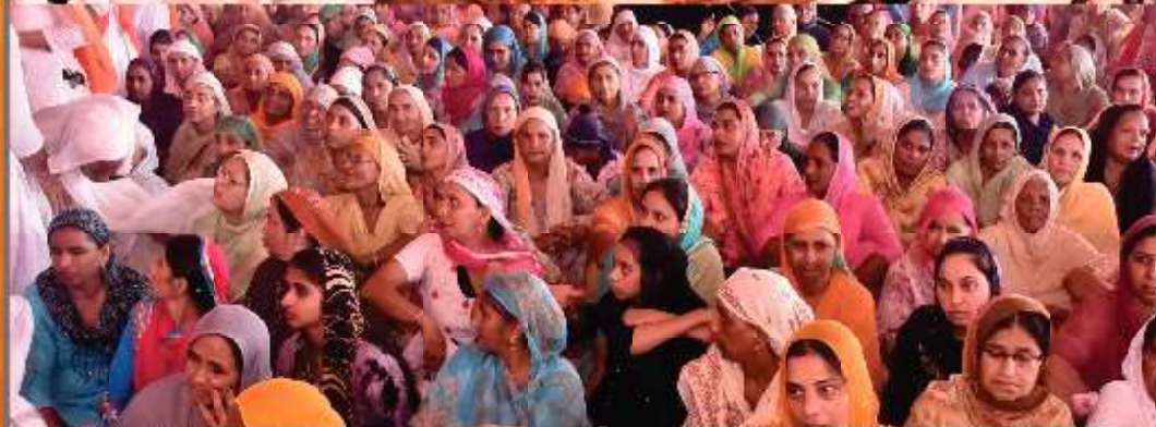
ਕੁਰੂਕਸ਼ੇਤਰ ਵਿਖੇ ਰਾਜ ਪੱਧਰੀ ਗੁਰਮਤਿ ਸਮਾਗਮ ਦੌਰਾਨ ਸੰਬੋਧਨ ਕਰਦੇ ਹੋਏ ਭਾਈ ਗੋਬਿੰਦ ਸਿੰਘ ਲੌਂਗੋਵਾਲ ਅਤੇ ਸਟੇਜ 'ਤੇ ਬੈਠੀਆਂ ਪ੍ਰਮੁੱਖ ਫ਼ੌਜੀਆਂ। ਹੇਠਾਂ ਸ਼੍ਰੋਮਣੀ ਅਕਾਲੀ ਦਲ ਦੇ ਪ੍ਰਧਾਨ ਸ. ਸੁਖਬੀਰ ਸਿੰਘ ਬਾਦਲ ਨੂੰ ਸਨਮਾਨਿਤ ਕਰਦੇ ਹੋਏ ਭਾਈ ਗੋਬਿੰਦ ਸਿੰਘ ਲੌਂਗੋਵਾਲ, ਸ. ਰਘੁਜੀਤ ਸਿੰਘ ਵਿਰਕ ਅਤੇ ਬਾਬਾ ਗੁਰਮੀਤ ਸਿੰਘ ਤ੍ਰਿਲੋਕੇਵਾਲਾ। (7 ਸਤੰਬਰ)