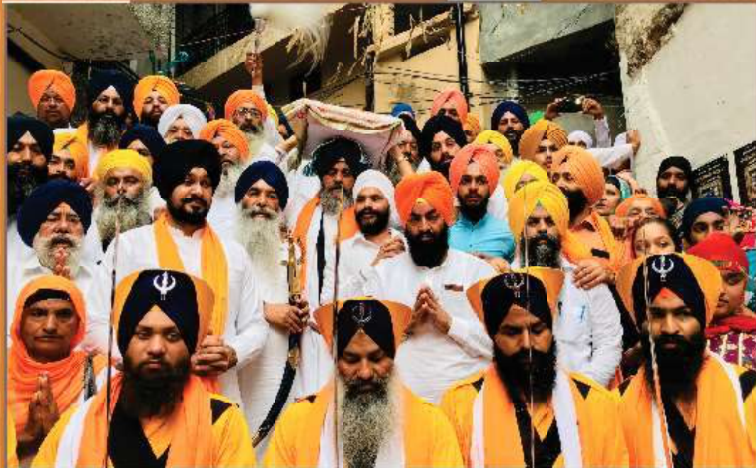
ਸ੍ਰੀ ਗੁਰੂ ਨਾਨਕ ਦੇਵ ਜੀ ਦੇ ਵਿਆਹ ਪੁਰਬ ਨੂੰ ਸਮਰਪਿਤ ਗੁਰਦੁਆਰਾ ਡੇਹਰਾ ਸਾਹਿਬ ਬਟਾਲਾ ਤੋਂ ਸਜਾਏ ਗਏ ਨਗਰ ਕੀਰਤਨ ਦੀ ਆਰੰਭ ਦਾ ਦ੍ਰਿਸ਼।