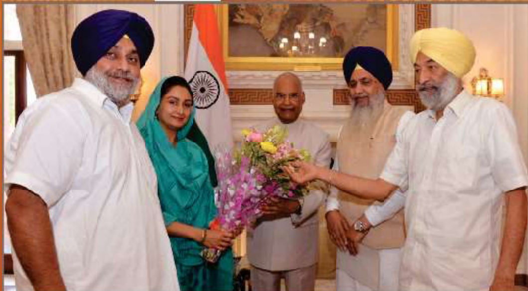
ਦੇਸ਼ ਦੇ ਰਾਸ਼ਟਰਪਤੀ ਸ੍ਰੀ ਰਾਮਨਾਥ ਕੋਵਿੰਦ ਨੂੰ 550ਵੇਂ ਪ੍ਰਕਾਸ਼ ਪੁਰਬ ਸਮਾਗਮਾਂ ਸਬੰਧੀ ਸੱਦਾ ਪੱਤਰ ਦੇਣ ਮੌਕੇ ਗੁਲਦਸਤਾ ਭੇਟ ਕਰਦੇ ਹੋਏ ਭਾਈ ਗੋਬਿੰਦ ਸਿੰਘ ਲੌਂਗੋਵਾਲ, ਸ. ਜੁਖਬੀਰ ਸਿੰਘ ਬਾਦਲ, ਬੀਬੀ ਹਰਸਿਮਰਤ ਕੌਰ ਬਾਦਲ ਅਤੇ ਸ. ਬਲਵਿੰਦਰ ਸਿੰਘ ਫੂਦਤ। (20 ਸਤੰਬਰ)