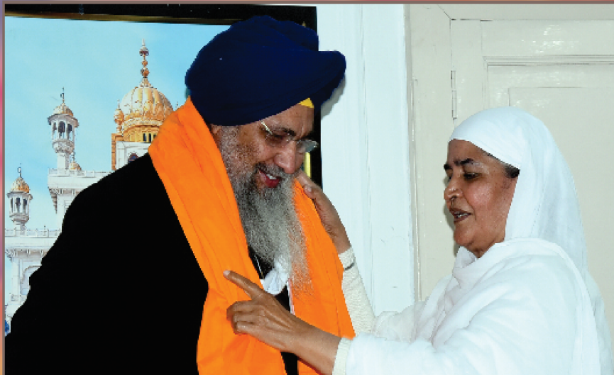
ਸ਼੍ਰੋਮਣੀ ਗੁਰਦੁਆਰਾ ਪ੍ਰਬੰਧਕ ਕਮੇਟੀ ਦੇ ਪ੍ਰਧਾਨ ਜੂਣੇ ਜਾਣ ਉਪਰੰਤ ਬੀਬੀ ਜਗੀਰ ਕੌਰ ਸਾਬਕਾ ਪ੍ਰਧਾਨ ਭਾਈ ਗੋਬਿੰਦ ਸਿੰਘ ਲੌਂਗੋਵਾਲ ਨੂੰ ਸਿਰੋਪਾਓਂ ਨਾਲ ਸਨਮਾਨਿਤ ਕਰਦੇ ਹੋਏ। (27 ਨਵੰਬਰ)