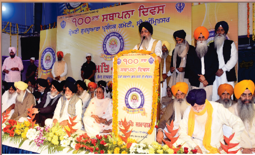
ਸ਼੍ਰੋਮਣੀ ਗੁਰਦੁਆਰਾ ਪ੍ਰਬੰਧਕ ਕਮੇਟੀ ਦੇ 100 ਸਾਲਾ ਸਥਾਪਨਾ ਦਿਵਸ ਮੌਕੇ ਗੁਰਦੁਆਰਾ ਸ੍ਰੀ ਮੰਜੀ ਸਾਹਿਬ ਦੀਵਾਨ ਹਾਲ ਸ੍ਰੀ ਅੰਮ੍ਰਿਤਸਰ ਵਿਖੇ ਕਰਵਾਏ ਗਏ ਮੁੱਖ ਸਮਾਗਮ ਮੌਕੇ ਸੰਬੰਧਨ ਕਰਦੇ ਹੋਏ ਡਾਟੀ ਗੋਬਿੰਦ ਸਿੰਘ ਲੌਂਗੋਵਾਲ ਅਤੇ ਹਾਜ਼ਰ ਪ੍ਰਮੁੱਖ ਸ਼ਖਸੀਅਤਾਂ। (17 ਨਵੰਬਰ)