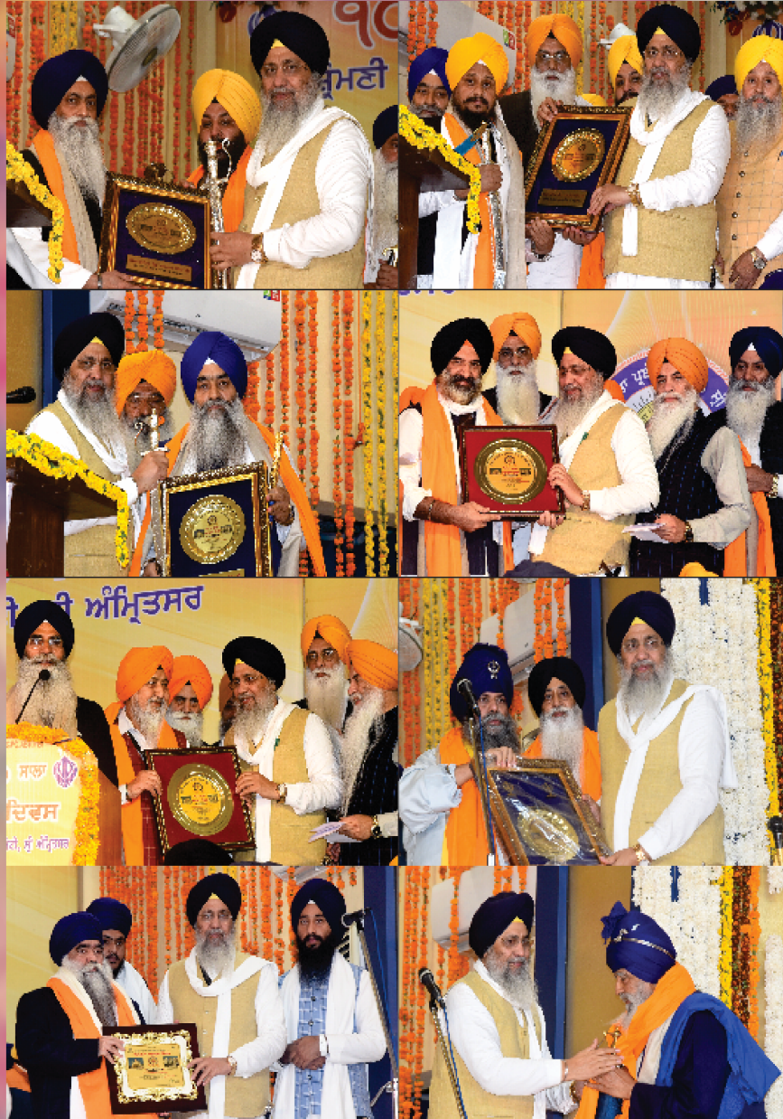
ਸ਼੍ਰੋਮਣੀ ਗੁਰਦੁਆਰਾ ਪ੍ਰਬੰਧਕ ਕਮੇਟੀ ਦੇ 100 ਜਾਨਾ ਸਥਾਪਨਾ ਦਿਵਸ ਸਮਾਗਮ ਮੌਕੇ ਪ੍ਰਮੁੱਖ ਸ਼ਖਸੀਅਤਾਂ ਦਾ ਸਨਮਾਨ