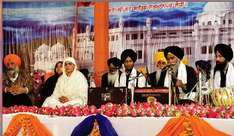
ਸ੍ਰੀ ਗੁਰੂ ਨਾਨਕ ਦੇਵ ਜੀ ਦੇ 551ਵੇਂ ਪ੍ਰਕਾਸ਼ ਪੁਰਬ ਮੌਕੇ ਗੁਰਦੁਆਰਾ ਸ੍ਰੀ ਬੇਰ ਸਾਹਿਬ ਸੁਲਤਾਨਪੁਰ ਲੋਧੀ ਵਿਖੇ ਕਰਵਾਏ ਗਏ ਗੁਰਮਤਿ ਸਮਾਗਮ ਦੌਰਾਨ ਹਾਜ਼ਰੀ ਭਰਦੇ ਹੋਏ ਸ਼੍ਰੋਮਣੀ ਕਮੇਟੀ ਦੇ ਪ੍ਰਧਾਨ ਬੀਬੀ ਜਗੀਰ ਕੌਰ, ਪ੍ਰੋ. ਪ੍ਰੇਮ ਸਿੰਘ ਚੰਦੂਮਾਜਰਾ ਸੀਨੀ:ਅਕਾਲੀ ਆਗੂ ਅਤੇ ਹੋਰ ਪ੍ਰਮੁੱਖ ਸ਼ਖਸੀਅਤਾਂ। (30 ਨਵੰਬਰ)