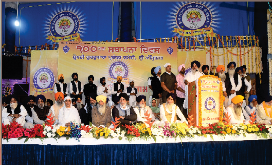
ਸ਼੍ਰੋਮਣੀ ਗੁਰਦੁਆਰਾ ਪ੍ਰਬੰਧਕ ਕਮੇਟੀ ਦੇ 100 ਸਾਲਾ ਸਥਾਪਨਾ ਦਿਵਸ ਮੌਕੇ ਗੁਰਦੁਆਰਾ ਸ੍ਰੀ ਮੰਜੀ ਸਾਹਿਬ ਦੀਵਾਨ ਹਾਲ ਸ੍ਰੀ ਅੰਮ੍ਰਿਤਸਰ ਵਿਖੇ ਕਰਵਾਏ ਗਏ ਮੁੱਖ ਸਮਾਗਮ ਮੌਕੇ ਸੰਬੰਧਨ ਕਰਦੇ ਹੋਏ ਸ. ਸੁਖਬੀਰ ਸਿੰਘ ਬਦਲ ਪ੍ਰਧਾਨ ਸ਼੍ਰੋਮਣੀ ਅਕਾਲੀ ਦਲ ਅਤੇ ਹਾਜ਼ਰ ਪ੍ਰਮੁੱਖ ਸ਼ਖਸੀਅਤਾਂ। (17 ਨਵੰਬਰ)