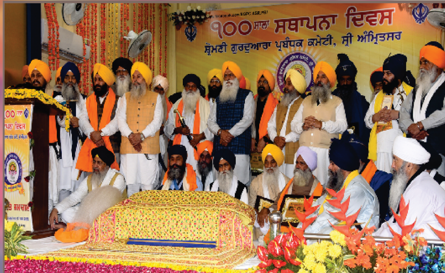
ਸ਼੍ਰੋਮਣੀ ਗੁਰਦੁਆਰਾ ਪ੍ਰਬੰਧਕ ਕਮੇਟੀ ਦੇ 100 ਸਾਲਾ ਸਥਾਪਨਾ ਦਿਵਸ ਮੌਕੇ ਗੁਰਦੁਆਰਾ ਸ੍ਰੀ ਮੰਜੀ ਸਾਹਿਬ ਦੀਵਾਨ ਹਾਲ ਸ੍ਰੀ ਅੰਮ੍ਰਿਤਸਰ ਵਿਖੇ ਕਰਵਾਏ ਗਏ ਮੁੱਖ ਸਮਾਗਮ ਜਮੇਂ ਸੰਬੰਧਨ ਕਰਦੇ ਹੋਏ ਸ੍ਰੀ ਅਕਾਲ ਤਖਤ ਸਾਹਿਬ ਦੇ ਜਥੇਦਾਰ ਗਿਆਨੀ ਹਰਪ੍ਰੀਤ ਸਿੰਘ। (17 ਨਵੰਬਰ)