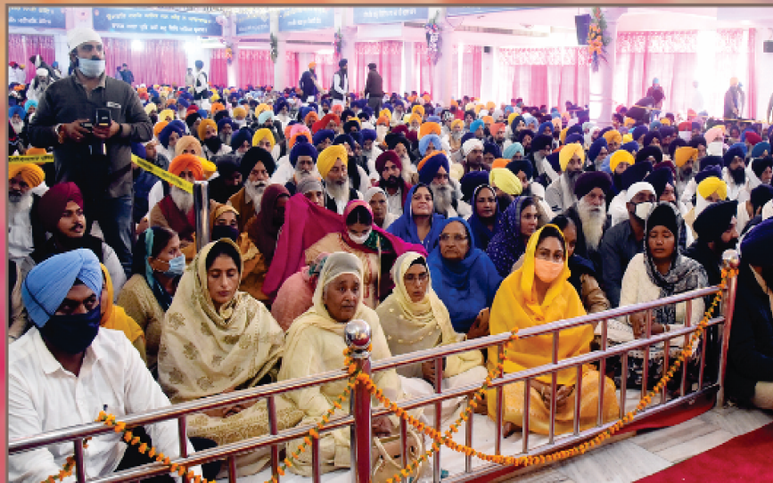
ਕ੍ਰੋਮਣੀ ਗੁਰਦੁਆਰਾ ਪ੍ਰਬੰਧਕ ਕਮੇਟੀ ਦੇ 100 ਸਾਲਾ ਸਥਾਪਨਾ ਦਿਵਸ ਮੌਕੇ ਗੁਰਦੁਆਰਾ ਸ੍ਰੀ ਮੰਜੀ ਸਾਹਿਬ ਦੀਵਾਨ ਹਾਲ ਸ੍ਰੀ ਅੰਮ੍ਰਿਤਸਰ ਵਿਖੇ ਕਰਵਾਏ ਗਏ ਮੁੱਖ ਸਮਾਗਮ 'ਚ ਰਾਜਰ ਸੰਗਤਾਂ। (17 ਨਵੰਬਰ)