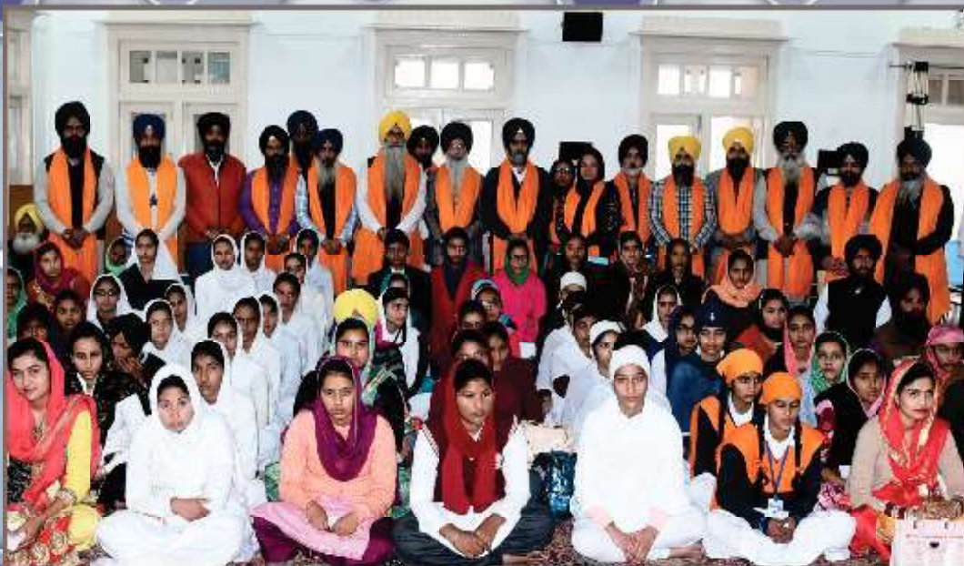
ਨਵੰਬਰ 2018 ਵਿਚ ਧਰਮ ਪ੍ਰਚਾਰ ਕਮੇਟੀ, ਬ੍ਰਹਮਣੀ ਗੁਰਦੁਆਰਾ ਪ੍ਰਬੰਧਕ ਕਮੇਟੀ ਵੱਲੋਂ ਲਈ ਗਈ ਧਾਰਮਿਕ ਪ੍ਰੀਖਿਆ ਦੌਰਾਨ ਮੋਰਿਟ 'ਚ ਆਏ ਵਿਦਿਆਰਥੀਆਂ ਨੂੰ ਸਨਮਾਨਿਤ ਕਰਨ ਸਮੇਂ ਦਾ ਦ੍ਰਿਸ਼। (25 ਫਰਵਰੀ)