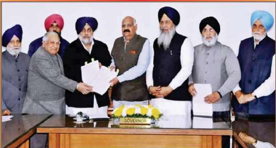
ਸ਼੍ਰੋਮਣੀ ਗੁਰਦੁਆਰਾ ਪ੍ਰਬੰਧਕ ਕਮੇਟੀ ਦੇ ਪ੍ਰਧਾਨ ਭਾਈ ਗੋਬਿੰਦ ਸਿੰਘ ਲੌਗੋਵਾਲ ਤੇ ਸ਼੍ਰੋਮਣੀ ਅਕਾਲੀ ਦਲ ਦੇ ਪ੍ਰਧਾਨ ਸ. ਸੁਖਬੀਰ ਸਿੰਘ ਬਾਦਲ ਦੀ ਅਗਵਾਈ ਹੇਠ ਵਫਦ ਮੈਂਬਰ ਪੰਜਾਬ ਦੇ ਰਾਜਪਾਲ ਸ਼੍ਰੀ ਵੀ. ਪੀ. ਸਿੰਘ ਬਦਨੌਰ ਨੂੰ ਪੰਜਾਬ ਸਰਕਾਰ ਵੱਲੋਂ ਹਰਿਆਣਾ ਗੁਰਦੁਆਰਾ ਕਮੇਟੀ ਸਬੰਧੀ ਨੁਪਰੀਮ ਕੋਰਟ ਵਿਚ ਦਿੱਤਾ ਹਲਫਨਾਮਾ ਤੁਰੰਤ ਵਾਪਸ ਲੈਣ ਲਈ ਨਿਰਦੇਸ਼ ਜਾਰੀ ਕਰਨ ਸਬੰਧੀ ਮੰਗ ਪੱਤਰ ਦਿੰਦੇ ਹੋਏ।