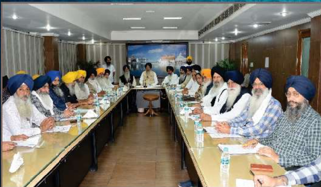
ਸ਼੍ਰੋਮਣੀ ਕਮੇਟੀ ਦਫ਼ਤਰ ਵਿਖੇ ਹੋਈ ਐਂਟਿਕੁਗ ਕਮੇਟੀ ਦੀ ਵਿਕੇਂਦਰਤਾ ਦੀ ਪ੍ਰਧਾਨਗੀ ਕਰਦੇ ਹੋਏ ਪ੍ਰਧਾਨ ਭਾਈ ਗੋਬਿੰਦ ਸਿੰਘ ਲੌਂਗੋਵਾਲ, ਹਜ਼ਰ ਅਹੁਦੇਦਾਰ ਤੇ ਐਂਟਿਕੁਗ ਮੈਂਬਰ ਸਾਹਿਬਾਨ ਅਤੇ ਅਧਿਕਾਰੀ। (5 ਨਵੰਬਰ)