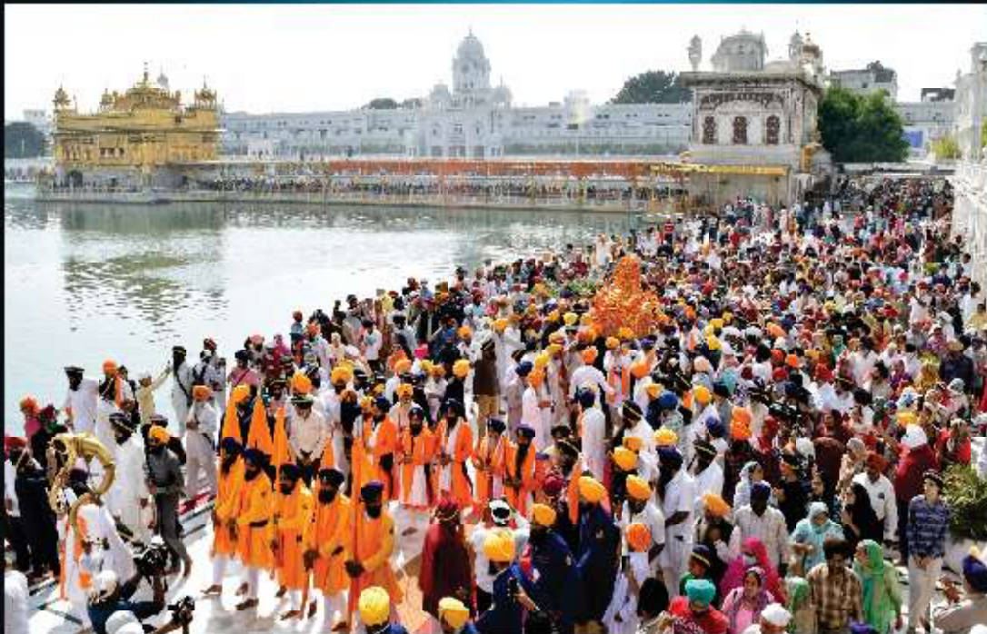
ਸ੍ਰੀ ਗੁਰੂ ਰਾਮਦਾਸ ਜੀ ਦੇ ਪ੍ਰਕਾਸ਼ ਗੁਰਪੁਰਬ ਨੂੰ ਸਮਰਪਿਤ ਸ੍ਰੀ ਅਕਾਲ ਤਖ਼ਤ ਸਾਹਿਬ ਤੋਂ ਸਜਾਏ ਨਗਰ ਕੀਰਤਨ ਦੇ ਸੰਚਾਲਕ ਸ੍ਰੀ ਹਰਿਮੰਦਰ ਸਾਹਿਬ ਦੀਆਂ ਪਰਿਕਰਮਾ ਵਿਚੋਂ ਲੰਘਣ ਸਮੇਂ ਦਾ ਅਲੌਕਿਕ ਦ੍ਰਿਸ਼। (31 ਅਕਤੂਬਰ)