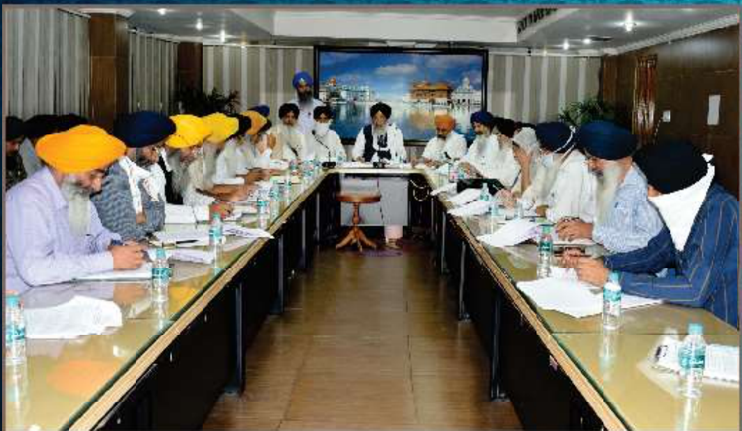
ਦਫਤਰ ਸ਼੍ਰੋਮਣੀ ਕਮੇਟੀ ਵਿਖੇ ਹੋਈ ਔਰੰਗ ਕਮੇਟੀ ਦੀ ਇਕੱਤਰਤਾ ਦੀ ਪ੍ਰਧਾਨਗੀ ਕਰਦੇ ਹੋਏ ਪ੍ਰਧਾਨ ਭਾਈ ਗੋਬਿੰਦ ਸਿੰਘ ਲੌਂਗੋਵਾਲ, ਹਾਜ਼ਰ ਅਹੁਦੇਦਾਰ ਤੇ ਔਰੰਗ ਮੈਂਬਰ ਸਾਹਿਬਾਨ ਅਤੇ ਅਧਿਕਾਰੀ। (26 ਅਕਤੂਬਰ)