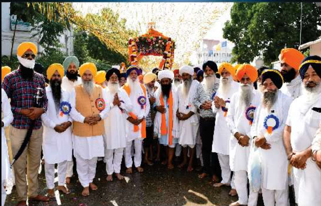
ਸ੍ਰੀ ਗੁਰੂ ਰਾਮਦਾਸ ਜੀ ਦੇ ਪ੍ਰਕਾਸ਼ ਗੁਰਪੁਰਬ ਨੂੰ ਸਮਰਪਿਤ ਸਜਾਏ ਗਏ ਨਗਰ ਕੀਰਤਨ ਸਮੇਂ ਰਾਜਰ ਸਿੱਖ ਸ਼ਖ਼ਸੀਅਤਾਂ, ਸ਼੍ਰੋਮਣੀ ਕਮੇਟੀ ਦੇ ਮੈਂਬਰ ਸਾਹਿਬਾਨ, ਅਧਿਕਾਰੀ ਤੇ ਸੰਗਤਾਂ। (31 ਅਕਤੂਬਰ)