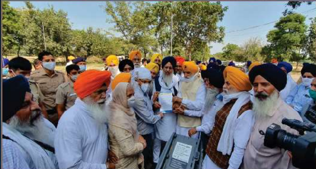
ਸ਼੍ਰੋਮਣੀ ਕਮੇਟੀ ਮੈਂਬਰਾਨ ਤੇ ਮੁਲਾਜ਼ਮਾਂ ਵਿਰੁੱਧ ਕੀਤੇ ਗਏ ਕਰਾਮ ਪਰਚੇ ਦੇ ਵਿਰੋਧ ਵਿਚ ਸ਼੍ਰੋਮਣੀ ਕਮੇਟੀ ਪ੍ਰਧਾਨ ਭਾਈ ਗੋਬਿੰਦ ਸਿੰਘ ਲੌਂਗੋਵਾਲ ਦੀ ਅਗਵਾਈ ਵਿਚ ਮੈਂਬਰ ਸਾਹਿਬਾਨ ਵੱਲੋਂ ਚੰਡੀਗੜ੍ਹ ਵਿਖੇ ਮੁੱਖ ਮੰਤਰੀ ਕੈਪਟਨ ਅਮਰਿੰਦਰ ਸਿੰਘ ਦੀ ਕੋਠੀ ਬਾਹਰ ਲਗਾਏ ਧਰਨੇ ਉਪਰੰਤ ਮੁੱਖ ਮੰਤਰੀ ਦੇ ਨਾਮ ਉਨ੍ਹਾਂ ਦੇ ਓ.ਐਸ.ਡੀ. ਨੂੰ ਮੰਗ ਪੱਤਰ ਸੌਂਪਦੇ ਹੋਏ ਭਾਈ ਲੌਂਗੋਵਾਲ ਤੋਂ ਹੋਰ। (30 ਅਕਤੂਬਰ)