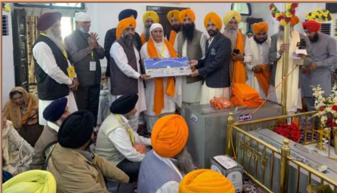
ਸ੍ਰੀ ਗੁਰੂ ਨਾਨਕ ਦੇਵ ਜੀ ਦੇ ਪ੍ਰਕਾਸ਼ ਗੁਰਪੁਰਬ ਸਮੇਂ ਗੁਰਦੁਆਰਾ ਸ੍ਰੀ ਦਰਬਾਰ ਸਾਹਿਬ ਕਰਤਾਰਪੁਰ ਸਾਹਿਬ ਵਿਖੇ ਸ਼੍ਰੋਮਣੀ ਕਮੇਟੀ ਪ੍ਰਧਾਨ ਬੀਬੀ ਜਗੀਰ ਕੌਰ ਨੂੰ ਸਨਮਾਨਿਤ ਕਰਦੇ ਹੋਏ ਪਾਕਿਸਤਾਨ ਗੁਰਦੁਆਰਾ ਪ੍ਰਬੰਧਕ ਕਮੇਟੀ ਦੇ ਨੁਮਾਇੰਦੇ। (19 ਨਵੰਬਰ)