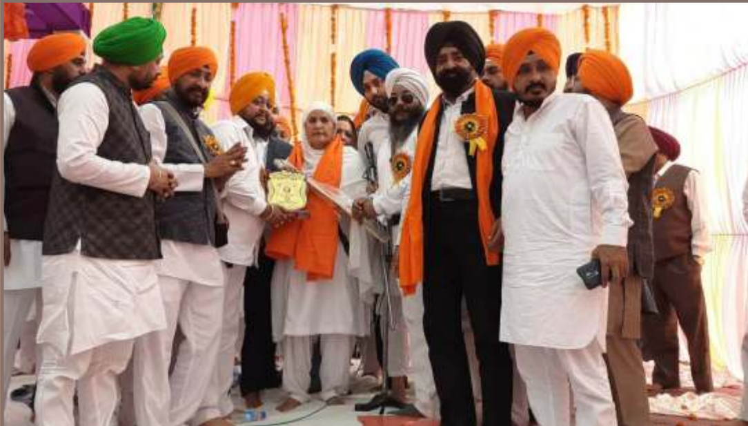
ਸ੍ਰੀ ਗੁਰੂ ਤੇਗ ਬਹਾਦਰ ਸਾਹਿਬ ਜੀ ਦੇ 400 ਸਾਲਾ ਪ੍ਰਕਾਸ਼ ਪੁਰਬ ਨੂੰ ਸਮਰਪਿਤ ਉੱਤਰ ਪ੍ਰਦੇਸ਼ ਦੇ ਨੂਰਪੁਰ ਵਿਖੇ ਗੁਰਮਤਿ ਸਮਾਗਮ ਸਮੇਂ ਸ਼੍ਰੋਮਣੀ ਕਮੇਟੀ ਪ੍ਰਧਾਨ ਬੀਬੀ ਜਗੀਰ ਕੌਰ ਨੂੰ ਸਨਮਾਨਿਤ ਕਰਦੇ ਹੋਏ ਪ੍ਰਬੰਧਕ ਤੇ ਹੋਰ। (23 ਨਵੰਬਰ)