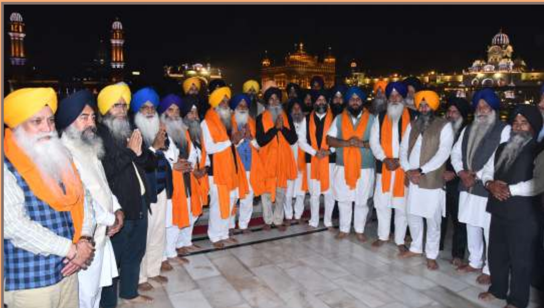
ਸ਼੍ਰੋਮਣੀ ਗੁਰਦੁਆਰਾ ਪ੍ਰਬੰਧਕ ਕਮੇਟੀ ਦੇ ਨਵੇਂ ਚੁਣੇ ਗਏ ਪ੍ਰਧਾਨ, ਸਮੂਹ ਅਹੁਦੇਦਾਰ ਅਤੇ ਅੰਤ੍ਰਿੰਗ ਮੈਂਬਰ ਸਾਹਿਬਾਨ ਦੀ ਸੱਚਖੰਡ ਸ੍ਰੀ ਹਰਿਮੰਦਰ ਸਾਹਿਬ ਦੀ ਪਰਿਕਰਮਾ ਅੰਦਰ ਯਾਦਗਾਰੀ ਤਸਵੀਰ। (29 ਨਵੰਬਰ)