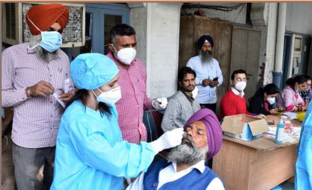
ਸ਼੍ਰੋਮਣੀ ਕਮੇਟੀ ਦਫ਼ਤਰ ਵਿਖੇ ਕੋਰੋਨਾ ਜਾਂਚ ਕੈਂਪ ਦੌਰਾਨ ਸੈਂਪਲ ਦਿੰਦੇ ਹੋਏ ਪਾਕਿਸਤਾਨ ਜਾਣ ਵਾਲੇ ਜੱਥੇ ਦੇ ਸ਼ਰਧਾਲੂ। (14 ਨਵੰਬਰ)