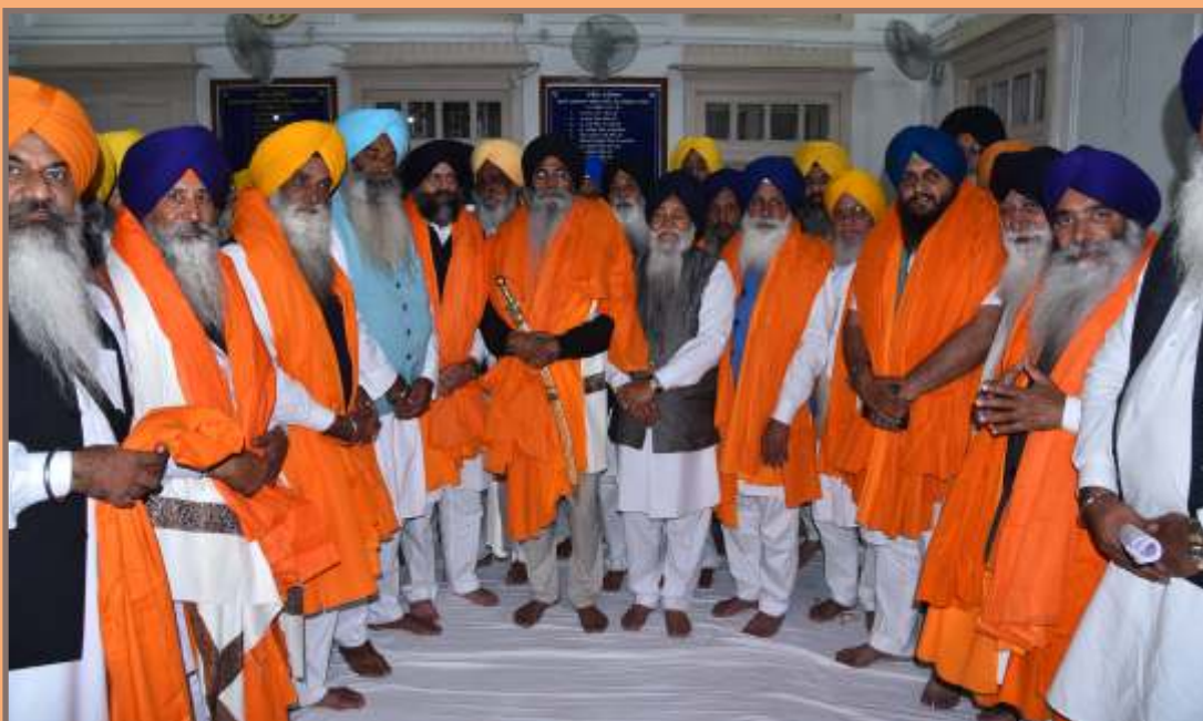
ਸ਼੍ਰੋਮਣੀ ਗੁਰਦੁਆਰਾ ਪ੍ਰਬੰਧਕ ਕਮੇਟੀ ਦੇ ਜਨਰਲ ਇਜਲਾਸ ਦੌਰਾਨ ਨਵੇਂ ਚੁਣੇ ਗਏ ਪ੍ਰਧਾਨ, ਅਹੁਦੇਦਾਰ ਤੇ ਅੰਤਿਮ ਮੈਂਬਰ ਸਾਹਿਬਾਨ ਸਿੰਘ ਸਾਹਿਬਾਨ ਪਾਸੋਂ ਸਿਰੋਪਾਓ ਦੀ ਬਖਸਿਸ਼ ਲੈਣ ਉਪਰੰਤ। (29 ਨਵੰਬਰ)