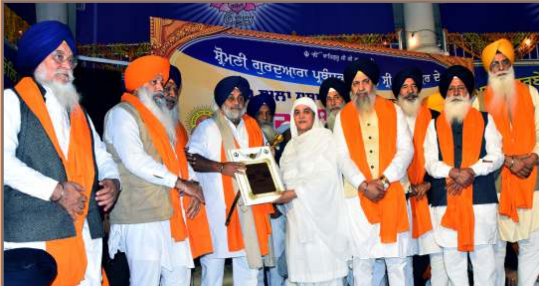
ਸ਼੍ਰੋਮਣੀ ਗੁਰਦੁਆਰਾ ਪ੍ਰਬੰਧਕ ਕਮੇਟੀ ਦੇ 101 ਸਾਲਾ ਸਥਾਪਨਾ ਦਿਵਸ ਮੌਕੇ ਗੁਰਦੁਆਰਾ ਸ੍ਰੀ ਮੰਜੀ ਸਾਹਿਬ ਦੀਵਾਨ ਹਾਲ ਵਿਖੇ ਕਰਵਾਏ ਗਏ ਵਿਸ਼ਾਲ ਗੁਰਮਤਿ ਸਮਾਗਮ ਦੌਰਾਨ ਸ਼੍ਰੋਮਣੀ ਅਕਾਲੀ ਦਲ ਦੇ ਪ੍ਰਧਾਨ ਸ. ਸੁਖਬੀਰ ਸਿੰਘ ਬਾਦਲ ਨੂੰ ਸਨਮਾਨਿਤ ਕਰਦੇ ਹੋਏ ਬੀਬੀ ਜਗੀਰ ਕੌਰ ਪ੍ਰਧਾਨ ਸ਼੍ਰੋਮਣੀ ਕਮੇਟੀ ਅਤੇ ਭਾਈ ਗੋਬਿੰਦ ਸਿੰਘ ਲੌਂਗੋਵਾਲ ਸਾਬਕਾ ਪ੍ਰਧਾਨ ਸ਼੍ਰੋਮਣੀ ਕਮੇਟੀ ਅਤੇ ਹੋਰ ਪ੍ਰਮੁੱਖ ਸ਼ਖਸੀਅਤਾਂ। (15 ਨਵੰਬਰ)