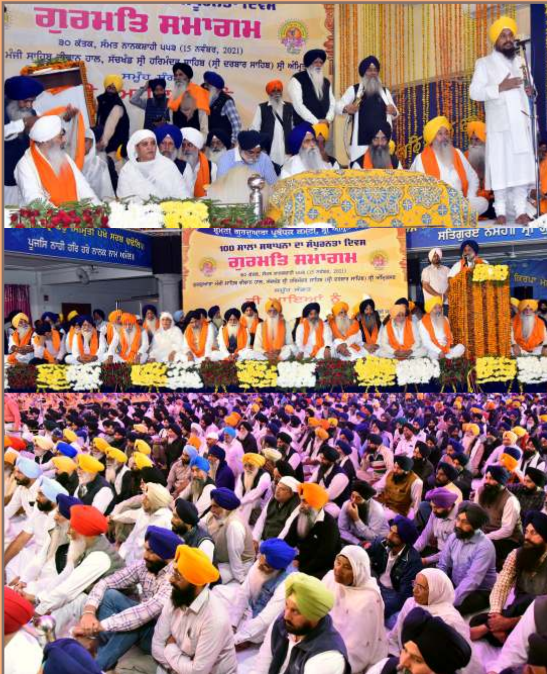
(1) ਸ਼੍ਰੋਮਣੀ ਗੁਰਦੁਆਰਾ ਪ੍ਰਬੰਧਕ ਕਮੇਟੀ ਦੇ 101 ਸਾਲਾ ਸਥਾਪਨਾ ਦਿਵਸ ਮੌਕੇ ਗੁਰਦੁਆਰਾ ਸ੍ਰੀ ਮੰਜੀ ਸਾਹਿਬ ਦੀਵਾਨ ਹਾਲ ਵਿਖੇ ਕਰਵਾਏ ਗਏ ਵਿਸ਼ਾਲ ਗੁਰਮਤਿ ਸਮਾਗਮ ਦੌਰਾਨ ਸੰਗਤਾਂ ਨੂੰ ਸੰਬੋਧਨ ਕਰਦੇ ਹੋਏ ਸ੍ਰੀ ਅਕਾਲ ਤਖਤ ਸਾਹਿਬ ਦੇ ਜਥੇਦਾਰ ਗਿਆਨੀ ਹਰਪ੍ਰੀਤ ਸਿੰਘ। (2-3) ਇਸ ਮੌਕੇ ਸੰਗਤਾਂ ਨੂੰ ਸੰਬੋਧਨ ਕਰਦੇ ਹੋਏ ਸ਼੍ਰੋਮਣੀ ਅਕਾਲੀ ਦਲ ਦੇ ਪ੍ਰਧਾਨ ਸ. ਸੁਖਬੀਰ ਸਿੰਘ ਬਾਦਲ ਅਤੇ ਹਾਜ਼ਰ ਸੰਗਤਾਂ (15 ਨਵੰਬਰ)