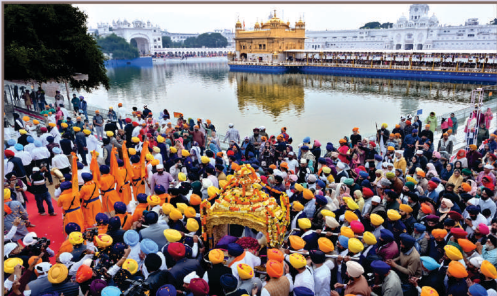
ਸ੍ਰੀ ਗੁਰੂ ਨਾਨਕ ਦੇਵ ਜੀ ਦੇ ਪ੍ਰਕਾਸ਼ ਪੁਰਬ ਸਬੰਧੀ ਸ੍ਰੀ ਅਕਾਲ ਤਖ਼ਤ ਸਾਹਿਬ ਤੋਂ ਸਜਾਏ ਗਏ ਨਗਰ ਕੀਰਤਨ ਦਾ ਸੱਚਖੰਡ ਸ੍ਰੀ ਹਰਿਮੰਦਰ ਸਾਹਿਬ ਦੀਆਂ ਪਰਿਕਰਮਾਂ ਵਿਚ ਮਨਮੋਹਕ ਦ੍ਰਿਸ਼। (25 ਨਵੰਬਰ)