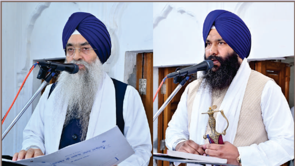
ਬੰਦੀਫੌਜ ਦਿਵਸ ਮੌਕੇ ਸ੍ਰੀ ਅਕਾਲ ਤਖ਼ਤ ਸਾਹਿਬ ਦੇ ਜਥੇਦਾਰ ਗਿਆਨੀ ਰਘਬੀਰ ਸਿੰਘ ਸੱਚਖੰਡ ਸ੍ਰੀ ਹਰਿਮੰਦਰ ਸਾਹਿਬ ਦੀ ਦਰਸ਼ਨੀ ਡਿਓਰੀ ਤੋਂ ਸਿੱਖ ਪੰਥ ਦੇ ਨਾਂ ਸੰਦੇਸ਼ ਦਿੰਦੇ ਹੋਏ ਅਤੇ ਤਖ਼ਤ ਸ੍ਰੀ ਕੇਸਗੜ੍ਹ ਸਾਹਿਬ ਦੇ ਜਥੇਦਾਰ ਗਿਆਨੀ ਸੁਲਤਾਨ ਸਿੰਘ ਸੰਗਤਾਂ ਨੂੰ ਬੰਦੀ ਫੌਜ ਦਿਵਸ ਦੀ ਵਧਾਈ ਦਿੰਦੇ ਹੋਏ। (12 ਨਵੰਬਰ)