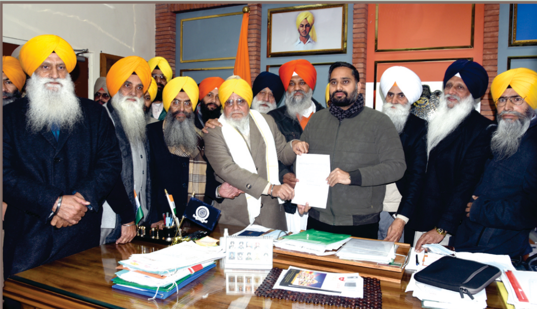
ਮੁੱਖ ਮੰਤਰੀ ਸ. ਭਗਵੰਤ ਸਿੰਘ ਮਾਨ ਵੱਲੋਂ ਗੁਰੂ ਦੀ ਗੋਲਕ ਤੇ ਸ਼੍ਰੋਮਣੀ ਕਮੇਟੀ ਮੈਂਬਰਾਂ ਵਿਰੁੱਧ ਅਪਮਾਨਜਨਕ ਸ਼ਬਦਾਵਲੀ ਵਰਤੇ ਜਾਣ ਦੇ ਵਿਰੋਧ ਵਿਚ ਮੁੱਖ ਮੰਤਰੀ ਦੇ ਨਾਂ ਅੰਮ੍ਰਿਤਸਰ ਦੇ ਡਿਪਟੀ ਕਮਿਸ਼ਨਰ ਨੂੰ ਪੱਤਰ ਸੌਂਪਦੇ ਹੋਏ ਸ਼੍ਰੋਮਣੀ ਕਮੇਟੀ ਮੈਂਬਰ ਸਾਹਿਬਾਨ ਤੇ ਅਧਿਕਾਰੀ। (5 ਜਨਵਰੀ)