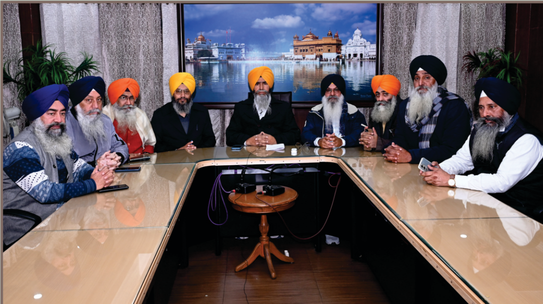
ਮੋਹਾਲੀ ਵਿਖੇ ਕੌਮੀ ਇਨਸਾਫ ਮੋਰਚੇ ਦੌਰਾਨ ਸ਼ਮੂਲੀਅਤ ਮਗਰੋਂ ਵਾਪਸ ਜਾਣ ਸਮੇਂ ਸ਼੍ਰੋਮਣੀ ਕਮੇਟੀ ਦੇ ਪ੍ਰਧਾਨ ਐਡਵੋਕੇਟ ਸ. ਹਰਜਿੰਦਰ ਸਿੰਘ ਧਾਮੀ 'ਤੇ ਕੁਝ ਲੋਕਾਂ ਵੱਲੋਂ ਕੀਤੇ ਗਏ ਹਮਲੇ ਦੀ ਸ਼੍ਰੋਮਣੀ ਕਮੇਟੀ ਦੇ ਅਧਿਕਾਰੀਆਂ ਨੇ ਸਖ਼ਤ ਨਿੰਦਾ ਕੀਤੀ (19 ਜਨਵਰੀ)