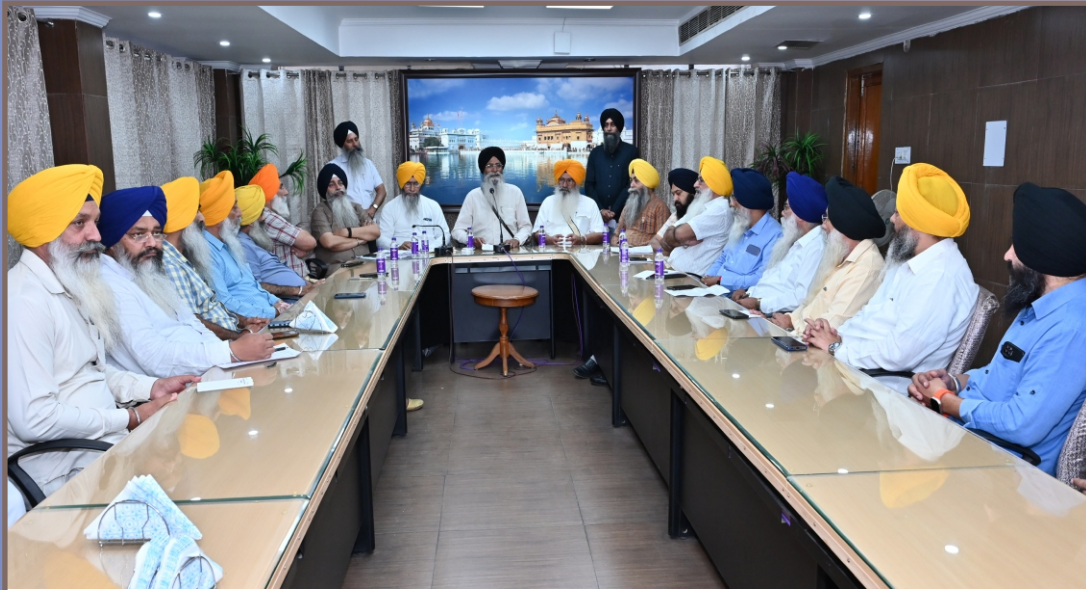
ਜੂਨ 1984 ਦੇ ਘੱਲੂਘਾਰੇ ਦੇ ਸ਼ਹੀਦੀ ਸਮਾਗਮ ਦੇ ਪ੍ਰਬੰਧਾਂ ਸਬੰਧੀ ਸ਼੍ਰੋਮਣੀ ਕਮੇਟੀ ਅਧਿਕਾਰੀਆਂ ਨਾਲ ਕੀਤੀ ਇਕੱਤਰਤਾ ਕਰਦੇ ਹੋਏ ਸ਼੍ਰੋਮਣੀ ਕਮੇਟੀ ਪ੍ਰਧਾਨ ਐਡਵੋਕੇਟ ਸ. ਹਰਜਿੰਦਰ ਸਿੰਘ ਧਾਮੀ। (30 ਮਈ)