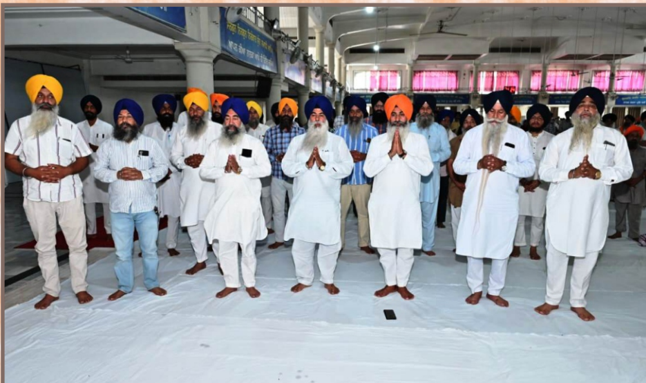
ਮਹਾਰਾਜਾ ਰਣਜੀਤ ਸਿੰਘ ਦੀ ਬਰਸੀ ਸਬੰਧੀ ਗੁਰਦੁਆਰਾ ਸ੍ਰੀ ਮੰਜੀ ਸਾਹਿਬ ਵਿਖੇ ਕਰਵਾਏ ਗਏ ਸਮਾਗਮ ਵਿਚ ਬਾਮਲ ਮੈਨੇਜਰ ਸਾਹਿਬਾਨ ਤੇ ਸੰਗਤਾਂ। (29 ਜੂਨ)