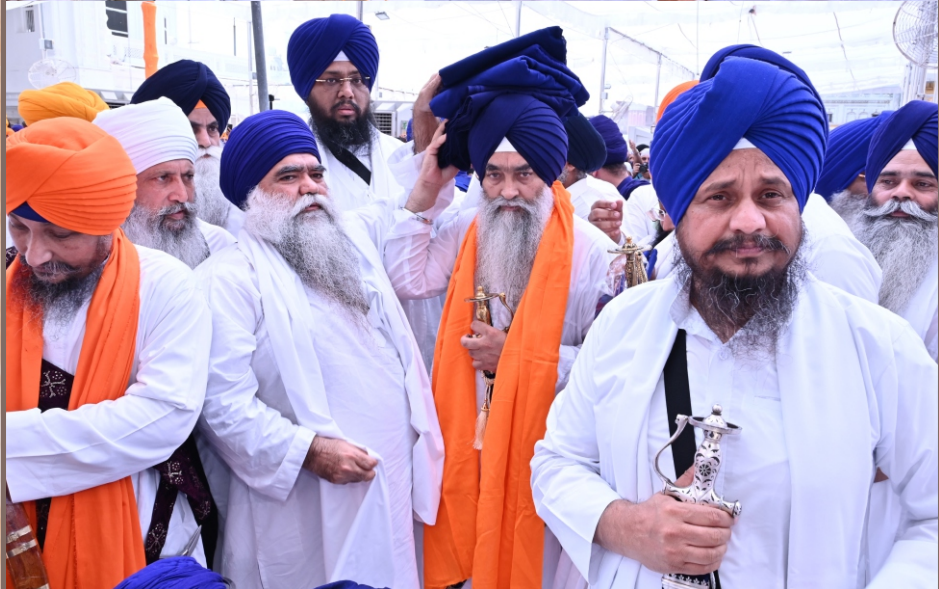
ਸ੍ਰੀ ਅਕਾਲ ਤਖਤ ਸਾਹਿਬ ਸ੍ਰੀ ਅੰਮ੍ਰਿਤਸਰ ਦੇ ਜਥੇਦਾਰ ਗਿਆਨੀ ਰਘਬੀਰ ਸਿੰਘ ਦੇ ਸੇਵਾ ਸੰਭਾਲਣ ਸਮੇਂ ਅਰਦਾਸ ਵਿਚ ਸ਼ਾਮਲ ਸਮੂਹ ਸੰਗਤਾਂ ਤੇ ਹੇਠਾਂ ਦਸਤਾਰਾਂ ਭੇਟ ਕਰਦੇ ਹੋਏ ਸਿੰਘ ਸਾਹਿਬਾਨ, ਬ੍ਰਹਮਣੀ ਕਮੇਟੀ ਦੇ ਪ੍ਰਧਾਨ ਅਤੇ ਹੋਰ ਧਾਰਮਿਕ ਸ਼ਖਸੀਅਤਾਂ। (22 ਜੂਨ)