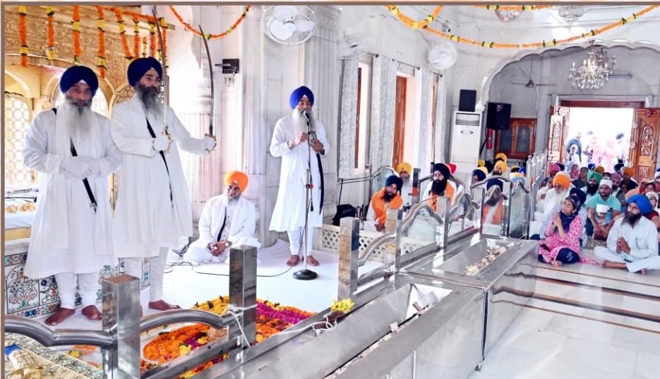
ਸ੍ਰੀ ਅਕਾਲ ਤਖ਼ਤ ਸਾਹਿਬ ਵਿਖੇ ਮੀਰੀ ਪੀਰੀ ਦਿਵਸ ਮੌਕੇ ਕਰਵਾਏ ਗਏ ਸਮਾਗਮ ਸਮੇਂ ਸੰਗਤ ਨੂੰ ਸੰਬੋਧਨ ਕਰਦੇ ਹੋਏ ਗਿਆਨੀ ਰਘਬੀਰ ਸਿੰਘ ਜਥੇਦਾਰ ਸ੍ਰੀ ਅਕਾਲ ਤਖ਼ਤ ਸਾਹਿਬ ਅਤੇ ਸ੍ਰੀ ਗੁਰੂ ਹਰਿਗੋਬਿੰਦ ਸਾਹਿਬ ਦੀਆਂ ਇਤਿਹਾਸਕ ਮੀਰੀ ਤੇ ਪੀਰੀ ਦੀਆਂ ਕਿਰਪਾਨਾਂ ਦੇ ਸੰਗਤ ਨੂੰ ਦਰਸ਼ਨ ਕਰਵਾਉਣ ਮੌਕੇ ਦਾ ਦ੍ਰਿਸ਼। (28 ਜੂਨ)