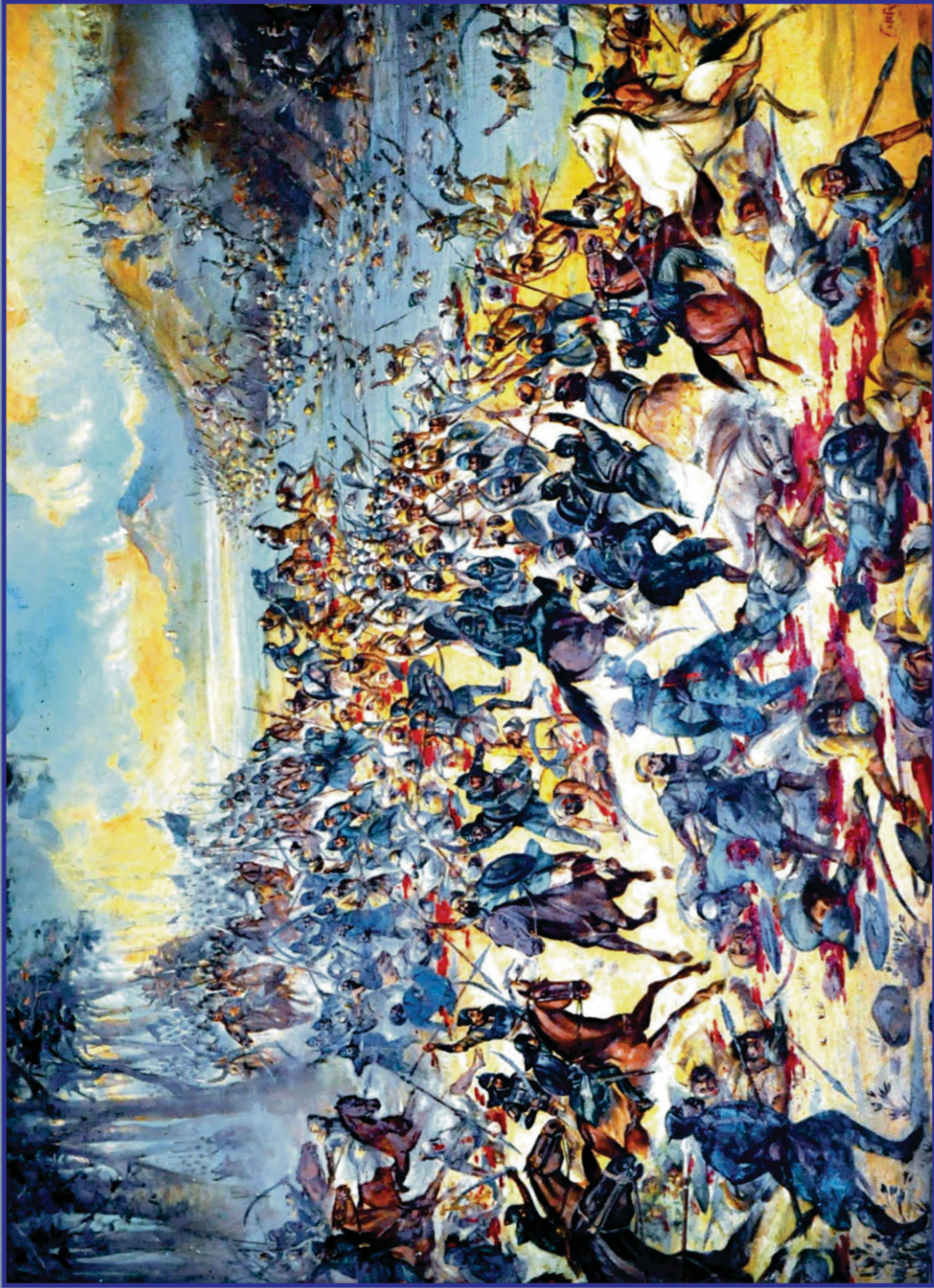
ਕਾਹਨੂਵਾਨ ਦੀ ਛੱਡ ਵਿਖੇ ਵਾਪਰੇ ਛੋਟੇ ਘੱਲੂਘਾਰੇ ਦਾ ਇੱਕ ਚਿੱਤਰ