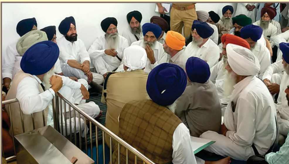
ਹੁਸ਼ਿਆਰਪੁਰ ਜ਼ਿਲ੍ਹੇ ਦੇ ਪਿੰਡ ਚੀਮਾ ਪੋਤਾ ਵਿਖੇ ਬੀਤੇ ਦਿਨੀਂ ਸ੍ਰੀ ਗੁਰੂ ਗ੍ਰੰਥ ਸਾਹਿਬ ਜੀ ਦੀ ਬੇਅਦਬੀ ਘਟਨਾ ਤੋਂ ਬਾਅਦ ਸ਼੍ਰੋਮਣੀ ਕਮੇਟੀ ਦੇ ਪ੍ਰਧਾਨ ਐਡਵੋਕੇਟ ਹਰਜਿੰਦਰ ਸਿੰਘ ਧਾਮੀ ਪਿੰਡ ਦੇ ਗੁਰਦੁਆਰਾ ਸਾਹਿਬ ਵਿਖੇ ਪੁੱਜ ਕੇ ਘਟਨਾ ਸਬੰਧੀ ਜਾਣਕਾਰੀ ਪ੍ਰਾਪਤ ਕਰਦੇ ਹੋਏ। (19 ਅਪ੍ਰੈਲ)