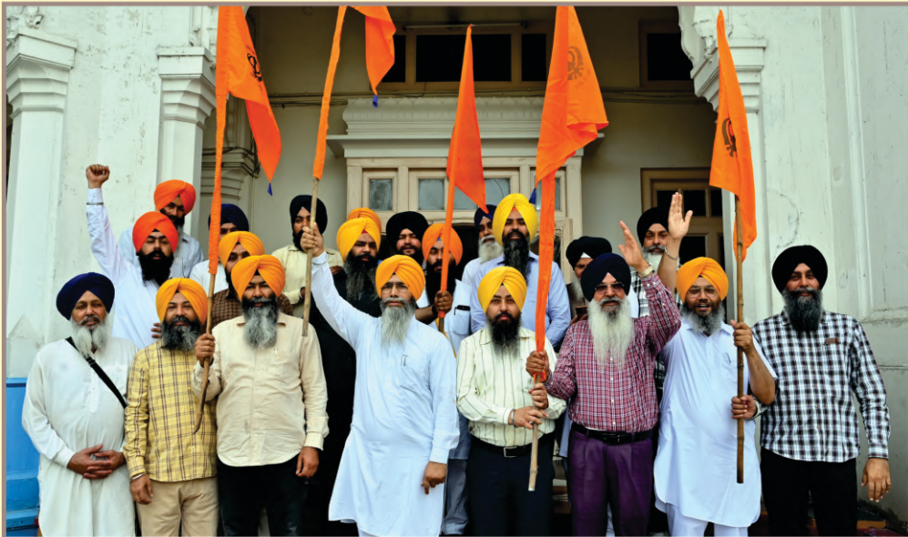
ਪੰਜ ਸਿੰਘ ਸਾਹਿਬਾਨ ਵੱਲੋਂ 325ਵੇਂ ਖਾਲਸਾ ਸਾਜਣਾ ਦਿਵਸ ਮੌਕੇ ਸਮੁੱਚੀ ਸਿੱਖ ਕੌਮ ਨੂੰ ਖਾਲਸਈ ਝੰਡੇ ਝੁਲਾਉਣ ਦੇ ਆਦੇਸ਼ ਮੁਤਾਬਿਕ ਸ਼੍ਰੋਮਣੀ ਕਮੇਟੀ ਦੇ ਅਧਿਕਾਰੀ ਅਤੇ ਕਰਮਚਾਰੀ ਸ਼੍ਰੋਮਣੀ ਕਮੇਟੀ ਦੇ ਦਫ਼ਤਰ ਸਮੂਹ ਵਿਚ ਖਾਲਸਈ ਨਿਸ਼ਾਨ ਝੁਲਾਉਂਦੇ ਹੋਏ। (13 ਅਪ੍ਰੈਲ)