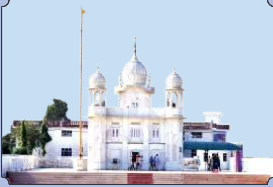
गुरुद्वारा जन्म-स्थान श्री गुरु अंगद देव जी, गाँव मत्ते दी सरां ( सराय नागा ), ज़िला श्री मुक्तसर साहिब