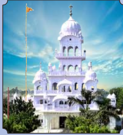
गुरुद्वारा जन्म-स्थान श्री गुरु अमरदास जी, गाँव बासरके गिल्लां, ज़िला श्री अमृतसर साहिब