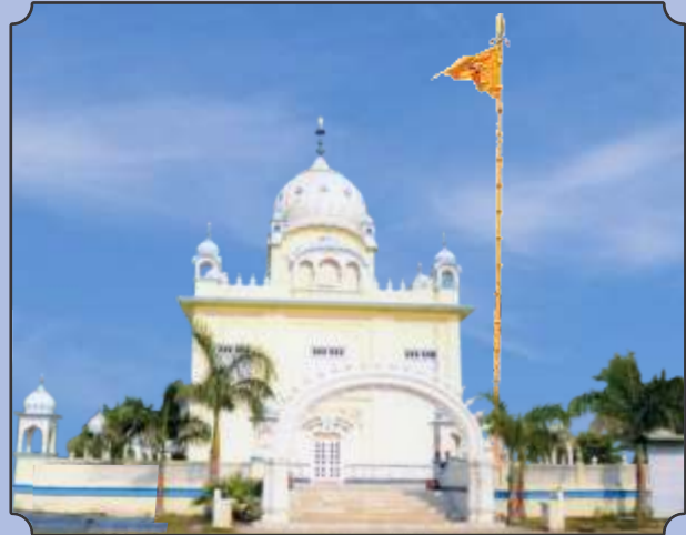
गुरुद्वारा जन्म-स्थान भक्त धन्ना जी, गाँव धुआं कलां, ज़िला टोंक, राजस्थान