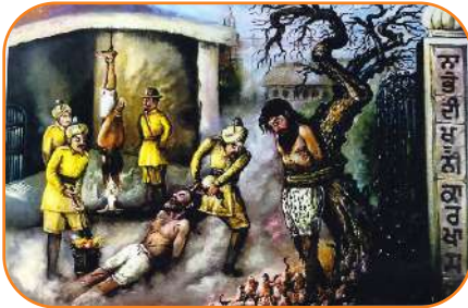
ਨਾਭੇ ਦੇ ਜ਼ਾਲਮ ਹਾਕਮ ਖੂਨੀ ਕਾਰਖ਼ਾਸ ਵਿਚ ਜਥਿਆਂ ਦੇ ਸਿੰਘਾਂ ਉੱਪਰ ਅੰਨ੍ਹਾ ਤਸੱਦਦ ਕਰਦੇ ਹੋਏ