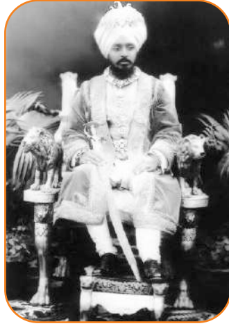
ਮਹਾਰਾਜਾ ਰਿਪੁਦਮਨ ਸਿੰਘ