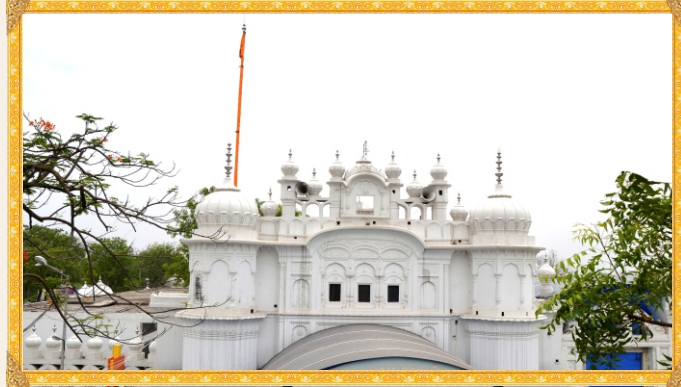
ਗੁਰਦੁਆਰਾ ਬਾਬਾ ਗੁਰਦਿੱਤਾ ਜੀ, ਸ੍ਰੀ ਕੀਰਤਪੁਰ ਸਾਹਿਬ