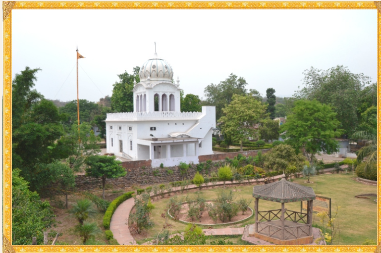
ਨੌ ਲੱਖਾ ਬਾਗ, ਗੁਰਦੁਆਰਾ ਹਰਿਮੰਦਰ ਸਾਹਿਬ, ਸ੍ਰੀ ਕੀਰਤਪੁਰ ਸਾਹਿਬ