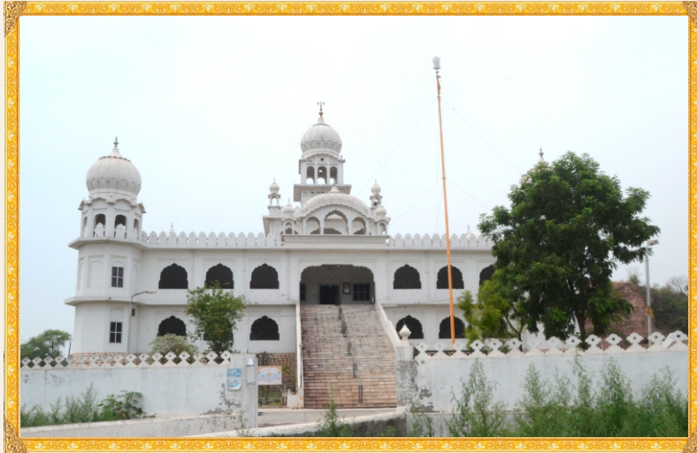
ਗੁਰਦੁਆਰਾ ਚਰਨ ਕੰਵਲ ਸਾਹਿਬ, ਸ੍ਰੀ ਕੀਰਤਪੁਰ ਸਾਹਿਬ