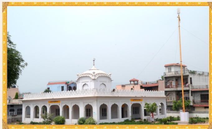
ਗੁਰਦੁਆਰਾ ਬਿਬਾਨਗੜ੍ਹ ਸਾਹਿਬ, ਸ੍ਰੀ ਕੀਰਤਪੁਰ ਸਾਹਿਬ