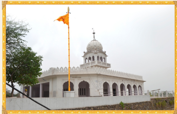
ਗੁਰਦੁਆਰਾ ਤੀਰ ਸਾਹਿਬ, ਸ੍ਰੀ ਕੀਰਤਪੁਰ ਸਾਹਿਬ